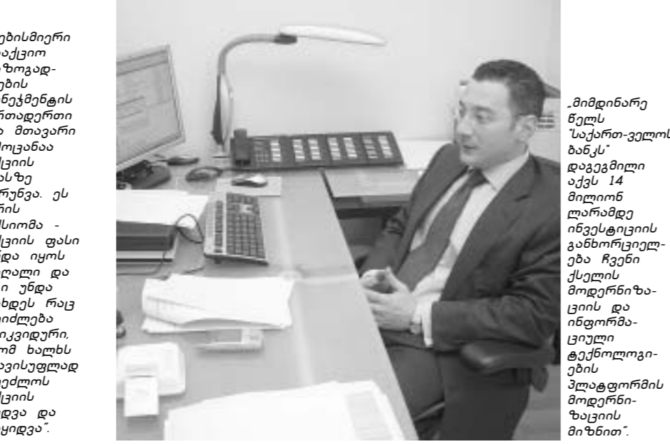
მიმდინარე წელს საქართველოს ბანკს დაგეგმილი აქვს 14 მილიონ ლარამდე ინვესტიციის განხორციელება ჩვენი ქსელის მოდერნიზაციის და ინფორმაციული ტექნოლოგიების პლატფორმის მიდინარეობის მიზნით.