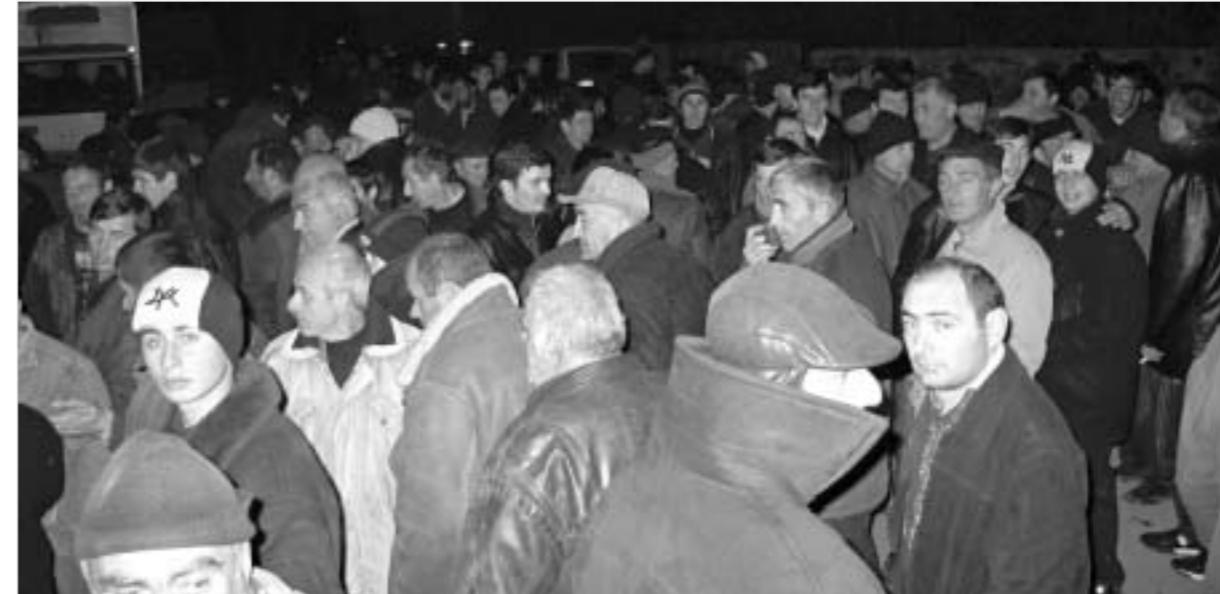
სამსათიანი აქციის შემდეგ მოსახლეობა უიმედოდ დაიშალა.