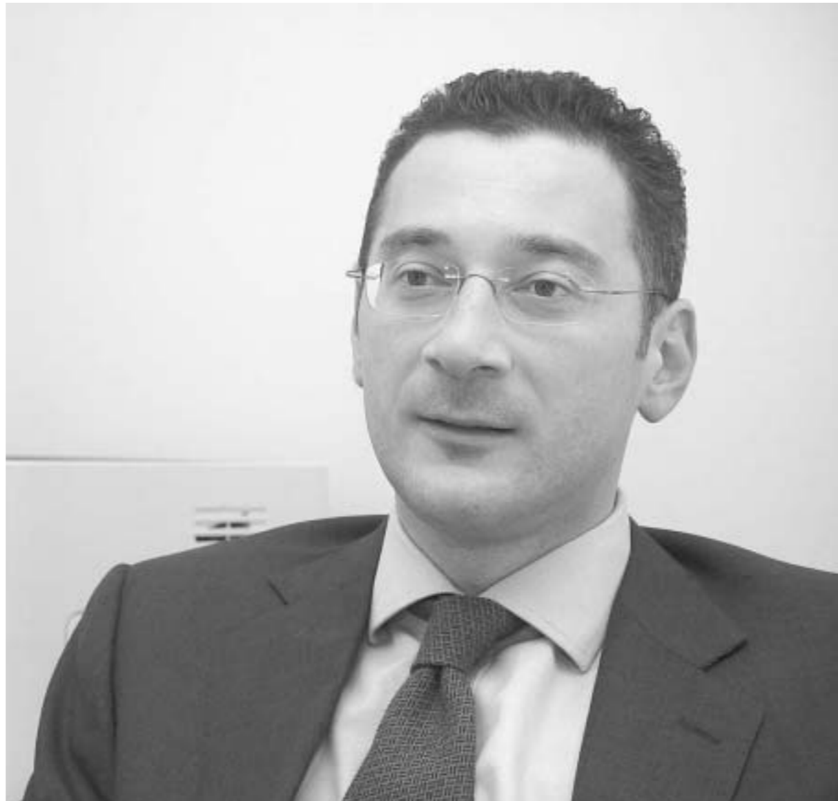
საქართველოს ბანკის პრეზიდენტი ლადო გურგენია

რამდენად დააინტერესებთ საქართველოს ბანკის სამეთვალყურეო საბჭოს გადაწყვეტილებით ბანკის გენერალური დირექტორის სავარგელი დაიკავა.