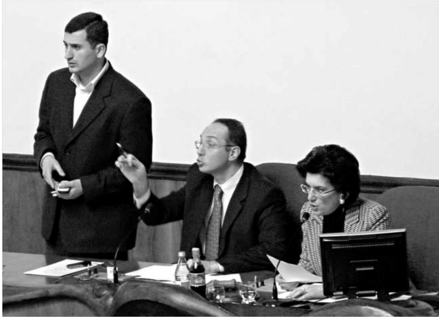
უმრავლესობის საკომანდო პუნქტი.