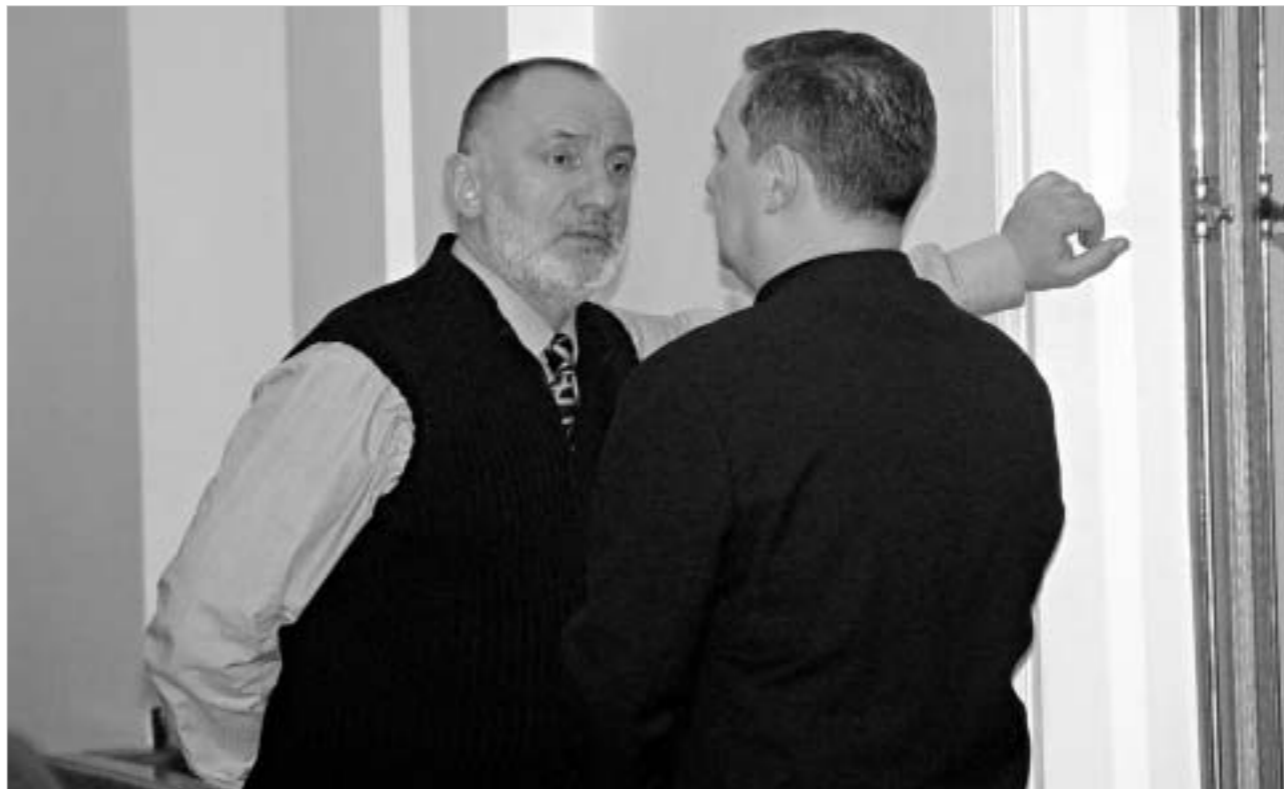
გოვა ხაინდრავა და მისი მოადგილე გია ვოლსკი პარლამენტის წინაშე გამოსვლისთვის ემზადებიან.