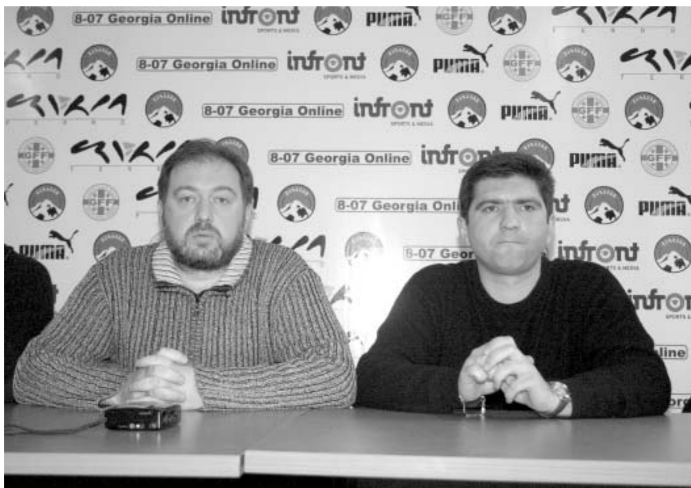
გუშინ კლუბების ლიცენზირების პრობლემებზე ისაუბრეს.

მეორე ნაწილი სტადიონების ლიცენზირებას ეხება. დღეს საქართველოში მხოლოდ ორი სტადიონია, რომელიც მეტ-ნაკლებად უახლოვდება ლიცენზირების გაველისთვის აუცილებელ პირობებს. ეს არის ბორის პაიჭაძის სახელობის ეროვნული სტადიონი და “ლოკომოტივი”, რომელსაც ეროვნულზე უკეთ აქვს საქმე. ორივე სტადიონის ლიცენზირება კი აუცილებელია იმ უბრალო მიზეზი გამო, რომ უფასო კვლავ აქვს დანესებული: მხოლოდ ორ გუნდს შეუ-