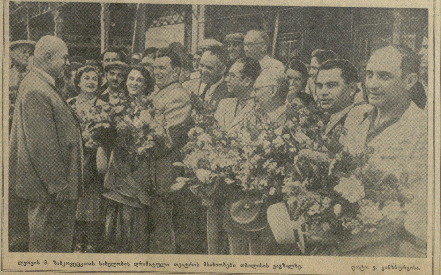
ლეოვის მ. ზანკოვიკაის სახელობის დრამატული თეატრის მსახიობები თბილისის ვაჟა-ფშაველას სახელობის თეატრის მსახიობებთან ერთად.