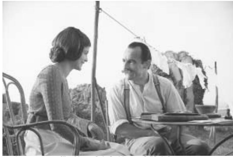
ოდრი ტოტო ფილმში ძალიან ხანგრძლივი ნიშნობა.