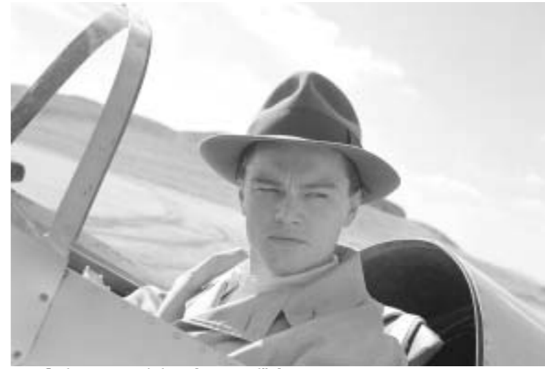
ლეონარდო დი კაპრიო 'ავიატორში'.

ახლა ის დროა, როცა ფარდებს ხსნიან, დეკორაციებს ალაგებენ, გრიმს იშორებენ, მინაგან სიცარიელეს გრძობენ და კარგად გამოძინებაზე ოცნებობენ. "ოსკარი" დამთავრდა. პოლივუდმა კიდევ ერთხელ გადაიხადა ქეიფი, რომლისთვისაც მთელი წლის განმავლობაში ემზადებოდა და საზოგადოებასაც ამზადებდა. "ოსკარები" ძირითად და მეორეხარისხოვან