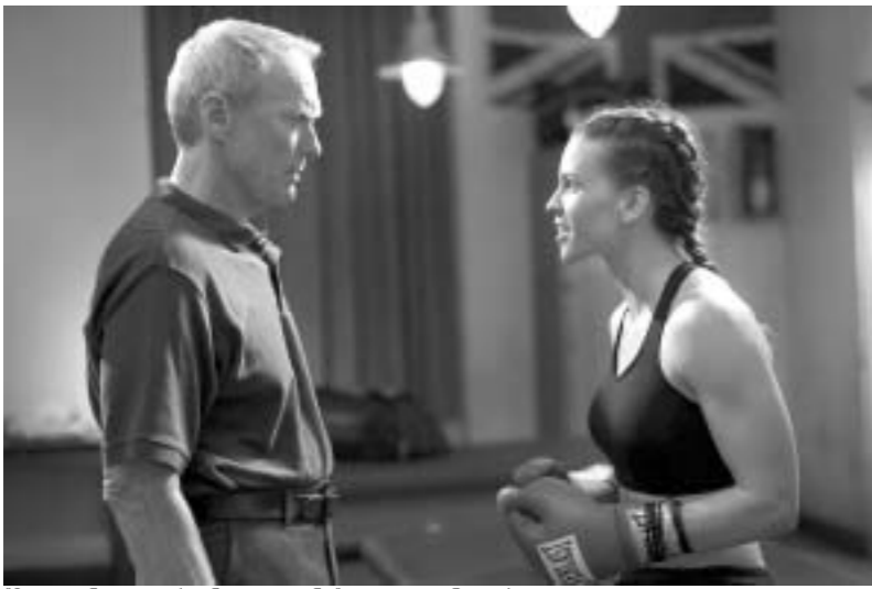
მილიონდოლარიანი გოგონა და კლინტ ისტუუდი.