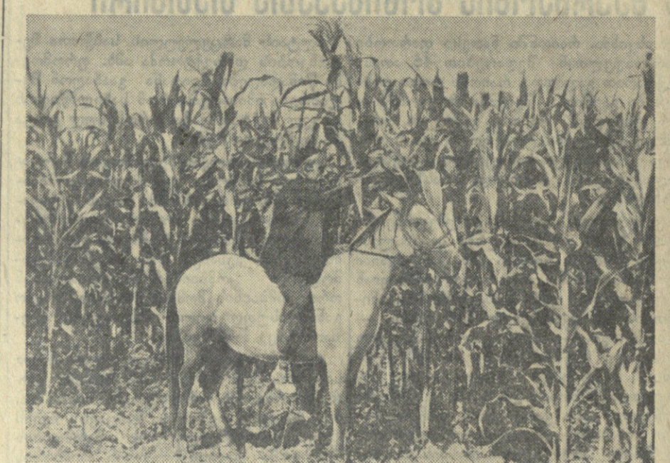
ამ სურათზე იქვე ხედავთ მწიფე, გავრცელებულ სიძინდს. თვისი პროგრესული მეთოდის გამოყენებით აი ატარებდა მისი დაგეგმილი საზომების რაიონის სოფელ თამარია-ნის პრაქტიკული მუშაობის კომპლექსურად. სურათზე ამ ნაკვეთის მამულო კომპლექსურად დაგეგმვის, რომელიც სიძინდი შეპყრებს კვარატულ-გურდობრივად ნათეს სიძინდს.

ოტლათა წლის წინათ — 1924 წლის 12 ივნისს — კომპაგნიის VI ყრილობამ იხილა გარდასახვის კომპლექსური ცენტრის ახალგაზრდობის კომუნისტურ კავშირს ეწოდება რუსეთის ახალგაზრდობის ცენტრის ახალგაზრდობის კავშირის ცენტრის დახმარებით. ამ წინ განმეობაში განმეობდა და გაზარდა კომპაგნიის არია — საშუალო ახალგაზრდობის მოწინააღმდეგე. 1924 წელს კომპაგნიის 700.000 ქალიშვილი და ქმარე იყო, ხოლო საკომპაგნიო ალექსი ყრილობისათვის, რომელიც ამა წლის მარტში მომდინარეობდა, ლენინური კომპაგნიის რიგებში იყო უკვე 18.825.327 წევრი. კომპაგნიის მთელი საქმიანობის სანამოლო პროგრამა ვ. ი. ლენინის ისტორიული სიტყვა რუსეთის ახალგაზრდობის კომუნისტურ კავშირის III ყრილობაზე "ახალგაზრდობის კავშირის ამოცანების შესახებ". საშუალო სასწავლებლის განვითარების ყველა ეტაპზე კომპაგნიის მიერ კომუნისტური პარტიის ხელმძღვანელობით ახალგაზრდობის ძალადობა, ენერჯის, ინტელექტუალური ახალგაზრდობის წინაშე კომპაგნიის დახმარებით, საკომპაგნიო მეთოდით განხორციელდა. ლენინური კომპაგნიის მოხმად იქვე წინააღმდეგობა დაინიშნა ორი ორ-ღონი, წითელი ღრობის ორღონი და შრომის წითელი ღრობის ორღონი, რომლებიც კომპაგნიის მიერ დაფუძნებული მილიონობით კომპაგნიის სახელები დახმარებით განხორციელდა. ლენინის ორი ორღონი, წითელი ღრობის ორღონი და შრომის წითელი ღრობის ორღონი, რომლებიც კომპაგნიის მიერ დაფუძნებული მილიონობით კომპაგნიის სახელები დახმარებით განხორციელდა.