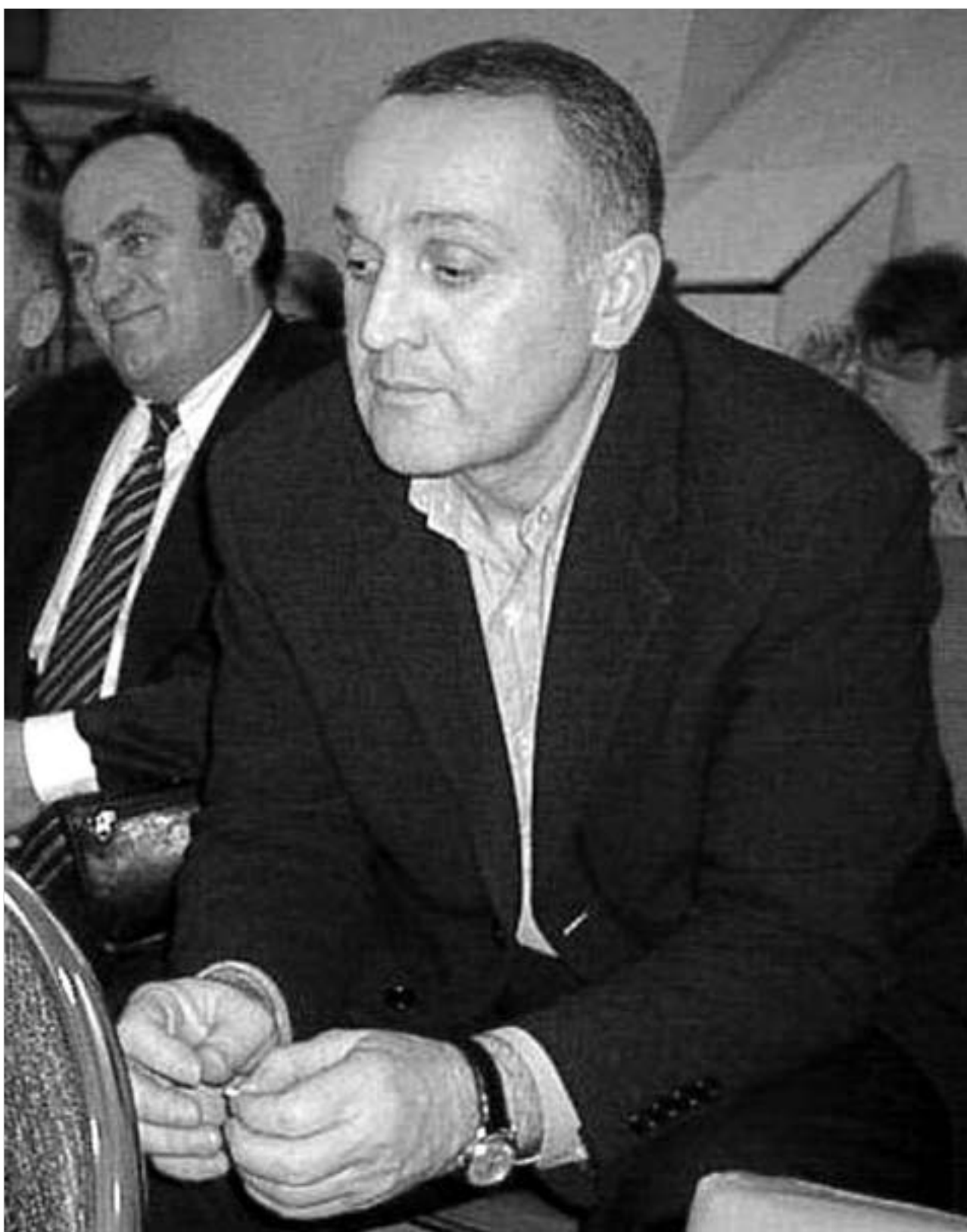
ალექსანდრე ანკვაბზე თავდასხმა აფხაზეთში კლანური დაპირისპირების დასაწყისადღაც განიხილება.