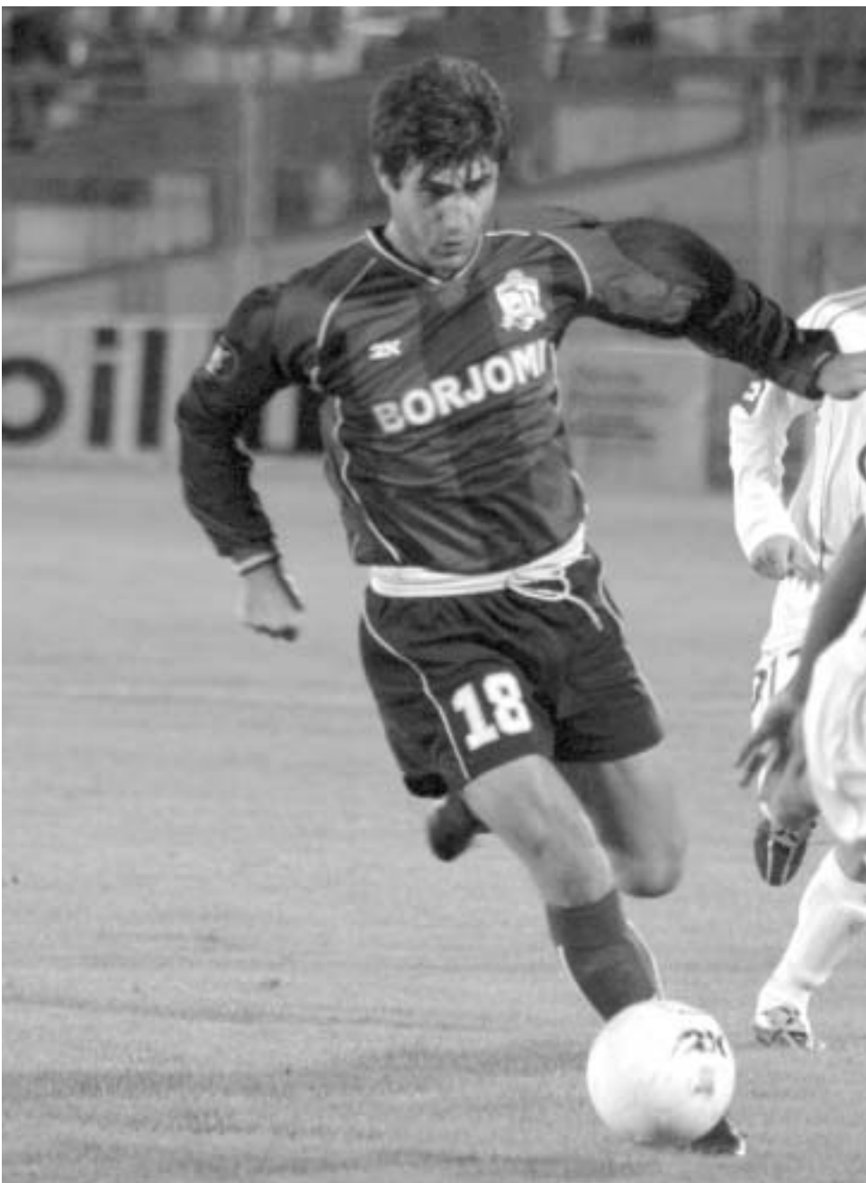
მელქაძემ პეტი-თრეკი შეასრულა