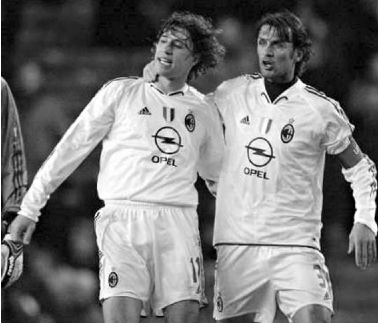
"მილანი" ჩემპიონთა ლიგაში "მანჩესტერ იუნაიტედს" ორჯერ უკვე მოუგო