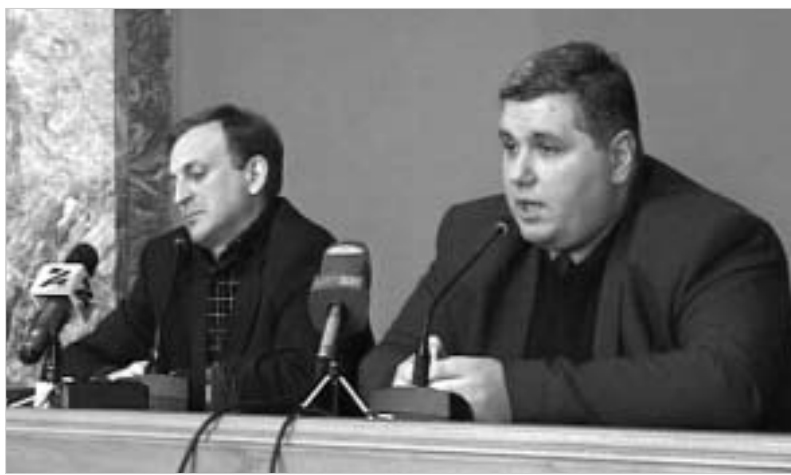
ფინანსური პოლიციის მაღალი ჩინოსნები ნარკომანიში ამხილეს.

ნარკომანი ჩინოვნიკების გამოსავლენად რამდენიმე თვის წინ დაწყებული ფართომასშტაბიანი შემოწმებები შეიძლება კითხვის წინაშე დადგეს. მართალია, ნარკოლოგიური შემოწმებების შემდეგ ათობით თანამდებობის პირი დაემშვიდობა საგარეოებს, მაგრამ, როგორც ჩანს, აღნიშნული სენით დაავადებული მაღალჩინოსნები სხვადასხვა ხერხებით კვლავ რჩებიან ცალკეულ ორგანოში. სამაგიეროდ, თანამდებობას ემშვიდობებიან ის პოლიციელები, რომლებსაც ნარკომანი თანამდებობის პირების გამოვლენა აქვთ დავალებული. ყოველ შემთხვევაში, გუშინ პარლამენტში გამართულ პრესკონფერენციაზე ოპოზიციური კობა დავითაშვილის დახმარებით სწორედ ასეთი ისტორია გახმაურდა.