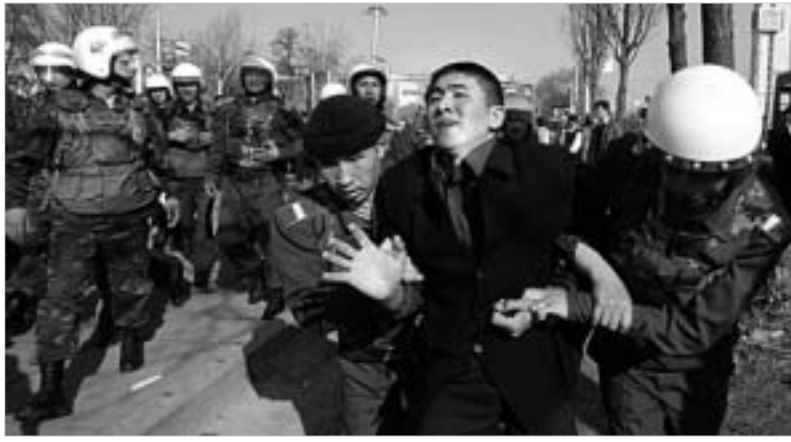
ყირგიზეთში რეპრესიები იწყება

რამდენიმე დღიანი დაძაბულობის შემდეგ, სახელისუფლებო ძალები შეტევაზე გადავიდნენ და ყირგიზეთის დედაქალაქში საპროტესტო აქცია საეცრაზმის საშუალებით დაიწყო. გაეროცვლადი ინფორმაციით, დაპატიმრებული არიან აქციის ორგანიზატორები. აშკარა - ასაკურ აკავენი დამოუკიდებლად არ აპირებს.