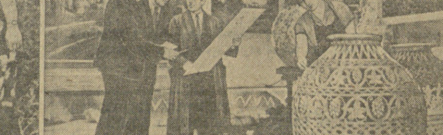
საქართველოს სსრ მინისტრთა საბჭოს დასაჯებელი...