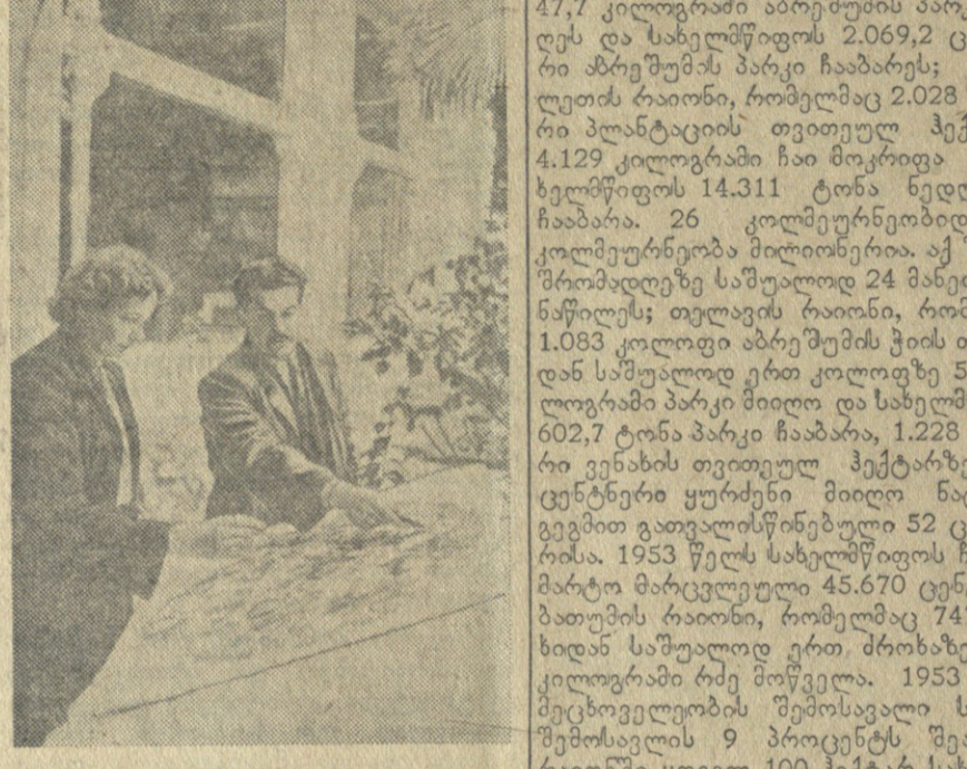
საქართველოს პავლიონის მთავარი მხატვარი...