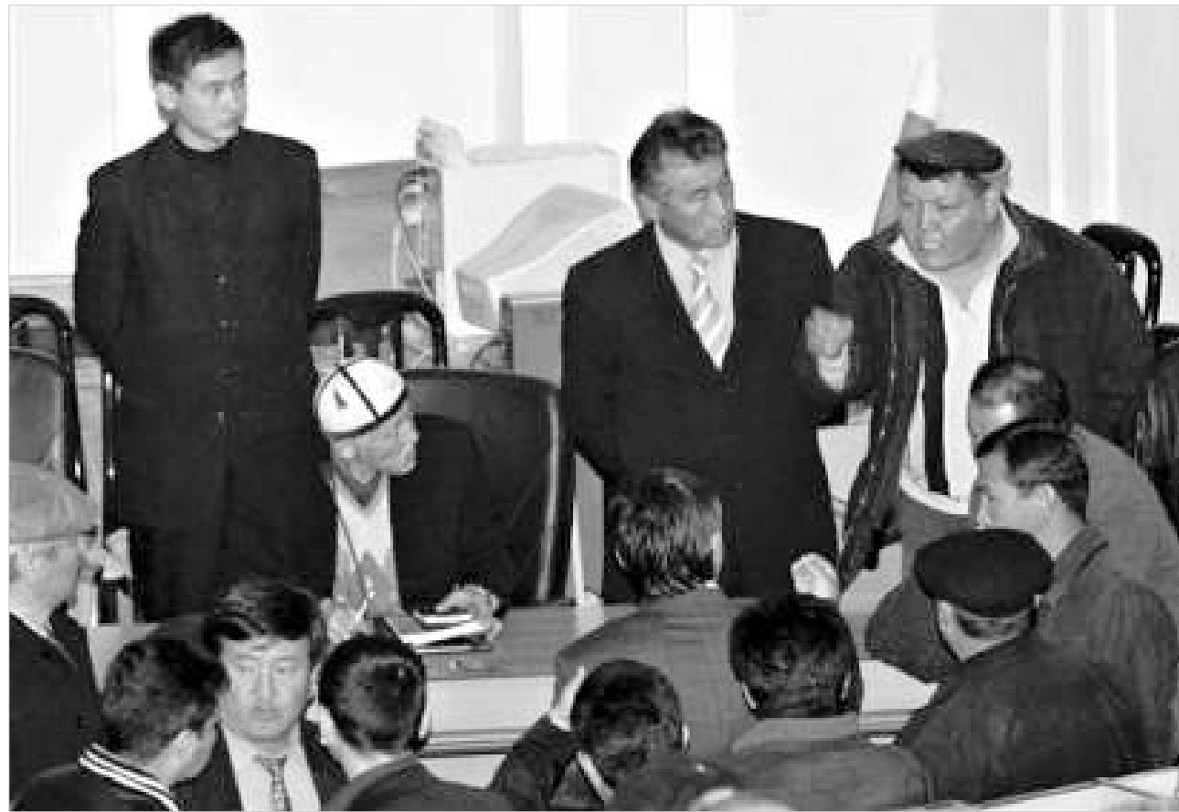
არჩევნების გაყალბების მოტივით დაწყებული “რევოლუციის” ლიდერებმა პარლამენტის ლეგიტიმობა აღიარეს.