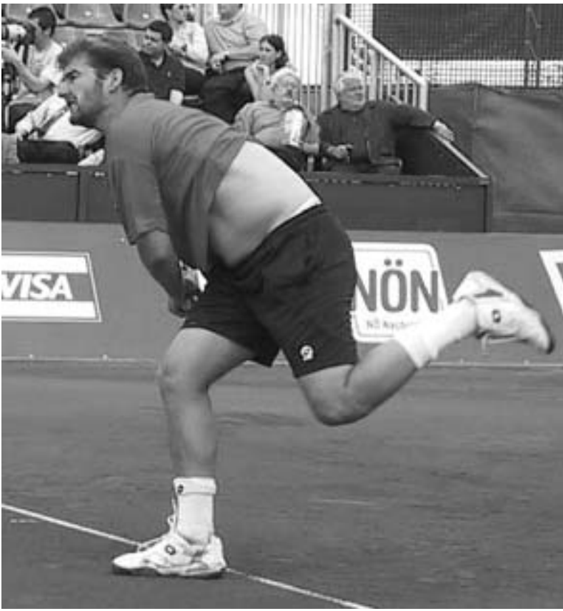
მარატ საფინი (რუსეთი, 3) - ირაკლი ლაბაძე პიუნ-ტაიკი (ს. კორეა) - მიხაილ უტენი (რუსეთი, 17) ირფი ნოვაკი (ჩეხეთი) - კვინი კიში (აშშ) ტომას იუზანსონი (შვედეთი, 25) - გრეგ რუსდესკი (ბრიტანეთი) კარლოს მოია (ესპანეთი, 5) - ჯუიმი ბლეიკი (აშშ) ტომი რიშერდო (ესპანეთი, 12) - იოანა ბიორკმანი (შვედეთი) ვადო მონფილი (საფრანგეთი) - ნიკოლაი დავიდენკო (რუსეთი, 14) ივორ ანდრეევი (რუსეთი) - ანდრე პაველი (რუმინეთი, 20) იუსუნტ სეუდია (აშშ, 21) - რობი ჯინგერი (აშშ) ზინა კარსის ფერერი (ესპანეთი) - ვლადიმერ კანაისი (არგენტინა, 11) ივან ლუბოვიჩი (სერბეთი, 13) - ალბერტო მარტინი (ესპანეთი) ფერნანდო ვერდასკო (ესპანეთი) - ენდი როდიკი (აშშ, 2) 7:6, 4:3 როდიკმა თამაში შეწყვიტა. დომინიკ პრბატე (სლოვაკეთი, 26) - იარკო ნიემენენი (ფინეთი) დიეგი ფერერი (ესპანეთი) - ქსავე მალისი (ბელგია, 32) 3:6, 5:5 მალისმა თამაში შეწყვიტა. რაფელ ნადალი (ესპანეთი, 29) - რინიერ შუტლერი (გერმანია) 6:4, 7:6 დიეგი ნალბანდიანი (არგენტინა, 8) - ხოსე აკასუსი (არგენტინა) 6:4, 2:6, 7:6 (7:5) 6:1, 6:4 6:1, 6:2 6:3, 6:4 4:6, 7:5, 7:6 6:4, 6:0 4:6, 6:1, 6:4 6:2, 6:1 6:3, 6:4 6:4, 2:6, 6:4 6:3, 6:3 6:3, 6:6 6:3, 6:6 6:4, 7:6 6:3, 6:6

როდიკის გავარდნის შემდეგ ეს არც იყო გასაკვირი. საფინი და