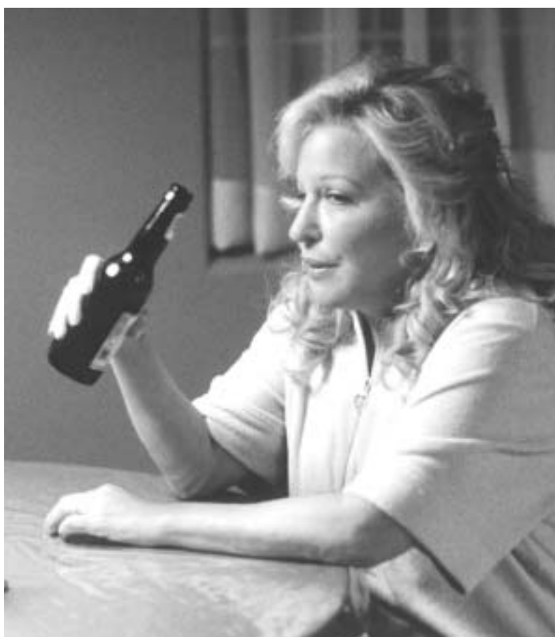
რობი ვილიამსი და ბედ მიდლერი "მზიური ველის" კლიენტები არიან

გამოთქმას "იერარქიული კიბე" ახლით - "იერარქიული ლიფტი". ისინი, ვისაც სურთ პირველები მოხვდნენ ამ ლიფტში, უზარალო მდიდრები ვერ იქნებიან, ისინი ზემდირდები უნდა იყვნენ. ისინი "ედელვაისის" ნომრებს საცხოვრებლად როდი ქირაობენ. იქ ამ ნომრებს "სათხილამურო გასახედლებს" ეძახიან. ამ ნომრებში ოლიგარქები და ვარსკვლავები ბოლდ მანუთინიდან დასაშვებად სათხილამურო კოსტიუმებს იცვამენ. მაგრამ ეს ჯერ კიდევ ყველაფერი არ არის. როგორც "ედელვაისში" მცხოვრებთ, მათ უფლება აქვთ თავიანთი მანქანები, ძირითადად "ჰამერები", ოტელის წინ გააჩერონ. ეს კი, როდესაც საქმე ლიფტთან მისწრებაზეა, ძალიან მნიშვნელოვანია. მათ ხომ ოტელის ის მაცხოვრებლები, რომლებიც მანქანებს მიწისქვეშა ფარეხში აჩერებენ, გამარჯვების ფორას აძლევენ.