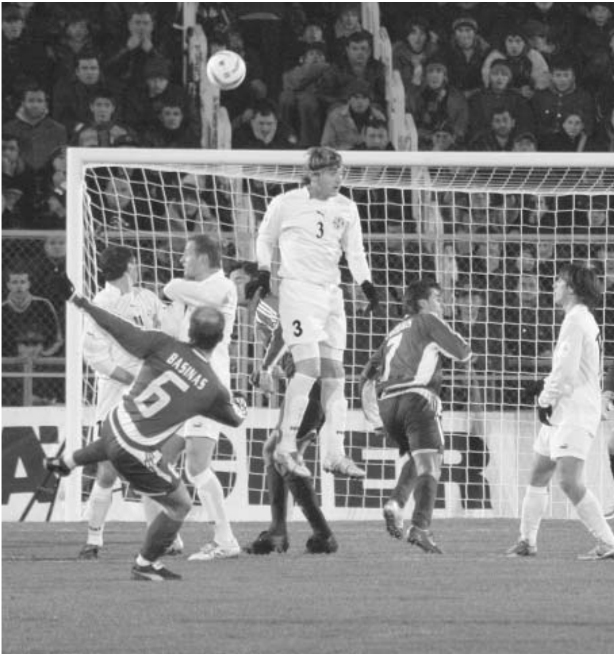
მონაპოვო ანაპასის ფეხბურთელები