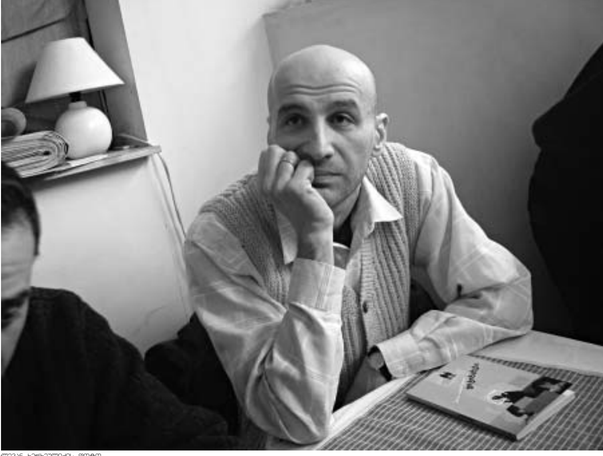
შოთა იათაშვილი ფოტო

"ფოტომამები" - პოეტ შოთა იათაშვილის კროზაული ფოტომიმობილა