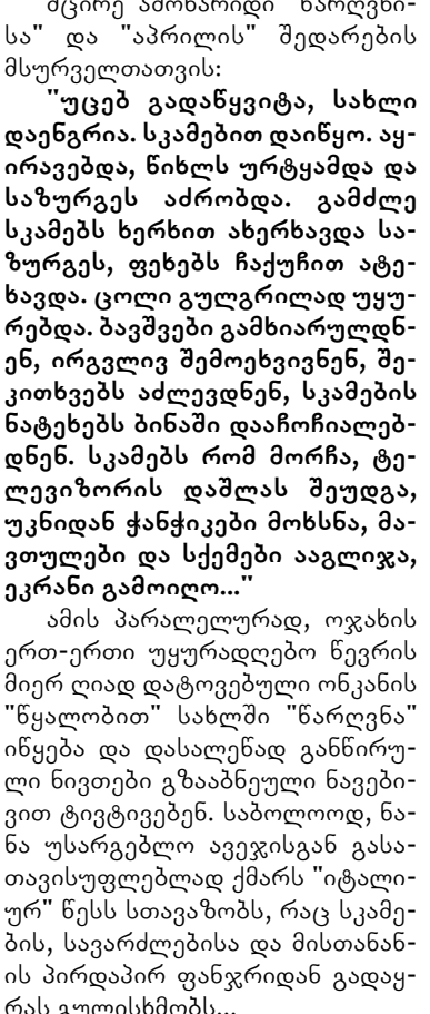
შოთა იათაშვილი ფოტო

"ფოტომამები" - პოეტ შოთა იათაშვილის კროზაული ფოტომიმობილა