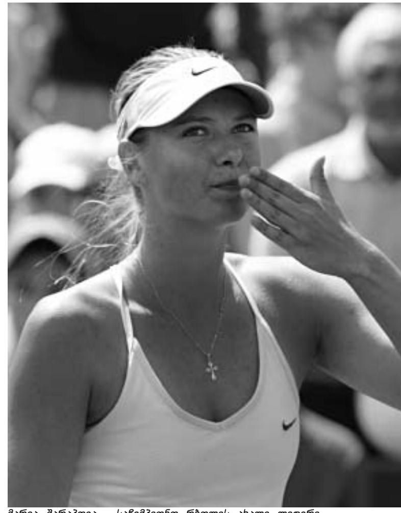
მარია შარაპოვა - საჩემპიონო რბოლის ახალი ლიდერი.

რაც შეეხება მაიაშის ტურნირის ფინალს ვაჟთა შორის, აქ მხოლოდ შარაპოვამ ჩიგანმა, შევიცარიელმა როჟე ფედერერმა გაიმარჯვა. ფინალში მან ესპანელი რაფაელ ნადალი დაამარცხა. მარია შარაპოვამ კი ფინალში დამარცხების შემდეგ განაცხადა: "რატომ უნდა, პირობები იდეალური-