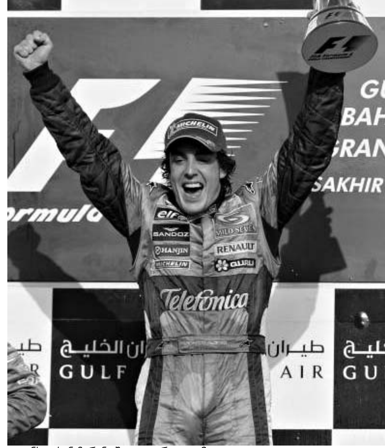
ალონსო სან-მარინოში ფავორიტად ჩავა.

საბლა იმაზე, თუ რა დემარტოა მისი მონაწილეობა. მანქანა კი ყველაფერზე ბრწყინვალედ რეაგირებდა. განსაკუთრებით პირველი პიტ-სტოპის შემდეგ, - რბო-