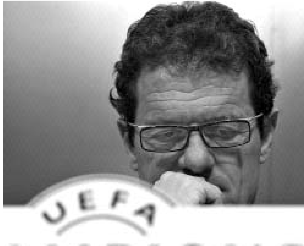
ვისი ტაქტიკა ვაამართლებს კაველოსი თუ ბენიეტისი?