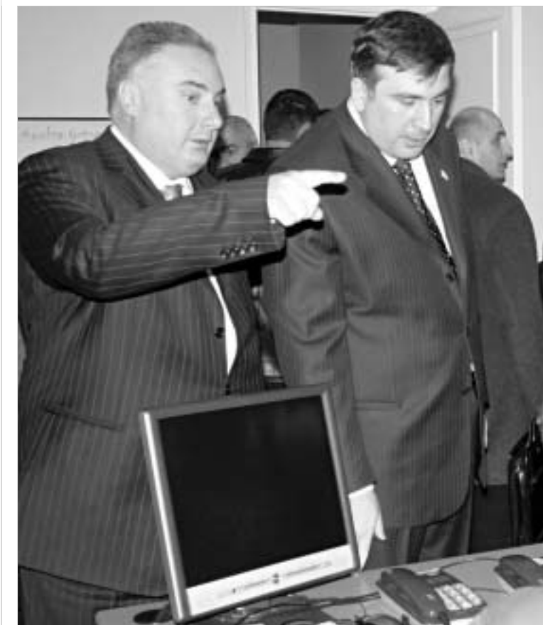
სასწრაფოს ერთ-ერთ ზარს პრეზიდენტმა უსაუბრა.

26 მაისისთვის სასწრაფო სამედიცინო მომსახურება მთელი საქართველოს მასშტაბით უფასო და სათანადოდ აღჭურვილი იქნება. სასწრაფო დახმარება "03"-ის სამსახურს, გუშინ პრეზიდენტის თანდასწრებით, "მერსედის" ფირმის 24 ახალი ავტომანქანა გადაეცა. როგორც მიხილთ სააკვილომა განაცხადა, თვის ბოლოსთვის "03"-