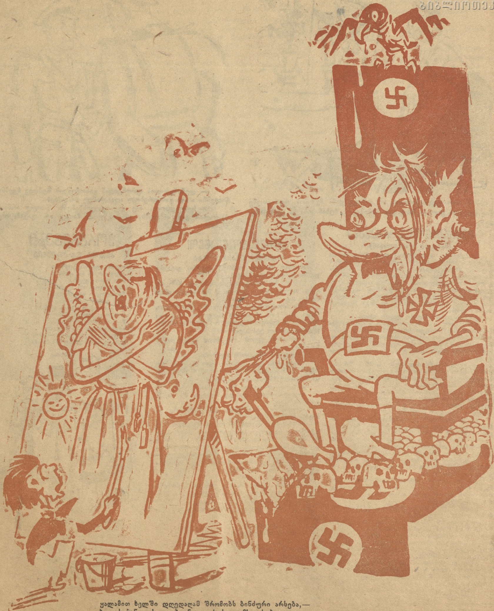
ყალბით ხელში დღეღალამ შრომობს ბინძური არსება,— ხატავს ბანდიტს და ჰგონია, იესოს დაემსგავსება.