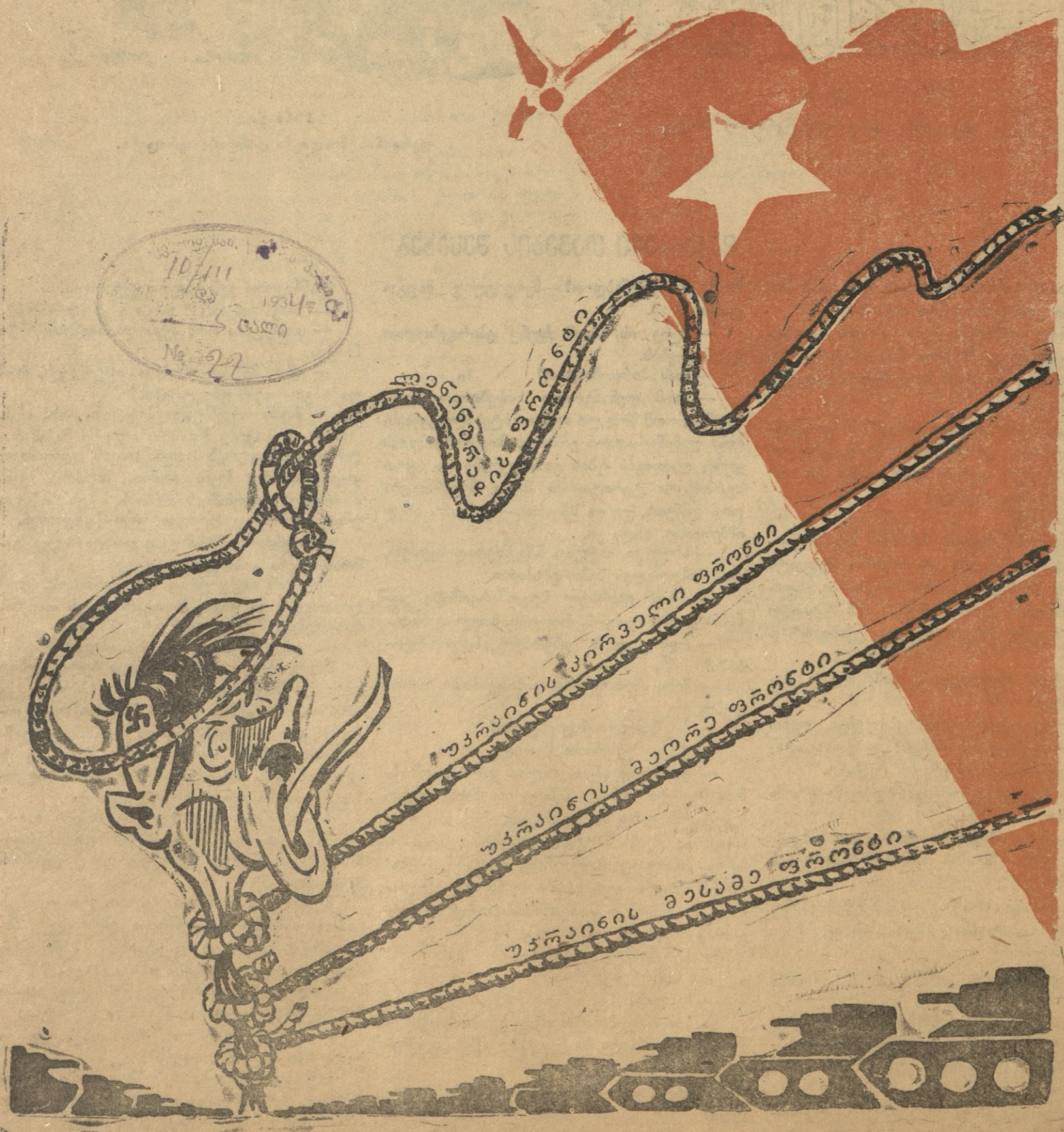
ნახ. ს. ნადარეიშვილისა