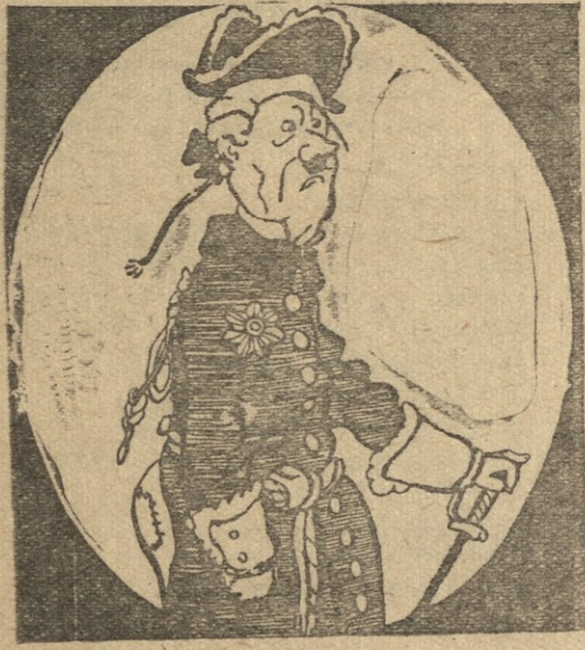
ნაზ. ო. განფისა

ჰიტლერი იზომებდა სხვადასხვა კოსტუმებს. პირველად მას მოეწონა ფრიდრიხ დიდის მუნდირი.