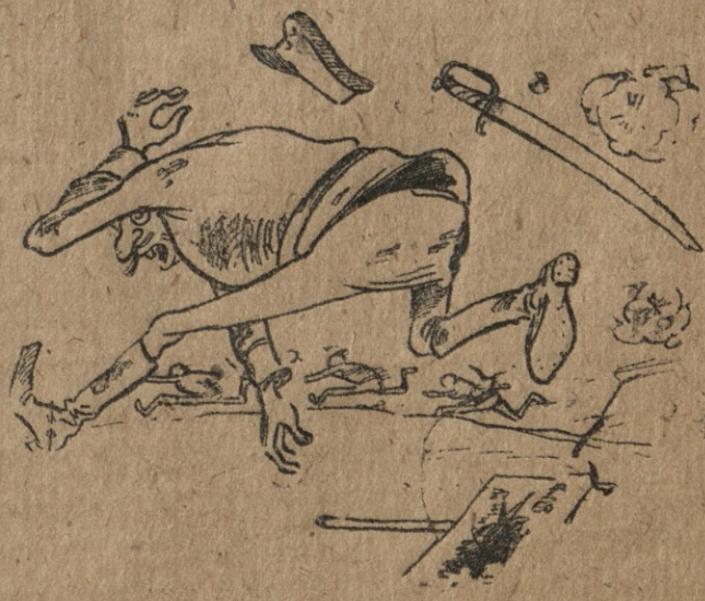
2. ახლაც ავადია. მისი ხენის სახელია „მანია პანიკოზა“.