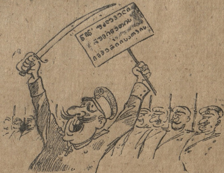
1. 1941 წელს ავად იყო. მისი ხენის სახელი იყო „განდიდების მანია“ ანუ „მანია გრანდიოზა“

წითელი არმიის წინსვლით შემინებული დნესტრის აქეთა მხარის რუმინელი გუბერნატორი ბუქარესტში გაიქცა. დარჩენილ რუმინელ მთხელეებშიც პანიკა სუფევს.