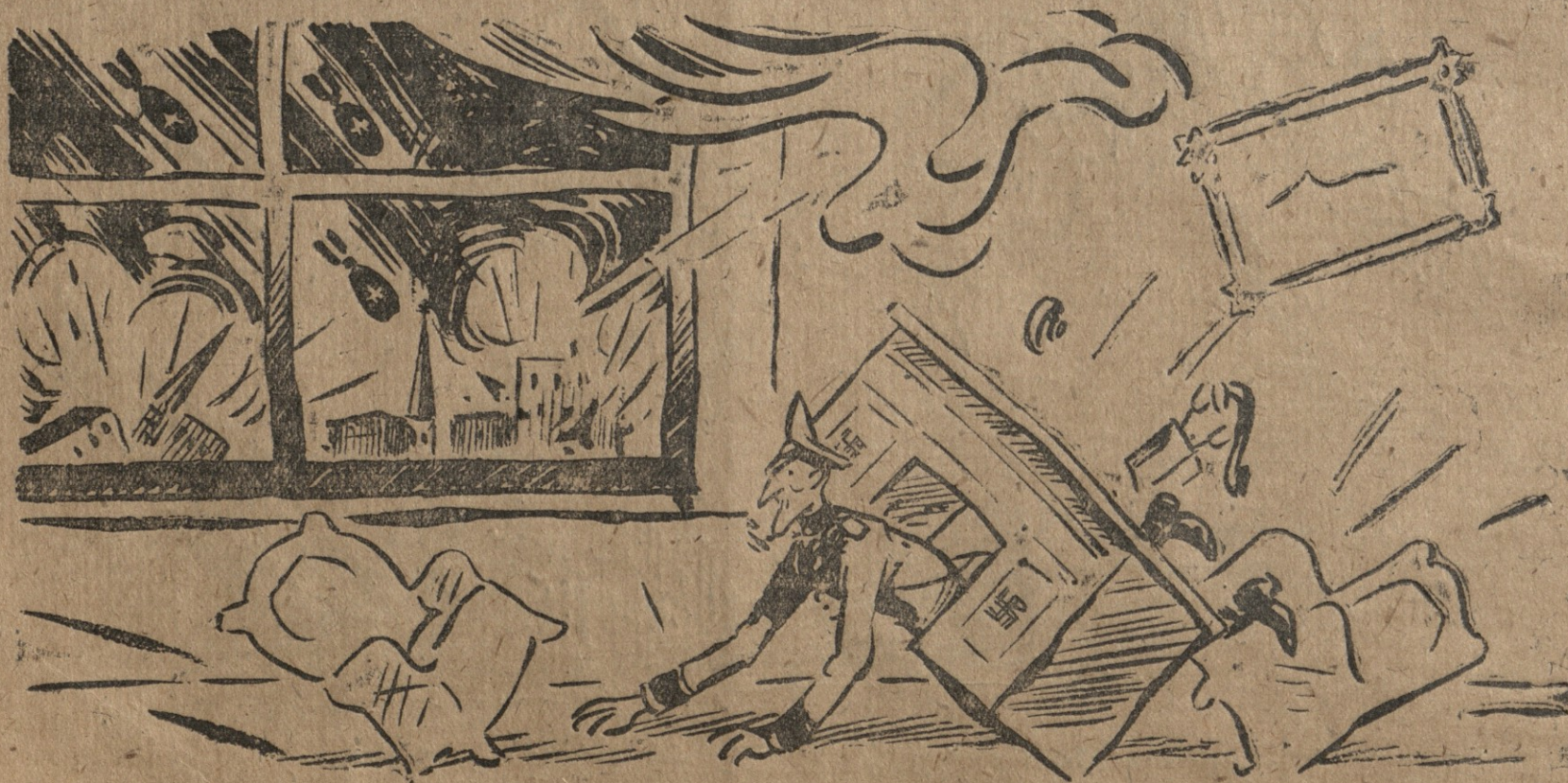
ფონ-შლეგე:—იძულებული ვარ ვთხოვო ფიურერს, დანიშნოს გუბერნატორად... მეორეზე: იქ მაინც გადავრჩები საბჭოთა ბომბებს.