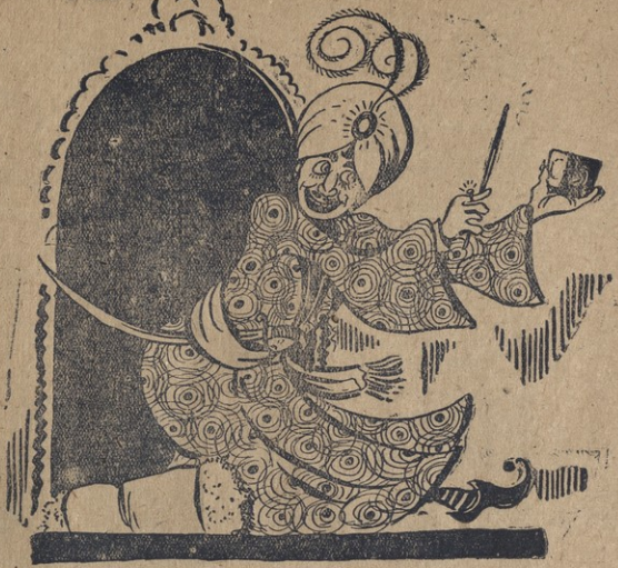
1. კარგი ხელფანია ფაშაზნა: აიღებს ბაზმის ნაჭერს და ხაზნად გალაქცევს...

კვარა არის. ამ კითხვამ სუნთქვა აღარ მაცალა: —სად გვექცე, შეთიბველი? მასწავლე, გენაცალე!