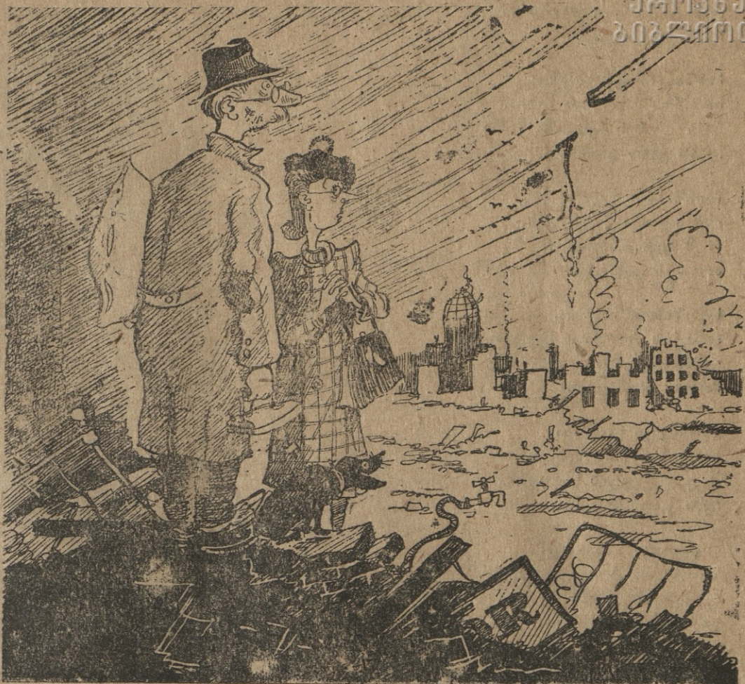
— როცა მყუდრო ბინებში ვიყავით, ფიურერი ხაახხებო სივრცეს გვპირდებოდა.