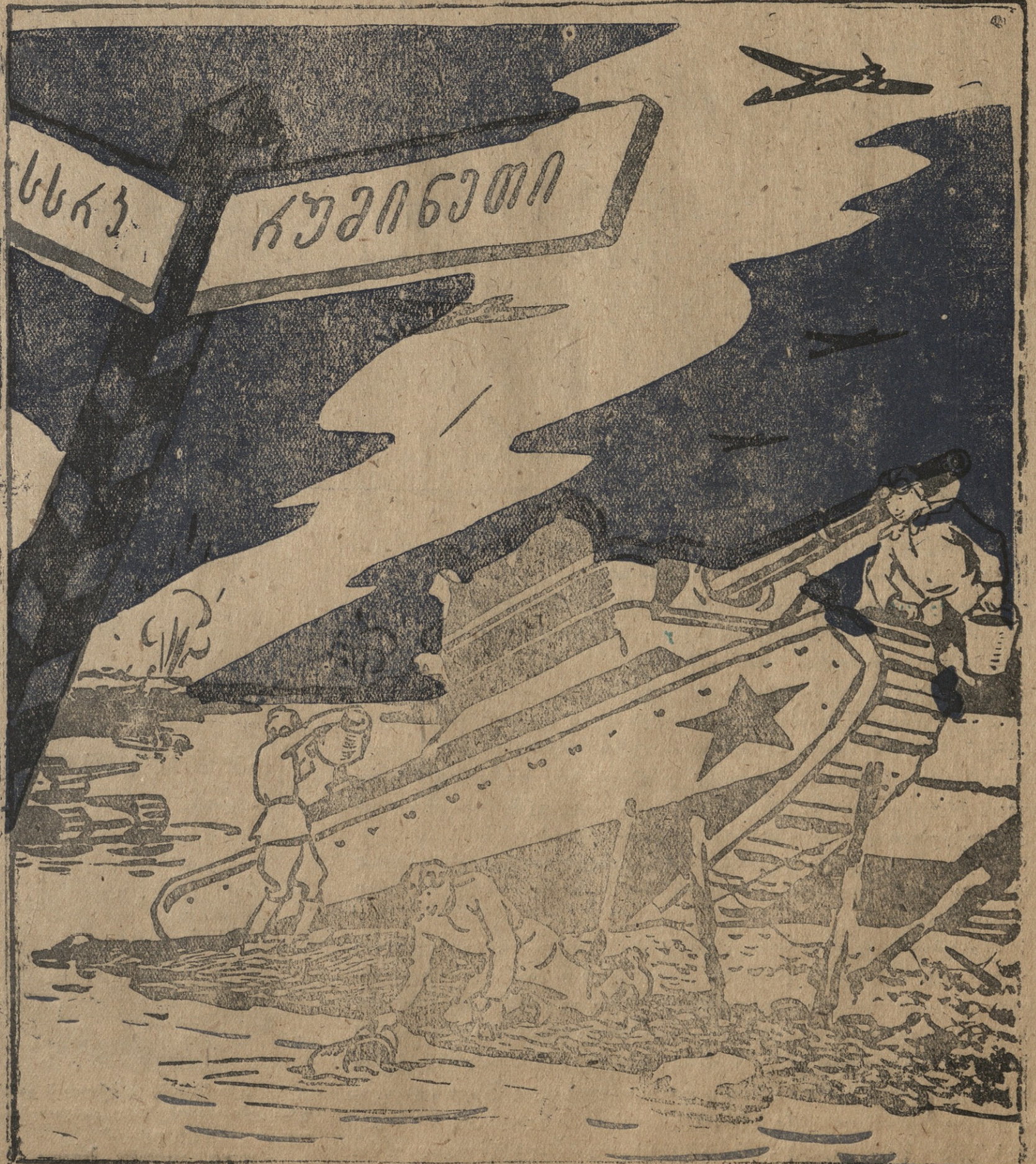
— ერთი-ორი ნახტომიც ჩემო ჭოგადის რაზმ დაწმინდარე დუნაის წყლის გემოსაც მალე გაჩვენებ.