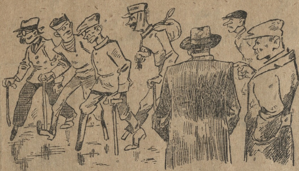
— ახლა კი უეჭველად გავიმარჯვებთ: ხომ ხედავ, ფრონტზე ორფეხიანების მაგიერ სამფეხიანებს ვავაზნით.