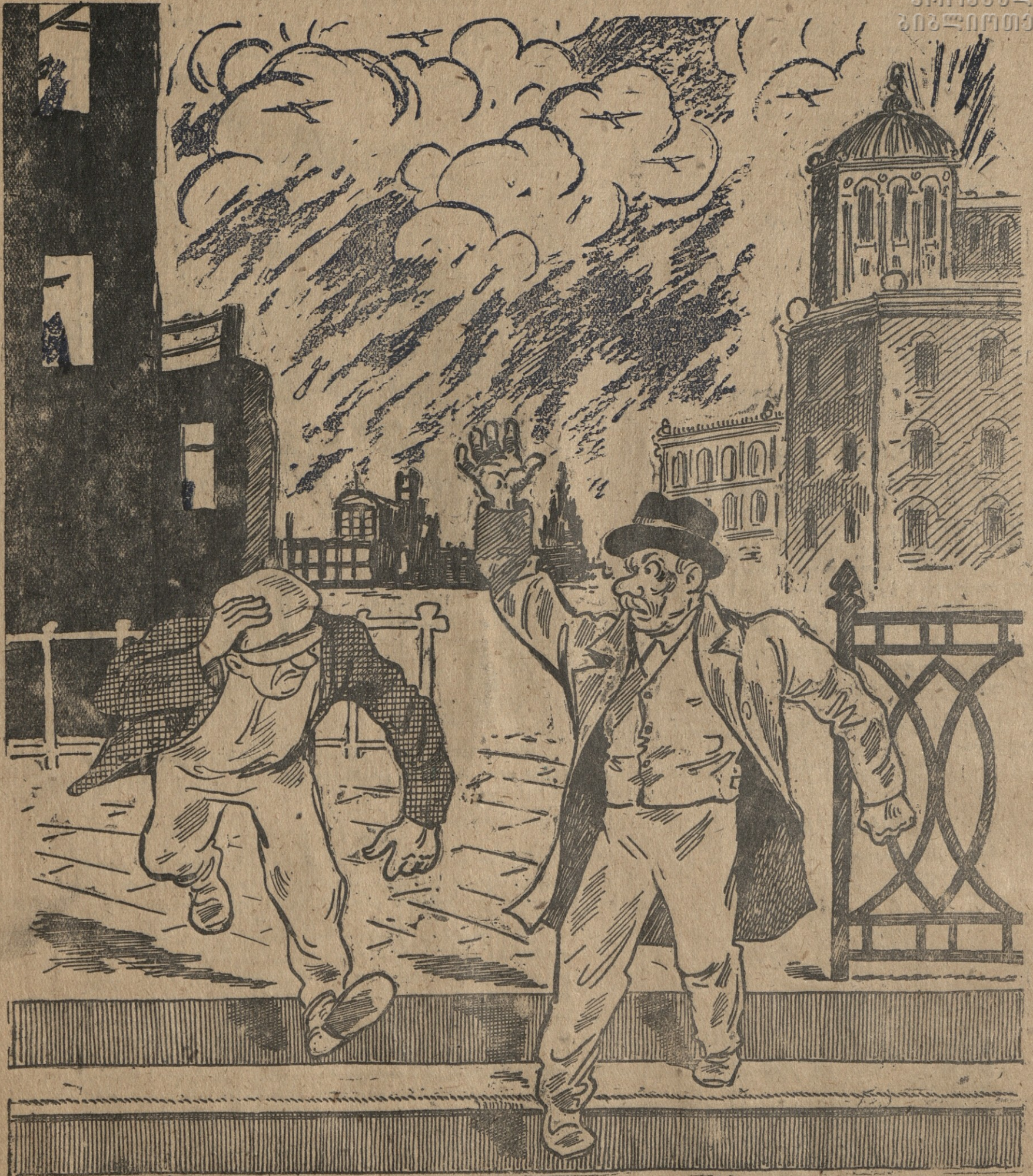
— ახირებულ საქმეს გვაშვრება ფიურერი: ლონდონს „წვავს“ და ცეცხლში კი ბერლინი გაბვეული.