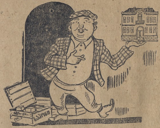
2. მაგრამ უკეთესი შედეგადანა ზოგიერთი დახურულ მაღაზიის გახვე: აიღებს ხაზნას ნაჭერს და ორსაბრძოლოდ სახლად გადააქცევს.

პიტლერმა სთქვა რომ ეს სტრას სამ ცვირაში იდგებო, ინგლისის ინგლისის სტრასზე მოვიყვებ და ბერლინში წავიდებო.