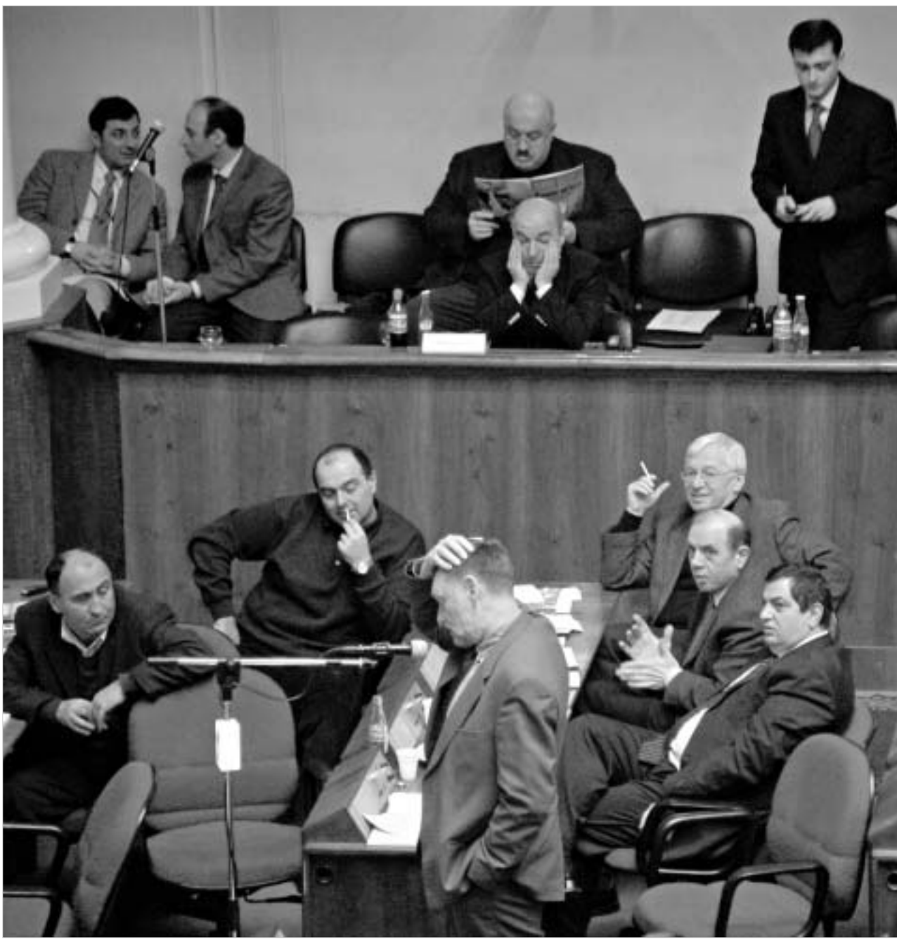
ფინანსთა მინისტრმა „რესპუბლიკელებისგან“ არაერთი მხარე სიტყვა მოისმინა.