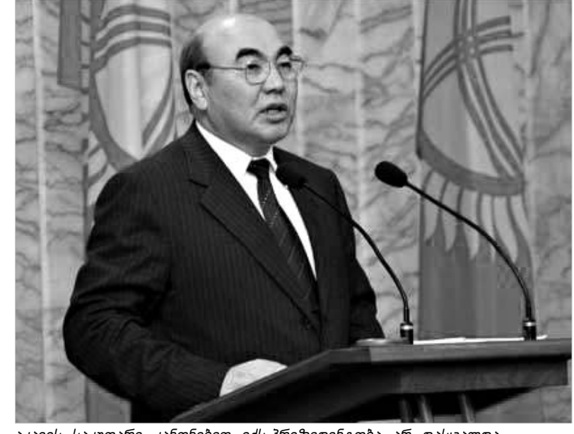
აკაევს საკუთარი კანონებით ექსპრეზიდენტობა არ დასცადა.

ყირგიზეთის დევნილი პრეზიდენტის ასკარ აკაევის მიერ გადადგომის შესახებ ჯერ კიდევ ორმაბათს დაწერილი განცხადება დღემდე არ არის დაკმაყოფილებული. თუმცა, როგორც გუშინ გაირკვა, ყირგიზეთის პარლამენტს ამ საკითხთან დაკავშირებით ბარიერები მოეხსნა და უახლოეს მომავალში მიიღებს ქვეყნის პრეზიდენტი აკაევის მიერ დაწერილი განცხადებით დაწერილი პრეზიდენტის "თხოვნას". საქმე ისაა, რომ თავად აკაევის მმართველობის პერიოდში მიღებული კანონმდებლობით, ქვეყნის პირველ პრეზიდენტს მთელი რიგი შეღავათებით სარგებლობის უფლება უნდა ჰქონოდა. სწორედ ეს იყო, აღბათ, ყველაზე დიდი დაბრკობა, რომელიც პრეზიდენტის უფლებამოსილების შეწყვეტას უშლიდა ხელს. მდგომარეობა იმდენად გართულდა, რომ ზოგიერთმა დეპუტატმა, ერთი შეხედვით, სრულიად უაზრო პროცედურის - იმპიჩმენტის დაწყების წინადადებაც კი წაიშაფენა. თუმცა, გამოსავალი უკვე ნაპოვნია - ყირგიზეთის პარლამენტმა გუშინ ცვლილებები შეიტანა კანონში, რომაც ასკარ აკაევს "პრეზიდენტი პრეზიდენტის" სტატუსი და კუთვნილი ყველა შეღავათი და პრივილეგია ჩამოართვა. დეპუტატებმა კანონში შესაბამისი ცვლილებები ხმების უმრავლესობით დაამტკიცეს; გაუქმებულია დეპუტატი პირველი პრეზიდენტის ოჯახის წევრთა ხელშეწყობის გარანტიების შე-