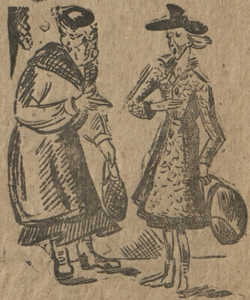
— დავილუბე ბებიკო, ჩემი ქმარი გენერალი ფონ-ნლუსტი ქარტო ხუთი დივიზიის ამარა გაუცხავნიათ მარშალ ტიტოს ერთი ასეულის წინააღმდეგ.