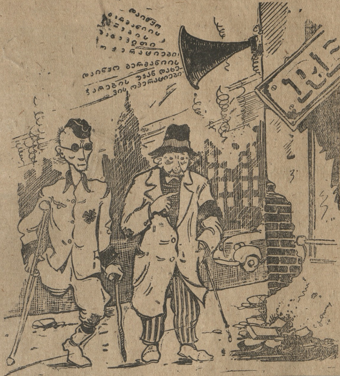
— გეხმის აღოლფ, რადიო გადმოსცემს გერმანიის ჯარების ოპერაციების დაწყების შესახებ. — ღიახ მესმის. ოპერაციები მართლა დაიწყეს... მხოლოდ უკანდახევისა.