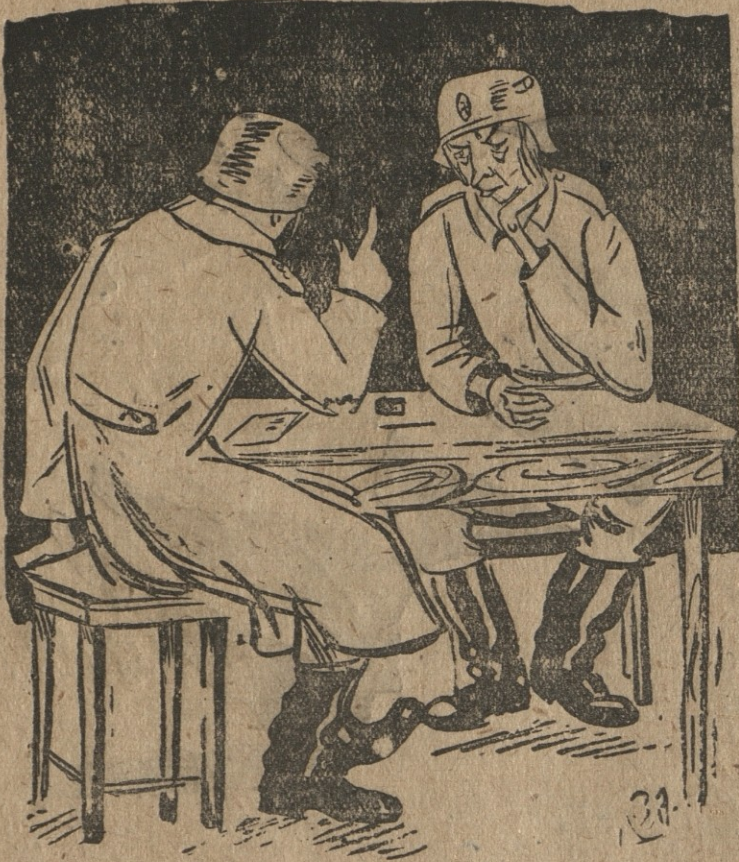
— გენერალი ბემე ავად ხომ არ იყო? — არ ვიცი, მაგრამ ყირიმში კი დარჩა „საავარაკოდ“.