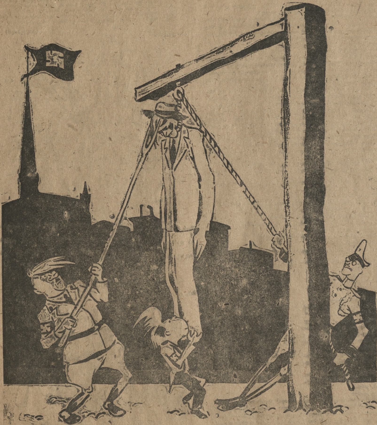
„ფიურერს“ ხურს არიელთა „აღდგენა და განახლება“ ახე ესმის ხულიერად დაცემულთა ამაღლება.