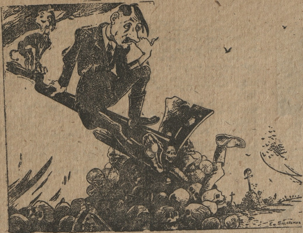
ჰიტლერი: ეშმაკმა იცის რა ხდება; მე ჩემს ჯარებს ვუბრძანე ქუსლით დატკეპნეთ რუსეთის ველები მეთქი, მათ კი—თავებით დატკეპნეს.

ჩვენი ტრესტის სამმართველოს მდივანს ტიტე ნესვერბეს, მომსვლელებთან კონფლიქტი აქვს, რადგან „საქმეს“ თავს ვერ არიდებს საათობით გაცდევინებს, რომ მიიღო მცირე ცნობა, საყვედურით ვერ მიმართავ და სხვა კი რა გაეწყობა. სიტყვა-პასუხს ნულაო ჰკითხავ, რას არ იტყვის მისი ენა საგონებელ სიტყვით გამკობს, შხამს ანთხევს და იცის კბენა, გაიგონებ მისგან: ნეტა მომსვლელები არა მყავდეს, და ტრესტშიაც სამსახური ერთ საათში განითავდეს. და ერთხელ მან ნახა ძილში, კაბინეტში იჯდა მარტო, ბასთან არვინ მოდიოდა, შემოვიდა მხოლოდ კატო, ვინც ალაგებს მის კაბინეტს, მოკრძალებით უთხრა ტიტეს: „მომილოცავს, მოესწარი რაც გინდოდა სწორედ იმ დღეს“. მაგრამ როცა გაეღვიდა და მივიდა სამსახურში, ტიტეს კატო შეეგება, საიდუმლოდ უთხრა ყურში: „—თქვენ მდივანი აღარა ხართ, თქვენა ჩაგვირად—ანალია, ითხოვს საქმის ჩაბარებას, გელოდებათ რა ხანია.