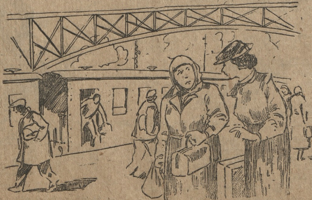
— თქვენ კრუნ-წიწილი და გოჭები შეიპვანეთ ვაგონში, კანონის დარღვევისათვის ზომ ხასტიკ პასუხს მოგთხოვენ! — არ მომთხოვენ: რევიზორი ჩემი მამიდაშვილის ბიძაა.