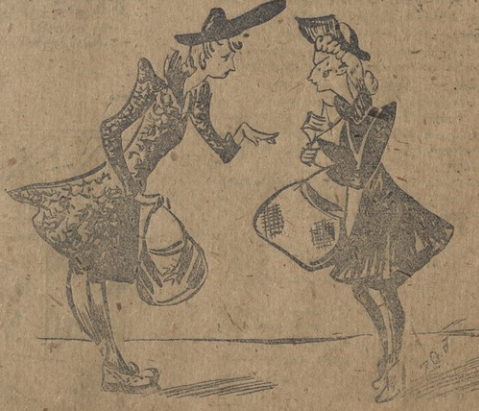
ნახ. 6. ეპაშვილისა

— ჩამომ დაიქტებს კარლ ვეცაპოლემანს? — ამაგამ, რომ ფურცლის ავადმუფობას დროს უღვიცხური განკურნება უსხურვა.