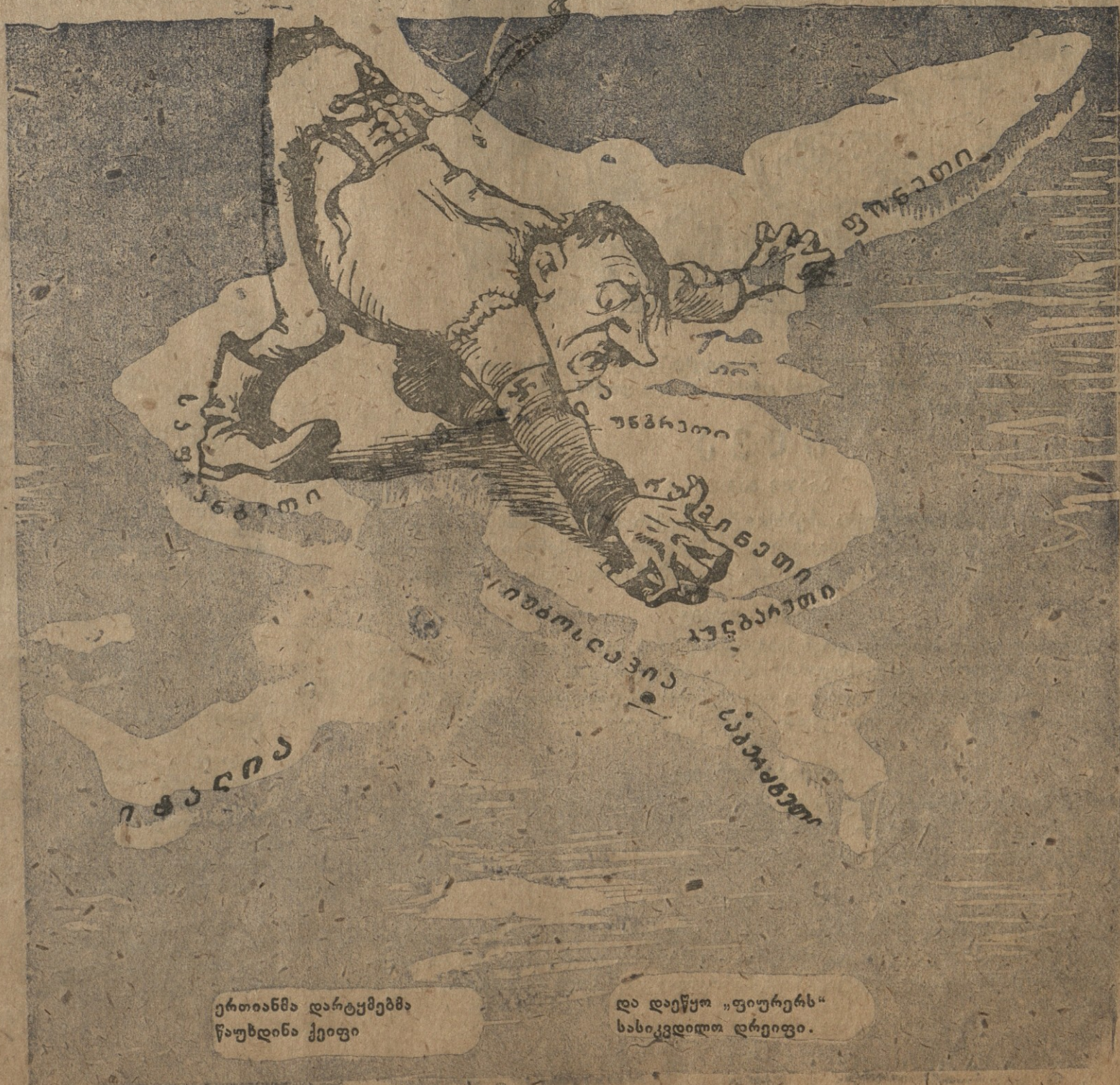
ერთიანმა დარტყმებმა წაუხდინა ქეიფი