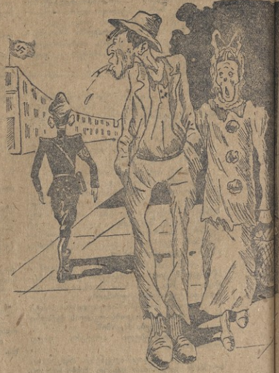
ნახ. 8. ვადალსკისა