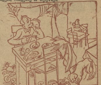
— ნეტა გიცოდე ნანავეში გიმყოფები, თუ სასაბუღალტრო დარბაზში?