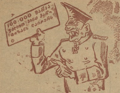
ფოტოლაგიაში გერმანელთა საოკუპაციო ჯარების სარდალმა დაიბრუნა პარტიზანების დასაქვრად.