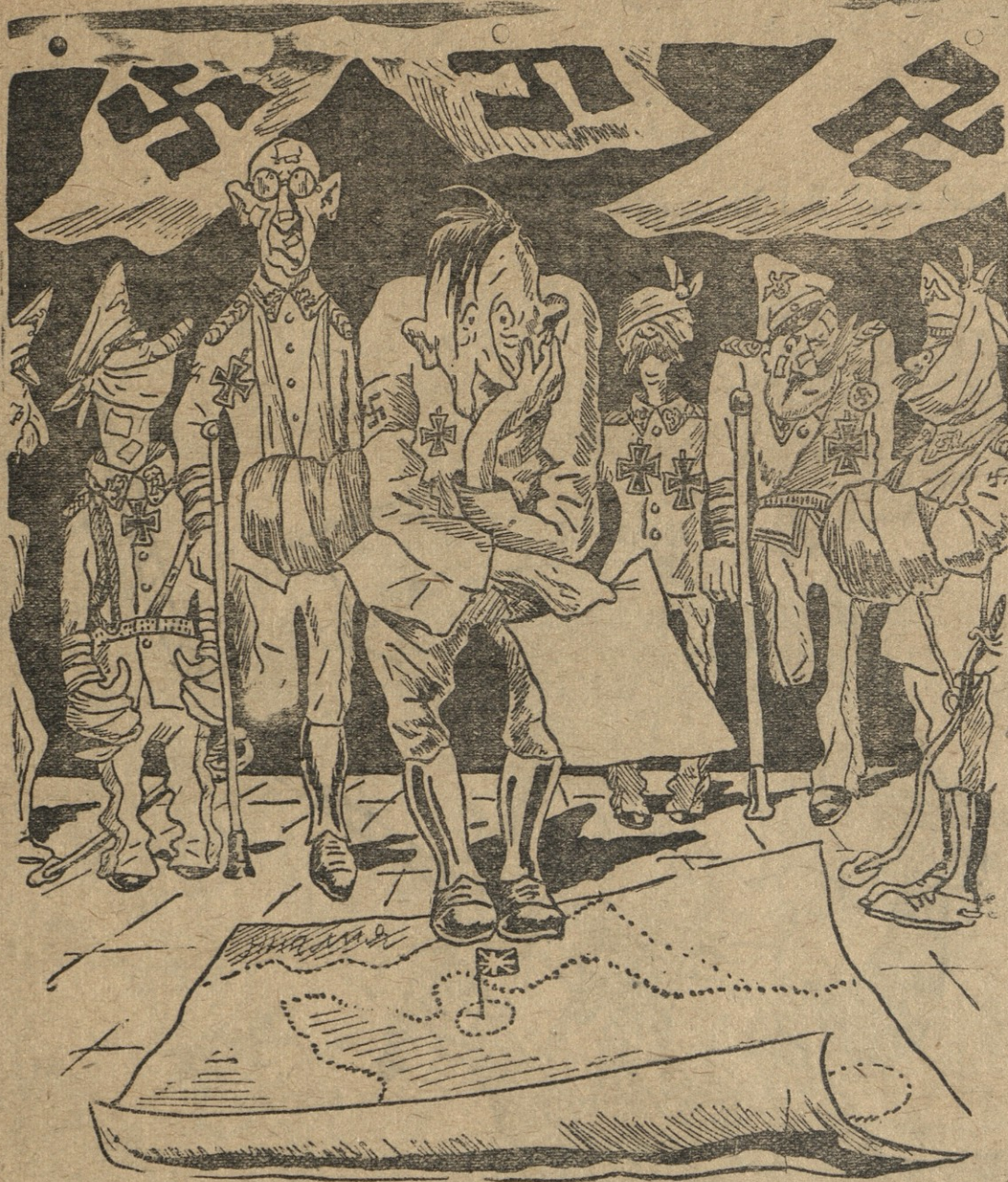
პიტლერი: დალაზროს ეშმაკმა, ერთი თავგაუთუნელი გენერალი აღარ დამჩნია, რომ ტყვედ წაყვანილების ნაცვლად—სარდლებად დავნიშნო.

სტამბოლი. ანკარიდან მიღებული ცნობებით თურქეთის გარეშე საქმეთა სამინისტროში გერმანიასთან „კავშირის გაწყვეტიდან“ ყოველდღე სრულდება ახალი თბილისი სათაურით: „ისევ შენ და ისევ შენ, გრეტ-ჩენ, ჩემო ლამაზო“.