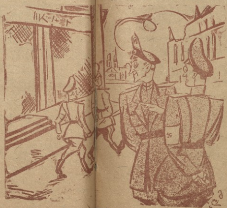
— მგონი ფედერალური მოდელი უკრი... — სწორედ იგია, რომელიც ფრონტის მხარეს საბჭოთა ტანების შემოტევის.

ნათლა გერმანელი ფედერალური მოდელი ხიბნება, რომელსაც იგი ჩინებებსა და გერმანულ ვის შიში არის ცნება სული დაიქვლობა და სამადლისა... (ნაიკორის)