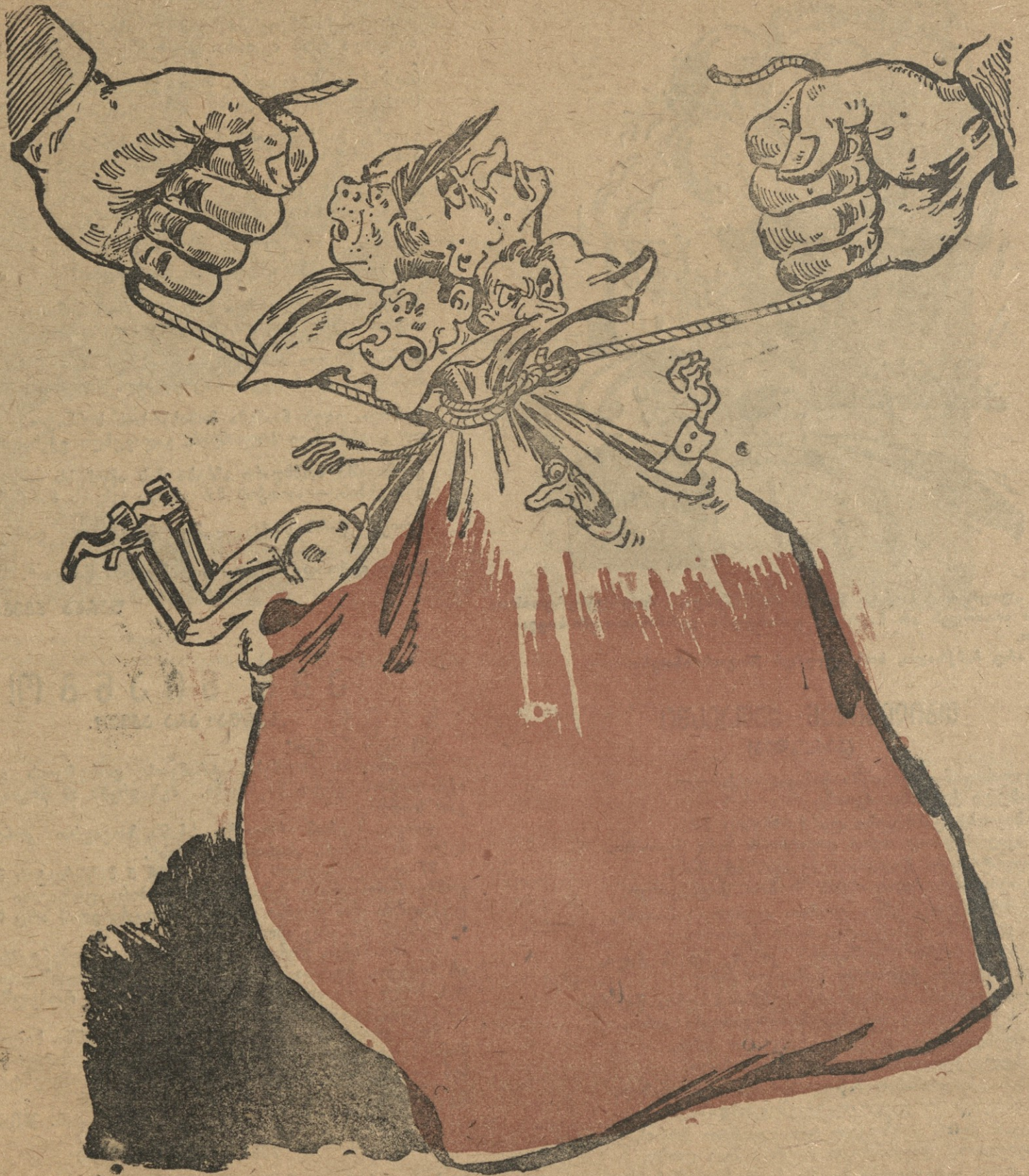
ფრიცთათვის გახშირდა ფრონტებზე ტომრებს, ტომრებში ცვივიან ფრიცი მეომრები. დასასრულს მიაღვა პიტლერის თარეში, არც იგი ღარჩება ტომრისა გარეში.

საბჭოთა კავშირის საგარეო ურთიერთობების მინისტროს საინფორმაციო განყოფილება