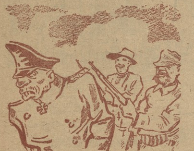
მაგრამ პარტიზანებმა—თით გენერალი დაიპირის.