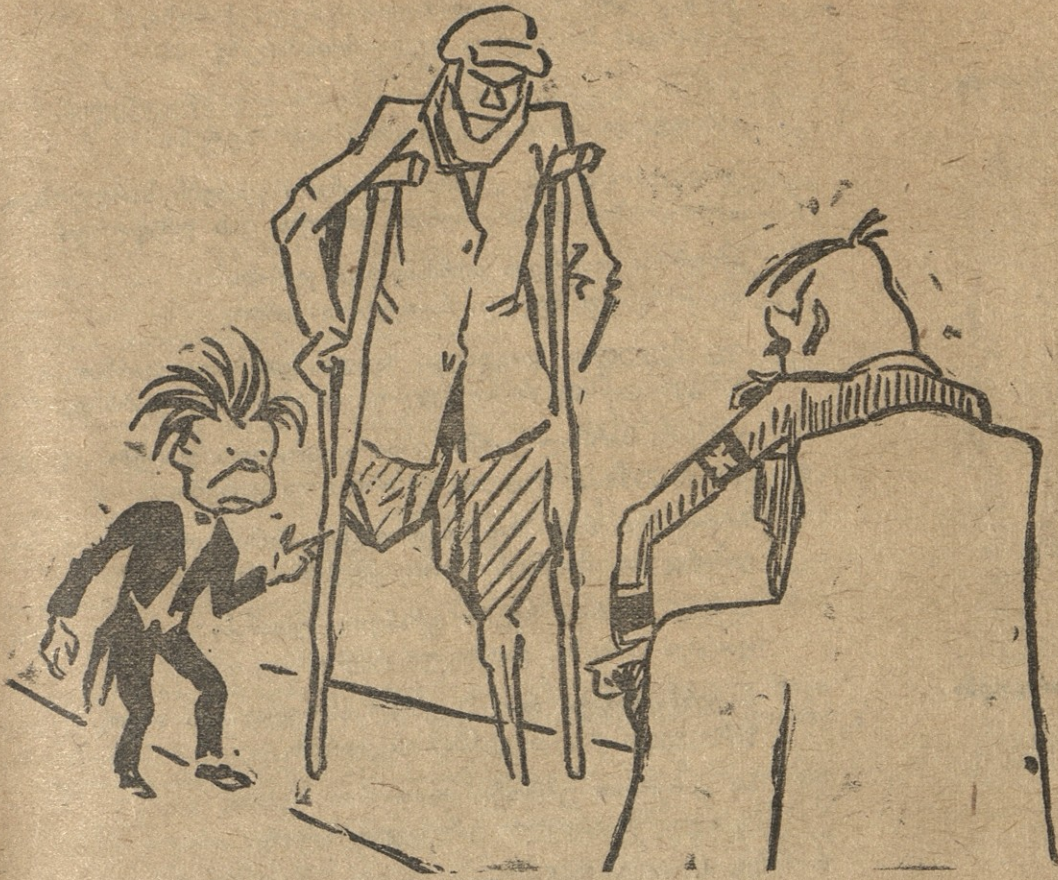
გებელსი: გეფიცებით, ფიურერ, ეს ნამდვილად გამოდგება— ფრონტიდან გამოქცევას ვერ მოახერხებს.