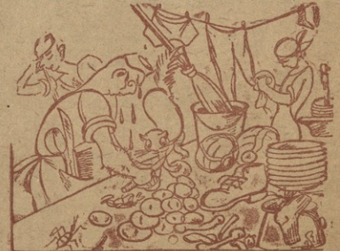
— ახირებული ხალხია ეს მომხმარებლები: სუფთა და გემრიელი კერძები მოვივსადელი, — გაიძაბან, ამაზე სუფთა და გემრიელი?