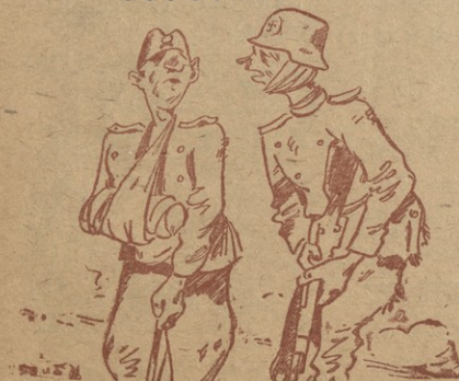
— აშკარად განვახორციელოთ ელვისებური ომი. — როგორ? — საბჭოთა ჯარების შემოტების შემდეგ, მართლაც ელვისებურად გამოვრბივართ.

გამარჯვების გერანგებით დაღაფუნლა პარიზი, შეუპოვარა ბრძოლათა ძეგლი მისასარებზე