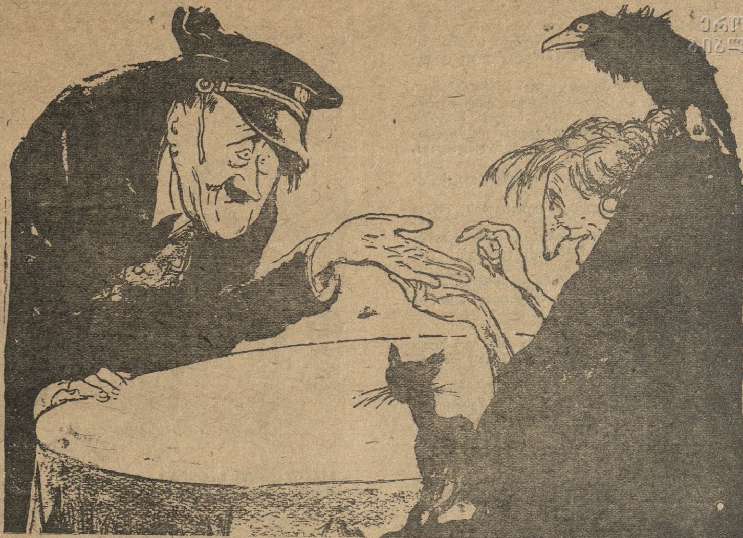
— როგორია ჩემი ბედი? — აშკარად სჩანს, როგორც ხელისგულზე: ყველა ხაზები გადაჭრილი გაქვს.