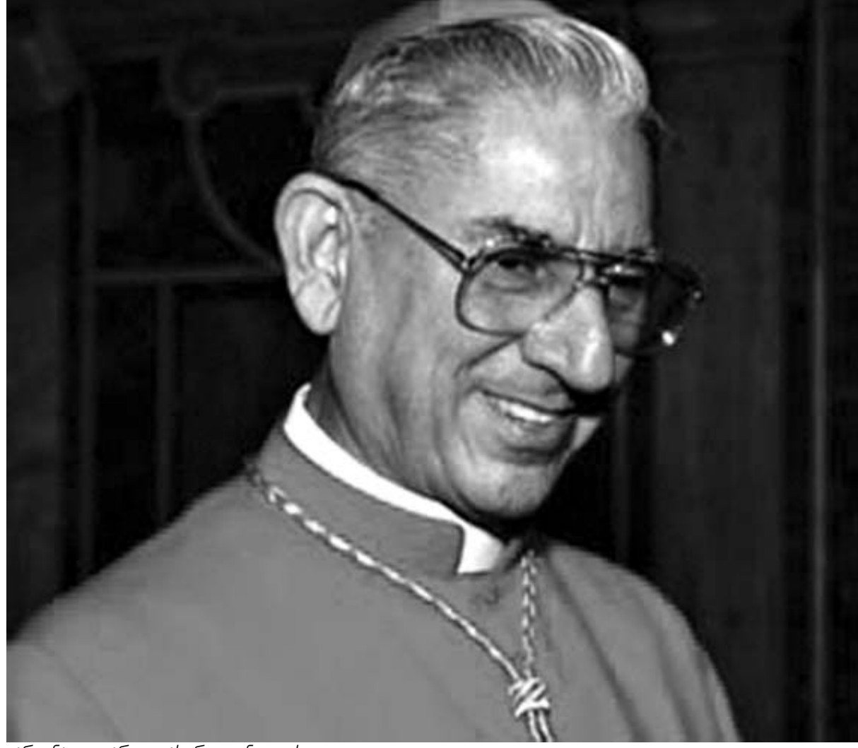
კარდინალი დარო კასტრილიონ იოსოს