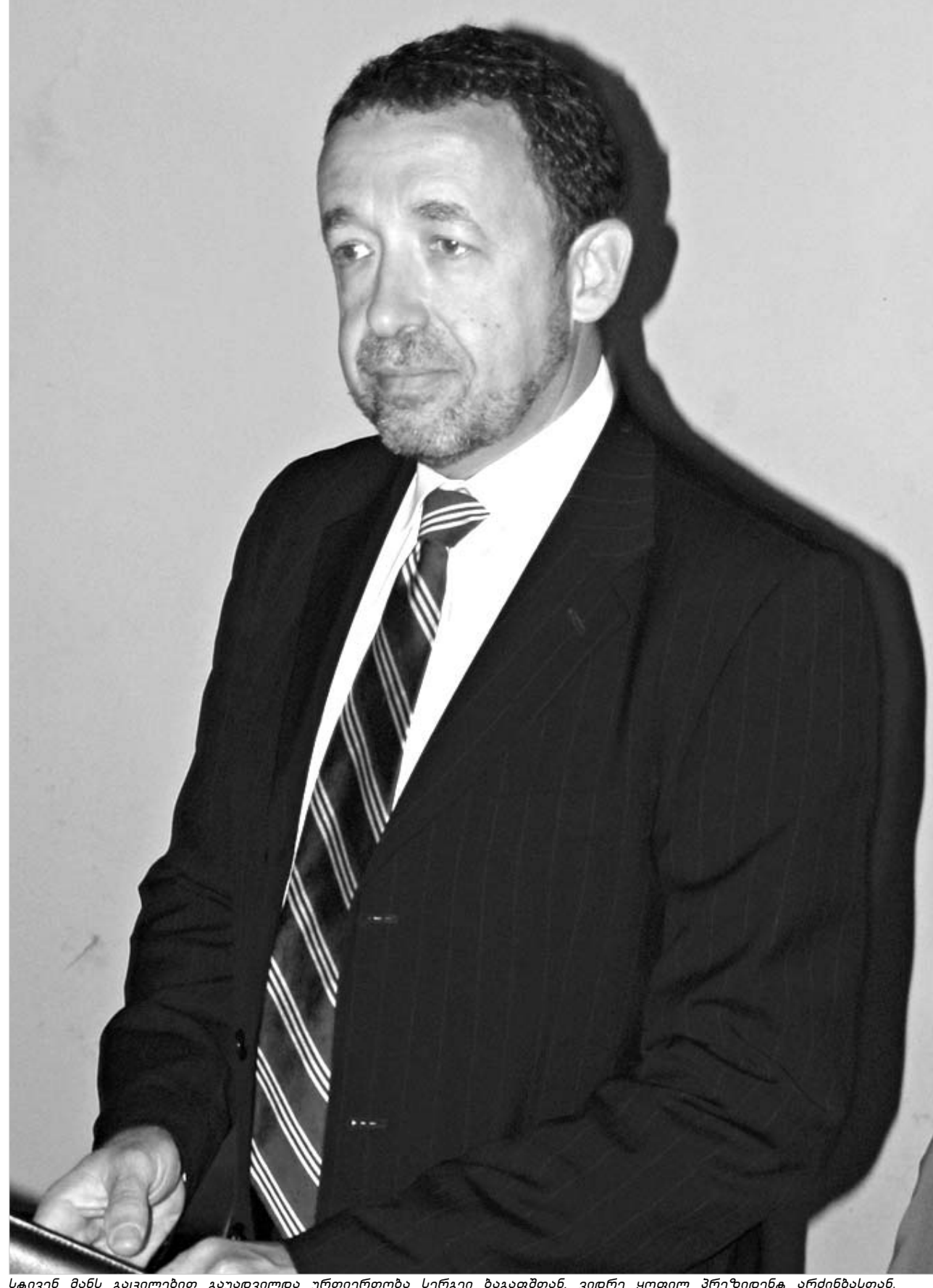
სტივენ მანს გაცილებით გაუადვილდა ურთიერთობა სერგეი ბაგაფთან, ვიდრე ყოფილ პრეზიდენტ არძინაზასთან.

საქართველოში აშშ-ს პრეზიდენტის ვიზიტის „მოსამზადებელი სამუშაოები“ აქტიურად მიმდინარეობს. როგორც ჩანს, ამ კონტექსტში მოიაზრება ევრაზიის საკითხებში ამერიკის შერეული შტატების სახელმწიფო დეპარტამენტის მრჩევლის, სტივენ მანისა და საქართველოში აშშ-ს ელჩის რიჩარდ მაისის სტუმრობა აფხაზეთში, სადაც ისინი თვითალიარებული რესპუბლიკის პრეზიდენტ სერგეი ბაგაფშა და პრემიერ-მინისტრ რაულ ხაჯიმბას შეხვდნენ. მასმედიის მიერ გავრცელებული ინფორმაციის თანახმად, სტივენ მანს სერგეი ბაგაფში საქართველოს დედაქალაქში მიიწვია ჯორჯ ბუშთან შეხვედრად. პარლამენტის თავდაცვისა და უშიშროების კომიტეტის თავმჯდომარის გივი თარგამაძის მტკიცებით, „სტივენ მანს გაცილებით გაუადვილდა ურთიერთობა სერგეი ბაგაფთან, ვიდრე ყოფილ პრეზიდენტ არძინაზასთან.“