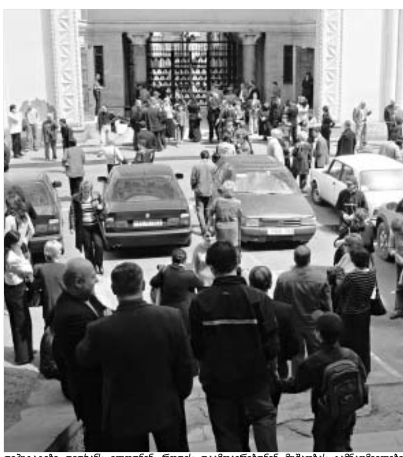
დეპუტატები დიდხანს ელოდნენ როდის დაამთავრებდნენ მუშაობას გამანადგურებელი...