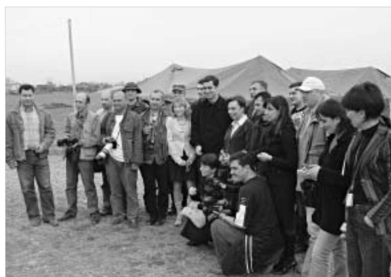
თავდაცვის მინისტრის სამხსოვრო ფოტო კონფერენციაზე

როგორც ოქრუაშვილის გუშინდელი საუბრიდან გაირკვა, საქართველოში ჯარს მხოლოდ აუიოტაჟის შემდეგ როდი ტოვებენ. ბოლო წლებმა აჩვენა, რომ მოსახლეობის გარკვეული ნაწილი ჯარში სოციალური პრობლემების გასაუმჯობესებლად მიდის და ხელის მოთხოვნის შემდეგ იქაურობას ტოვებს. ეს, ბუნებრივია, სახელმწიფოს სერიოზულ პრობლემებს უქმნის. "სახეების პატალიონი გაიწვრინა, მოიარა ყრავი, სიღანაც ჯარისკაცებმა ჩამოიტანეს დანაზოგა ექსპედიციის ათასი დოლა-