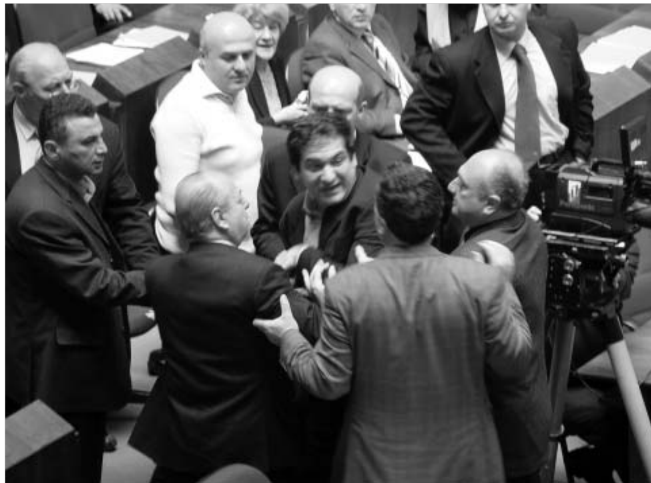
პარლამენტართა შეხლა-შემოხლამ სხდომის ნაყოფიერებაზე გავლენა ვერ იქონია.