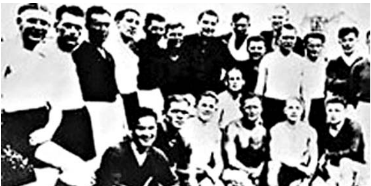
სიკვდილის მატჩის მოთამაშეები.

საგამომიხილველი კომისიის მიერ საპროლოდ დაიხურა საქმი "სიკვდილის მატჩად" შერაცხული საფეხბურთო შეხვედრის, რომელიც უკრაინულ ფეხბურთელებსა და ფრანსტურ გერმანიის შორის 1942 წლის ზაფხულში შედგა. საქმი ისაა, რომ ვაგანი უკრაინული ომის დროს უკრაინელებსა და გერმანელებს შორის ჩატარებულ საფეხბურთო მატჩთან დაკავშირებით ჰამბურგის პროკურატურამ 1974 წელს საქმი აღძრა.