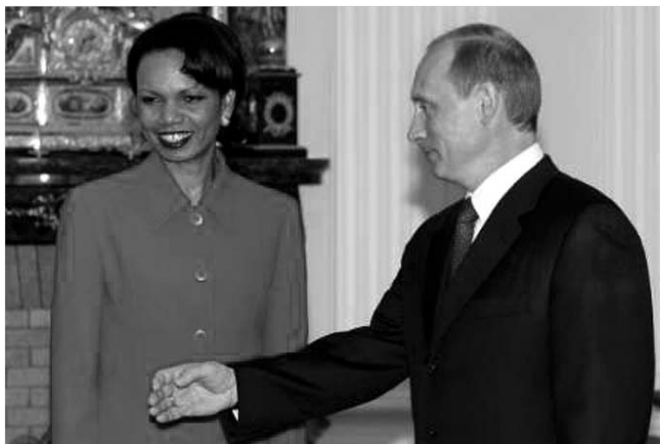
კონდოლიზა რაისის და ვლადიმერ პუტინის შეხვედრა ასე დაიწყო.