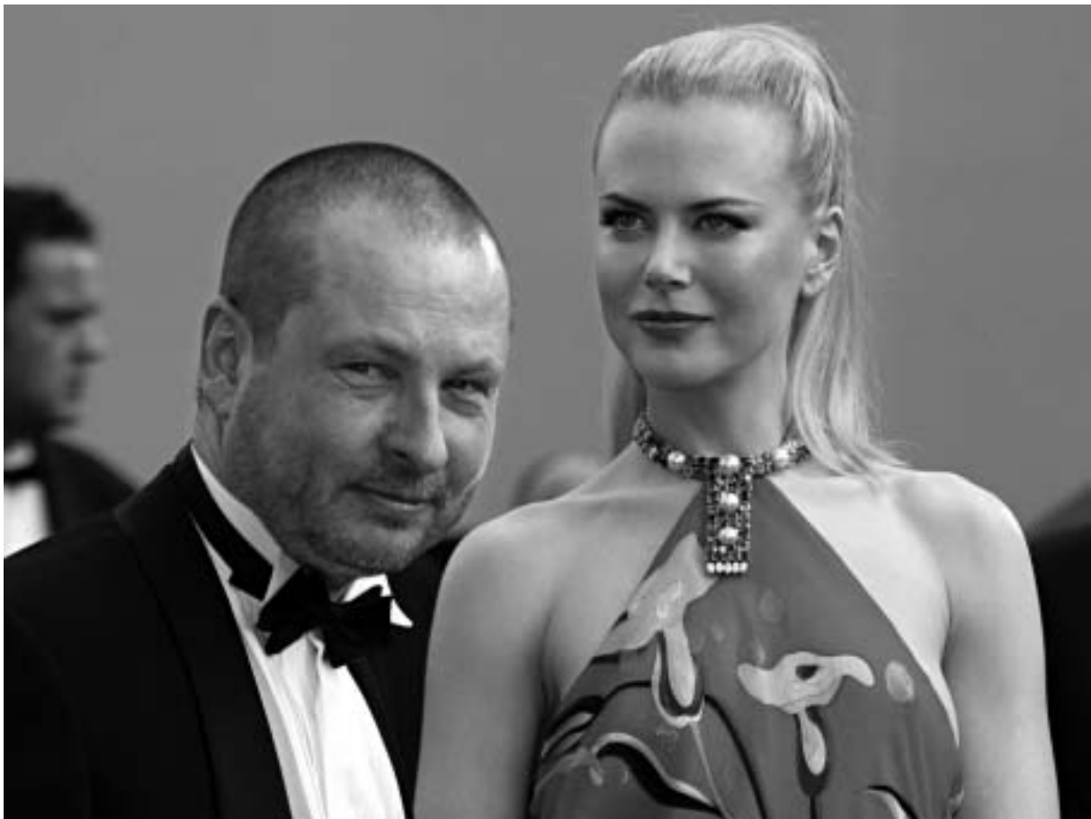
ლარს ფონ ტრიერი და ნიკოლ კიდმანი

დიდი სახელები თავიანთი წარმატებებით, რომელთა წარდგენასაც ავტო უკვე რამდენიმე