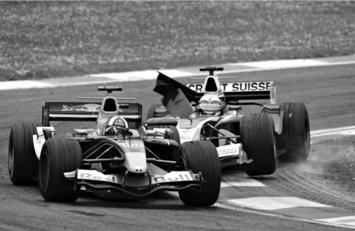
კულპარდის და მისის დეული ამ უკანასკნელის ბოლიდის დაზიანებით დასრულდა.

პიტსტიკობაზე პირველი ჰაიდფელდი გავიდა. მოტლანდიელს ფეხდაფეხ მიჰყვა გერმანელიც, მაგრამ მას შემდეგ, რაც ტიოტელებმა დროში აჯობეს "BMW-ულიამსს", შუმხაერმა გადაწყვიტა, ჰაიდფელდზე უპირატესობის მოპოვების შესაძლებლობა ხელიდან არ გაეშვა: განაგრძობდა, რომ ბოლო შანსი ჰქონდა, სანატრელ ქულას დაპატრონებოდა და მოტლანდიელის წინააღმდეგ საშობ მანერს მიმართა - გზა გადაულოცა. ცხადია, ეს არ გამოჰპარვიათ რბოლის ორგანიზატორებს და რალფი 25 ნამით დააჯარიმეს - გერმანელი მეტერმეტეცე საფეხურამდე ჩამოქეითდა. ასე რომ, გერმანელის ადგილი აქამდე მერმანელის ადგილი აქამდე მე-