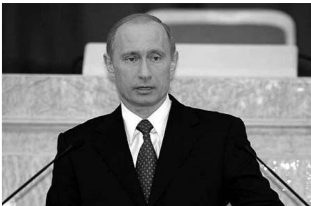
რუსეთის პრეზიდენტმა სოციალურ-ეკონომიკურ სფეროში პრიორიტეტებად დასახელა - საბიუჯეტო სექტორში ხელფასების ზრდა, ბიზნესის განვითარებისთვის გარემოპირობების გაუმჯობესება და სახელმწიფოს მიერ კონტროლირებადი ეკონომიკური სექტორების მკვეთრი განსახლება-გამოწვევა.

დაქარაღვ ფორმალური შეთანხმება," - აღნიშნა მან. გარდა ამისა, "რუსეთი დაინტერესებულია ეკონომიკაში კერძო ინვესტიციების მაქსიმალურად მიზიდვით. ეს ეხება უცხოურ ინვესტიციებსაც. ეს ჩვენი სტრატეგიული არჩევანი და მიდგომაა," - თქვა პუტინმა. ამასთანავე, აუცილებელია იმ კრიტერიუმთა სისტემის შემუშავება და კანონის ფარგლებში ფორმულირება, რომელიც ეკონომი-