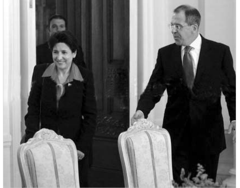
მინისტრები მსგავსებში ჩანდნენ.

რუსული ბაზების გაყვანის პირველ ეტაპზე საქართველოს მძიმე ტექნიკა დატოვებს, ამის პარალელურად კი, ანტიტერორისტული ცენტრის ჩამოყალიბება დაიწყება. ბაზების გარდა, საქართველოსა და რუსეთის საგარეო უწყებების ხელმძღვანელებს სხვა არაერთი სადგომი უნდა შეეძინოს განსახილველი და, მათივე თქმით, აქაც გარკვეულ პროგრესს მიაღწიებს. დამატებითი იმპულსი გაიწვია რუსეთ-საქართველოს სახელმწიფო საზღვრის დელიმიტაციის “საუკუნოვანი” პრობლემის გადაწყვეტაში და, ასევე - რუსეთ-საქართველოს შორის მოქმედი საერთო რეჟიმის საკითხშიც. თუმცა, კონკრეტულად რა ძვირდება და იმპულსებზე საუბარი, ჯერჯერობით, მხარეები არ ამბობენ. ორი ქვეყნის საგარეო უწყებებს