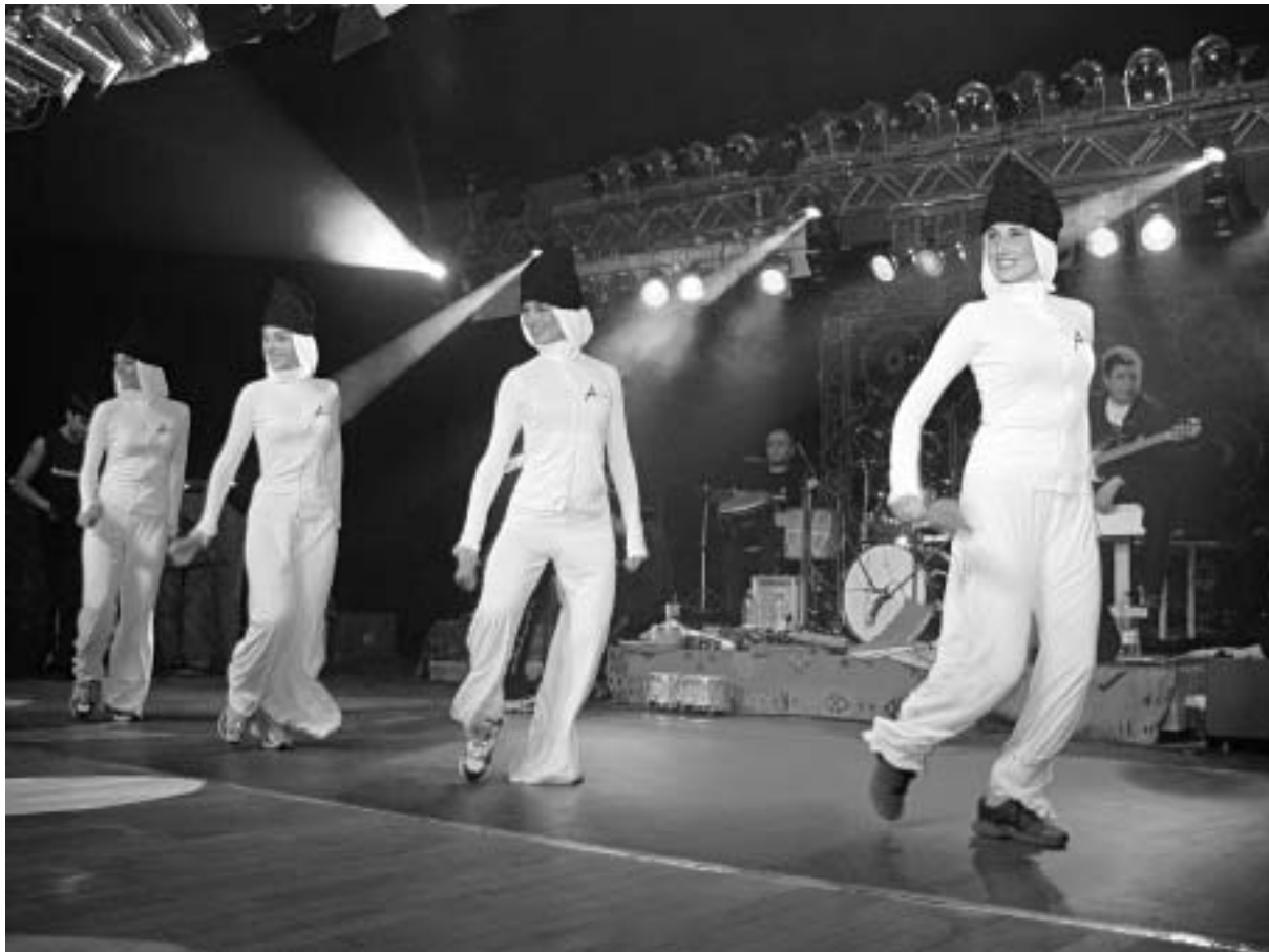
„სუხიშვილების“ საკლუბო პროექტი „ასა“.

ქართველი ქალის ორმაგი ბუნება არსად ისე ლამაზად არაა ნაჩვენები, როგორც ილიკო სუხიშ-