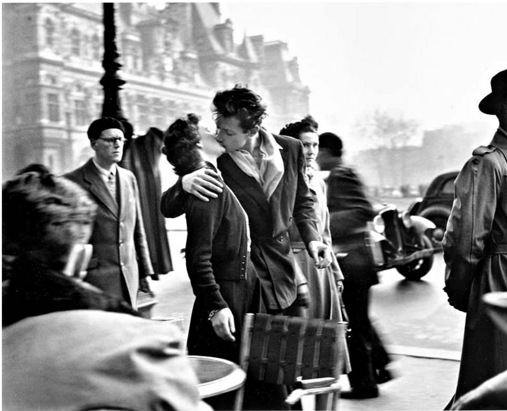
კოცნა მერიის წინ

რას ვიზამ ამ ფულით? ფოტოს გაყიდვა იმითმ გადაწყვეტიდა, რომ ჩემს მეუღლესთან ერთად კინოსტუდიის გაკეთებას ვაპირებ. ფული ამისთვის მჭირდება" - განაცხადა ფრანსუაზ ბორნემ. ოღონდ, რომანტიკოსებს კიდევ ერთხელ გაუცრუვდათ იმედები - ფოტოზე ალბეტილი ფაკი კორტო ფრანსუაზის მეუღლე არ გახდა. მათი რომანი დიდი ხანია დამთავრდა. კოცნა მარტოს და დედმა აღმოჩნდა. საყვარელი - სხვა რამე. ფოტოს