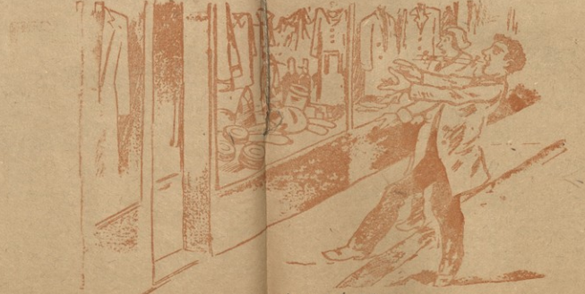
ნეტავი იფიქრობდეთ, ვაჩაო, დავტყვი შენი ვაჭარი.

ზოგიერი მადანიანი მომწოდებლისთვის განკუთვნილი საბიზნისი ნიშნები ფულს განახარავს და ტრინიში აწვივა, ხოლო ნიშნების ფულს განახარავს საწვინიდან მიზანშეწონილ მართლებას.