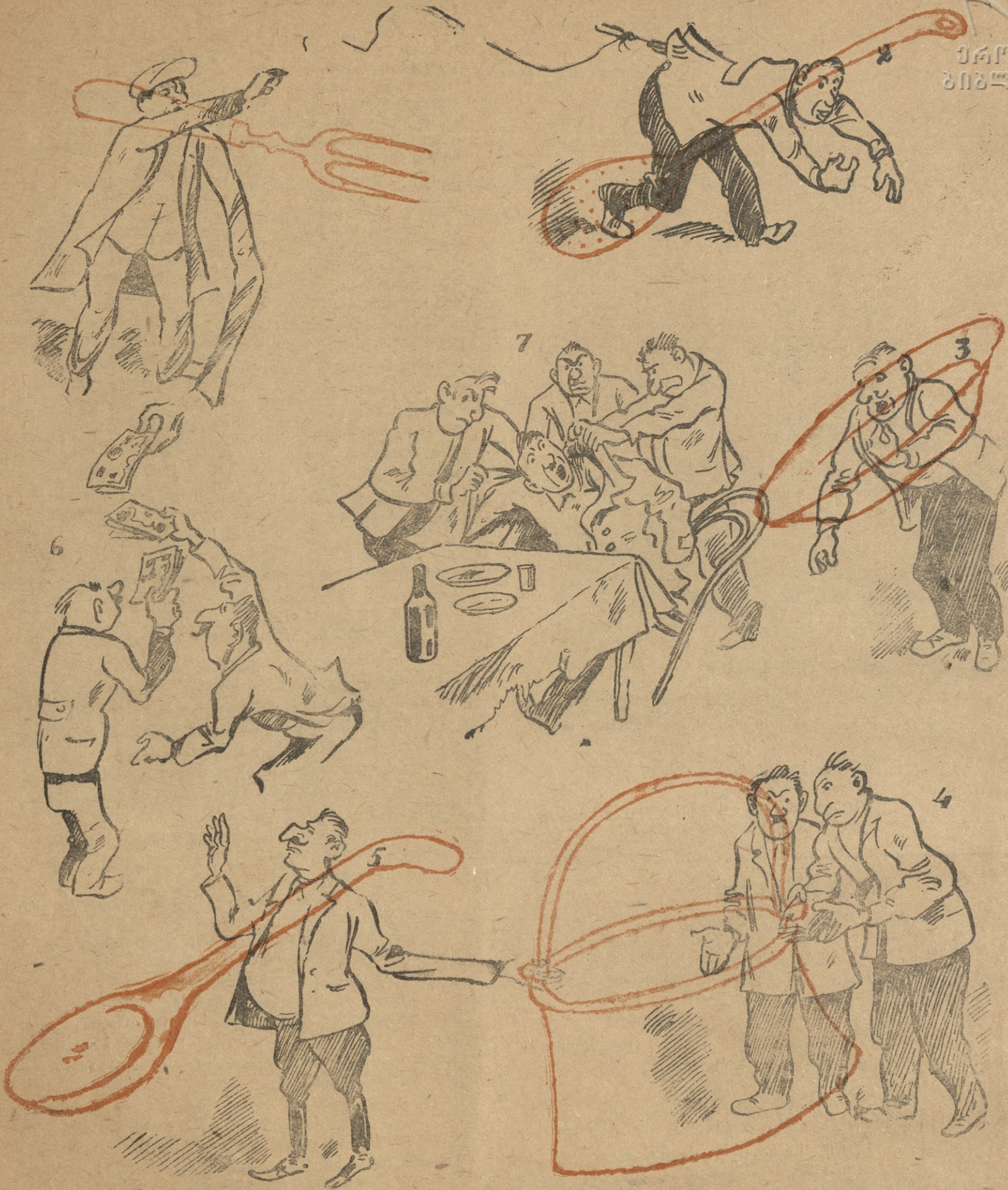
1. ინსპექტორმა ფასების დამახინჯება აღმოაჩინა და ჩანგალი მოსდო ოფიციალს ქაფქირიძეს. 2. ქაფქირიძემ დახმარებისათვის მიმართა ოფიციალს თეფშიშვილს და კოვზირიძეს. 3. საერთო ქვაბში სამიათსამა მანეთმა მოიყარა თავი. 4. ინსპექტორთან პირდაპირ მოლაპარაკება ვერ გაბედეს და შუამავლობა გამგეს დააკისრეს. „მე თქვენი ციცხვი ვარ, — უთხრა გამგემ, — განა არ ვიცი, რომ თითოეული თქვენთაგანი დღეში ათას მანეთს აკეთებს? თუ საქმის მოკვარასკინება გინდათ, ჩამოდით ექვსიათას მანეთს.“ 5. დაზარალებულებმა ფულს ფული მიამატეს და გული მოუღებეს განრისხებულ შუამავალსა და ინსპექტორს. 6. „მაგრამ რა შუაშია მომხმარებელი, შუაში რომ დავინახათო?“ — იკითხავს მკითხველი. შუაში სწორედ მომხმარებელია, რადგან „დაზარალებულ“ ოფიციალტებს რომ ფული არ შემოაკლდეთ, ერთიორად ახდევინებენ საჭმელ-სახმელის ღირებულებას.

საკრედიტო კოლეგია: ი. გრიშაშვილი, კ. კალაძე, უჩა ჯაფარიძე, ს. ფაშალიშვილი, ვ. აბაშიძე (პ/მგ. რედაქტორი).