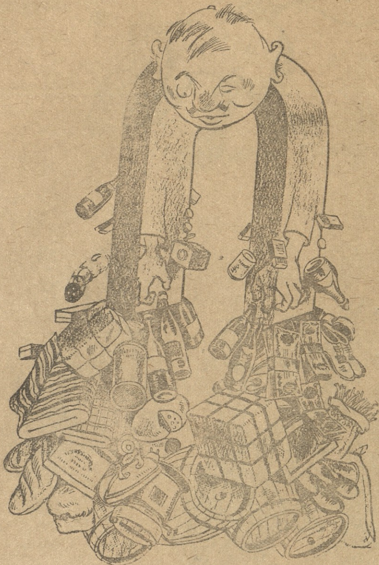
მალაზა აქვს, მარიფათიც, ჭამით ღიბი ეცვიტება, რაც კი მოსწონს — მაგნიტივით სულ თავისკენ ეზიდება.

ქალაქ ზუგდიდის ბევრი აქვს მოსწონი, საქები, წელს თეატრი გვექნება სულ ქვეთვითი ნაგები, წინ მოედანს მოვაწყობთ ისე კობტად, ლამაზად, მოემატოს მშვენივლა ქალაქს ერთი-ათასად. ამ ფიქრებით გართულმა შევიარე ბულვარში, ალბათ, ჩავიცივებდი, რომ მქონდა ულვაში. მთელი უბნის ღორები ღრუტუნით და ზმორებით ისვენებდნენ ხეებქვეშ, საშიშარი რა ჰქონდათ, ზოგი დაწოლილიყო, ზოგიც მერე გაგორდა! იქ რა გამაჩერებდა, ეშვებს დამაძგერებდა რომელიმე მაგანი. ამივარდა კანკალი,— მოვიმარჯვე ჩანგალი, ამ დროს ერთმა მანქანამ გვერდით ჩამოშიარა, იგი ხალტურტრანსია, „კოლბრანსი“ კი არა! გული მქონდა მაგარი,