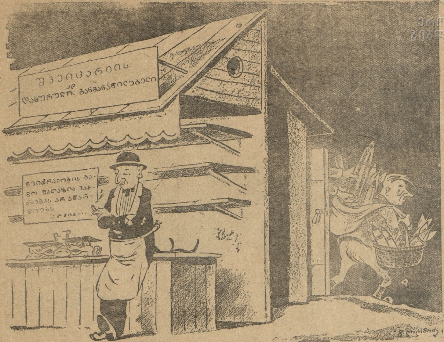
ანუ თარული აღებ-მიცემობა საერთაშორისო მორალით.