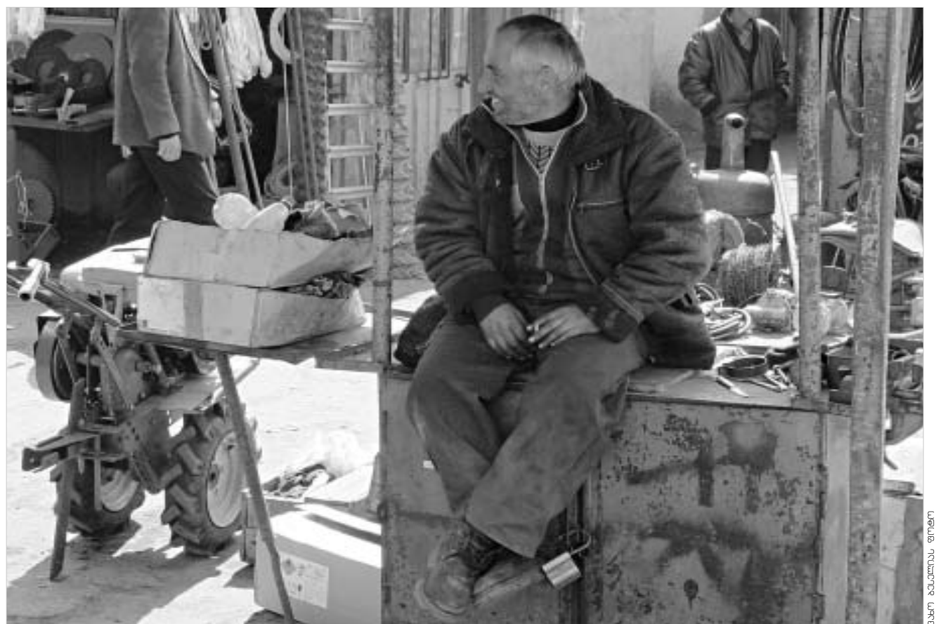
ბაზრძალა AB ბაზრძალა