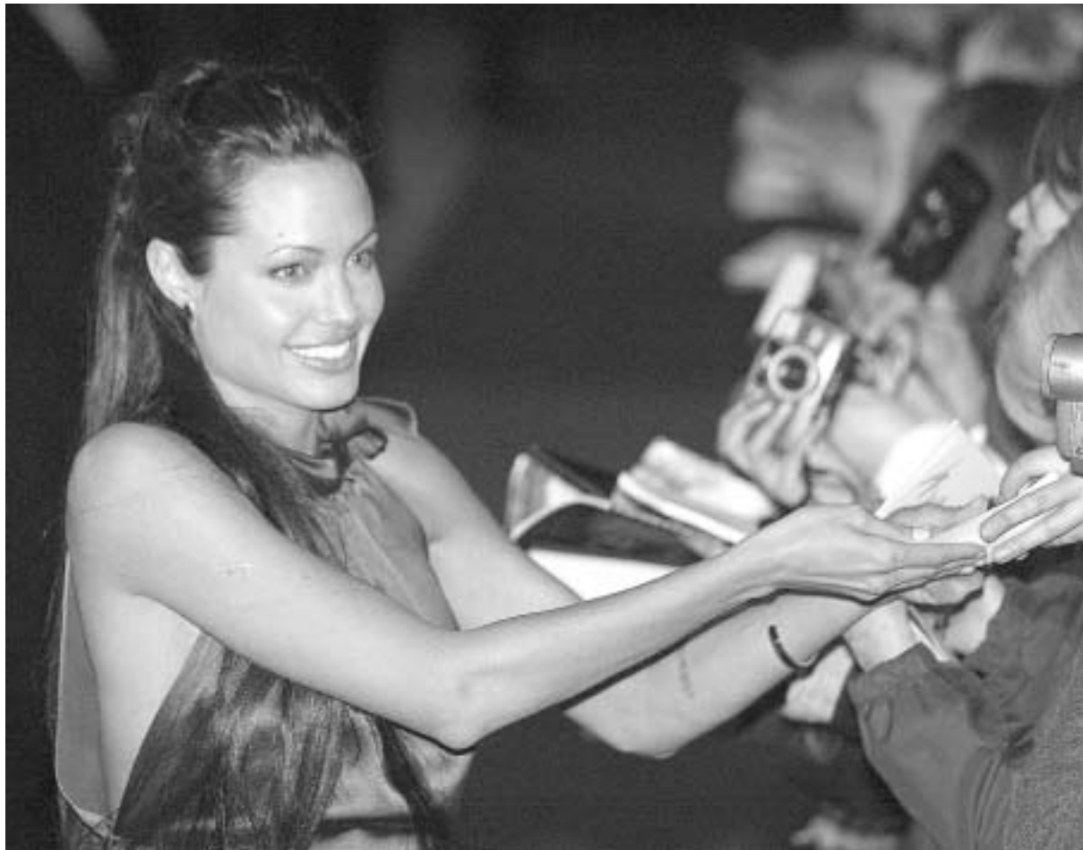
ამი, ისინი არიან: "ოსკაროსანი" ჯეიმსი ფოქსი (ფილმი "რეი"), ასევე "ოსკარი" დაჯილდოებული ჰილარი სუენკი ("მილიონ