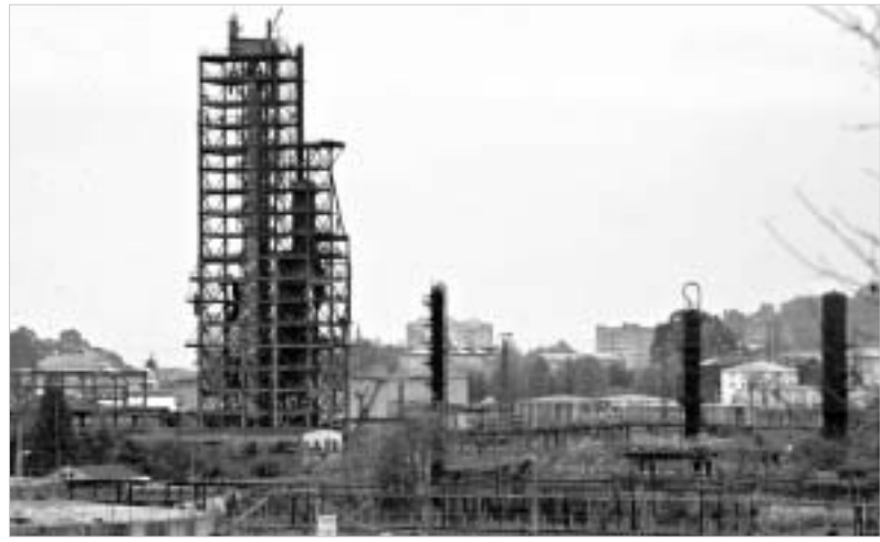
ბათუმის ნავთობგადამამუშავებელი ქარხანა.

უკანასკნელი რამდენიმე წელია, ბათუმის ნავთობგადამამუშავებელ ბაზაზე გამოცხადებულ საპრივატიზაციო მართაში იყოს ჩართული, ბათუმის ნავთობტერმინალის დღევანდელი მესაკუთრე იან ბონდენი სხვა. თუმცა, დანიელი ბიზნესმენის ინტერესი აჭარაში მხოლოდ ნავთობბაზით არ შემოიფარგლება - ის რეგიონში ნავთობბიზნესის გაფართოებას გეგმავს და აჭარაში გასაკლები გამოცხადებული მსხვილი საწარმოების მიერ აღნიშნული საკომპლექსი უნდა განხორციელდეს 2005 წლის 01 ივლისიდან 31 დეკემბრის ჩათვლით შემსუბუქების მიერ წინასწარ განსაზღვრული საკონტრაქტების და მნიშვნელოვანი გრავიუსი შესაბამისად, ზემოთ ჩამოთვლილ მისამართზე ცხრილის მიხედვით.