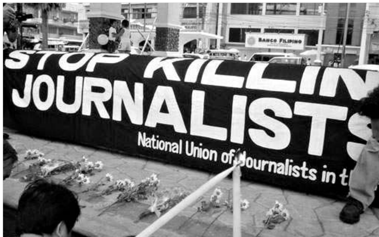
შენწყვეტეთ ფურნალისტთა მკვლელობა