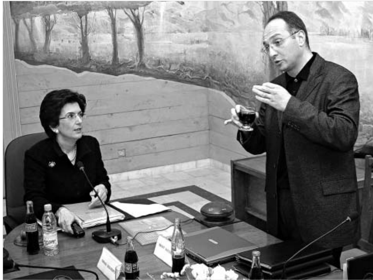
პარლამენტი ქართული სტუმრობის ბრაფიკი შეცვალა

ამერიკის შეერთებული შტატების ლიდერის ლინდსეის მიხედვით, პარლამენტის მუშაობის ბრაფიკი უკეთესია, ვიდრე სტუმრობის ბრაფიკი. ამერიკის შეერთებული შტატების ლიდერის ლინდსეის მიხედვით, პარლამენტის მუშაობის ბრაფიკი უკეთესია, ვიდრე სტუმრობის ბრაფიკი. ამერიკის შეერთებული შტატების ლიდერის ლინდსეის მიხედვით, პარლამენტის მუშაობის ბრაფიკი უკეთესია, ვიდრე სტუმრობის ბრაფიკი.