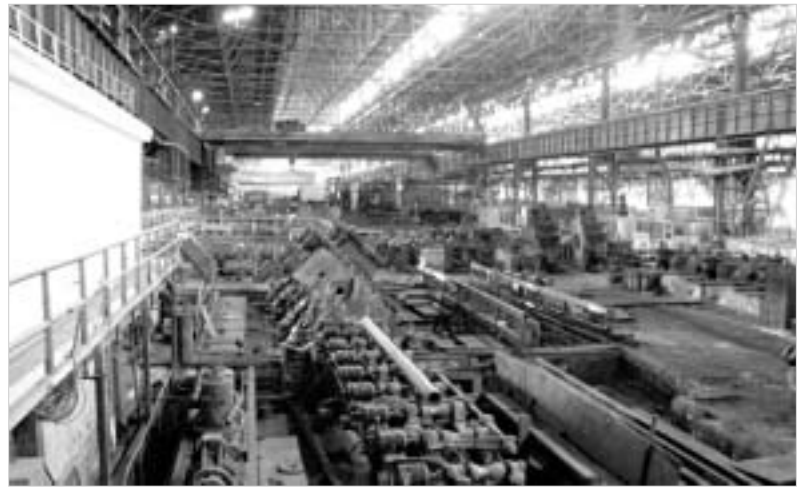
რუსთავის მეტალურგიული კომბინატი.

დღეს ნავთობბაზა მხოლოდ 30-პროცენტული დატვირთვით მუშაობს. ის, ძირითადად, ტრანზიტულ ტვირთს ემსახურება. ამ დროისთვის-