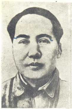
მაო ძე-დუნგი — ჩინეთის კომუნისტური პარტიის ბელადი, ჩინეთის სახალხო რესპუბლიკის ცენტრალური სახალხო მთავრობის თავმჯდომარე.

სახალხო-განმათავისუფლებელი არმიის გმირული ბრძოლებით დამარცხებას დამარცხებაზე განიცდის ანტიხალხური, რეაქციული გომინდანელთა არმია. იგი სულ უფრო და უფრო უკან იხევს და ახლა მხოლოდ მცირე ტერიტორიას ებღალუჭება ჩინეთის სამხრეთ-დასავლეთ ნაწილში. მდგრად ამერიკისა და ინგლისის იმპერიალისტების მიერ წაქეზებული გომინდანური არმია და სულთმობრძავე გომინდანური „მთავრობა“ იქაც დასაღუპავადაა განწირული. სახალხო-განმათავისუფლებელი არმია კვლავ მამაცურად უტევს მათ.