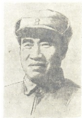
ჯუ დე —ჩინეთის სახალხო რესპუბლიკის ცენტრალური სახალხო მთავრობის თავმჯდომარის მოადგილე და სახალხო-განმათავისუფლებელი არმიის მთავარსარდალი.

მშვიდობისათვის, ახალი ომის წინააღმდეგ მეგრძოლი ქვეყნები ევროპასა და აზიაში, საბჭოთა კავშირთან ერთად, ახლა უკვე 800 მილიონ კაცს ითვლიან, და ამას ვარდა რამდენი მილიონი მშრომელი იბრძვის მშვიდობისათვის აგრეთვე თვით კაპიტალისტურ ქვეყნებსა და მათს კოლონიებში!