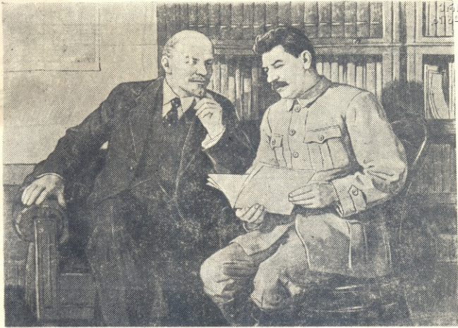
მ. ი. ლენინი და ი. ბ. სტალინი