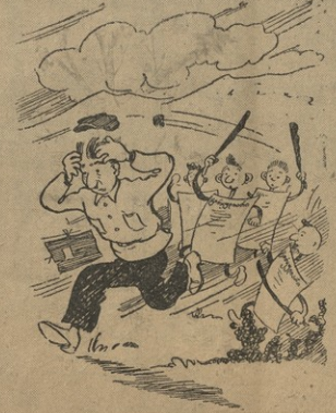
2. ამის შედეგად კომმუნისტების აგრო-ნომიაც ოფლის ღვჩიან უბლებ.