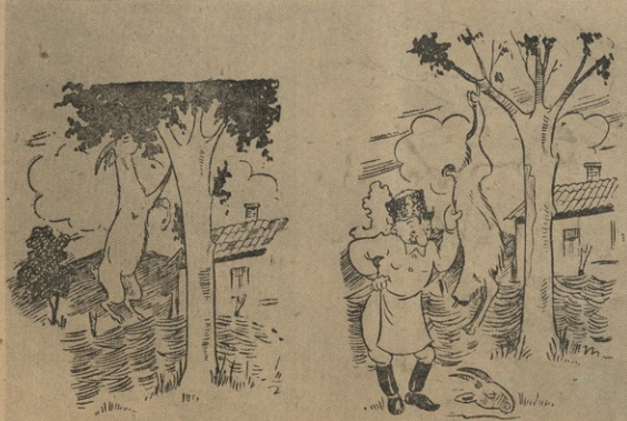
1. შილი ვნახით თუთა, რამ შეჭაბა თუ-თა, მიველ ვნახე თუთა, თხამ შეჭაბა თუთა. 2. შილი ვნახით თხა, რამ შეჭაბა თხა, მიველ ვნახე თხა, ბრიგადირმა კემა თხა...

ს.კ. კ. ბ. (ბ) ცენტრალური კომიტეტის პლენუმის დადგენილებიდან