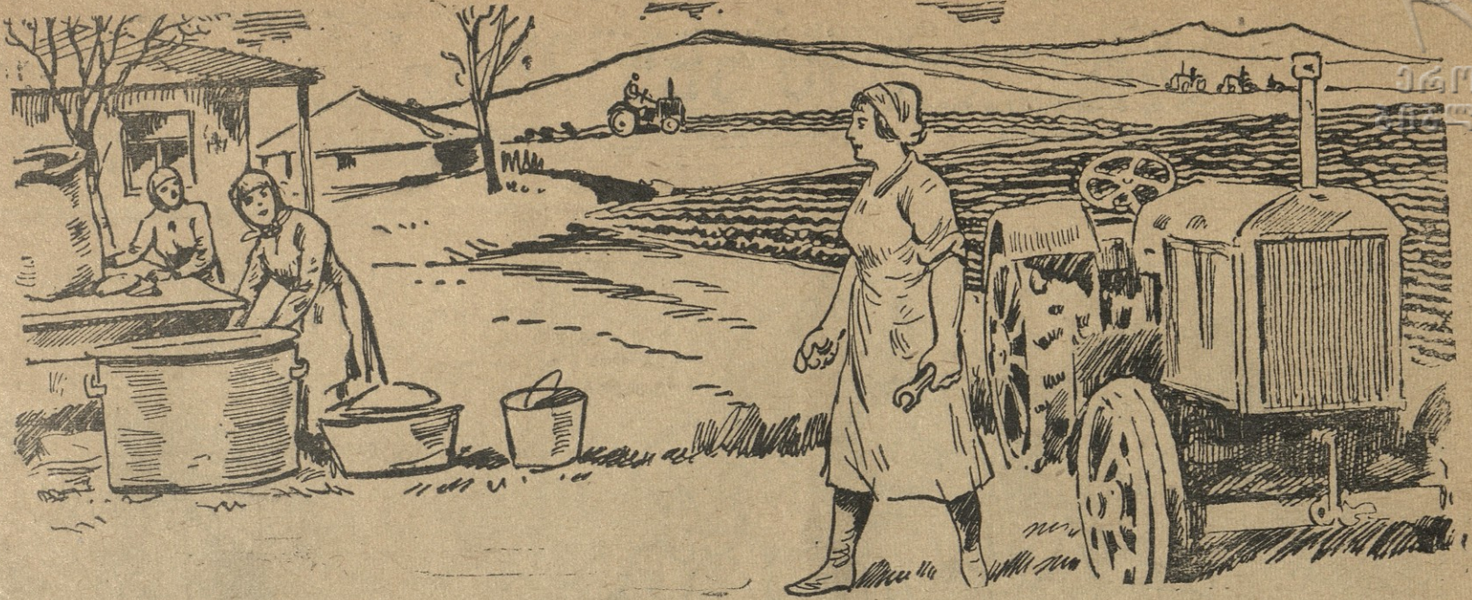
— ხედავ, როგორ ჩაგრავე ჩვენი ქეთევანი თავის მეუღლეს. — სახლში? — სახლში კი არა, მინდვრად: ხვნის გეგმების შესრულებაში ქმარს სამჯერ გადააჭარბა.