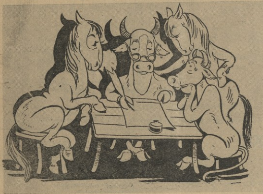
— შისწერე, ნაყოფა, ადგილობრივი მრეწველობის მუშაკებს, რომ, შიში არ იყოს, ჩვენც გვსაუბრობო პირველი მოსოფენილების საგნები..

აშ. ბ. ა. ანდროპოვის მოხატვისაგან ს.კ. კ. ბ. (ბ) ცენტრალური კომიტეტის პლენუმზე