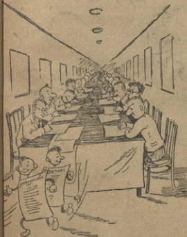
1. ცენტრის აგრონომები „ოფლის ღვჩიან“.