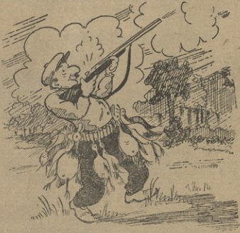
2. და ფინელების მეფრეობისთვის ურთულე-ბისშიქცევის შეუღლა.