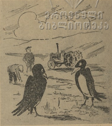
— გავფინდეთ, ურთულა, თორმეტიკატორსტე-ბი ქვებს და ვიწინენ. — რას გვეჩიან, ჩვენ რომ ვიპყვებობს ძენის ღრის მიწას ვჩიქითი, ეგენი თვანი მოხრულად იწე-ჩენ და უბატონობსანა როგორ ვაგვიცემენ.