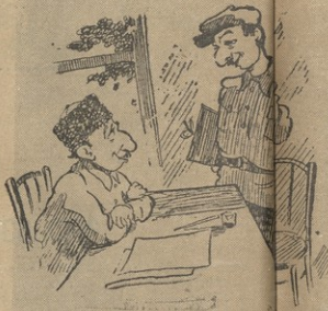
1. — კომმუნისტებში "მივდივარ," წველების მეფრეობას უნდა მივაქციო ურთი-სოქვა აგრონომია და...

აშ. ბ. ა. ანდროპოვის მოხატვისაგან ს.კ. კ. ბ. (ბ) ცენტრალური კომიტეტის პლენუმზე