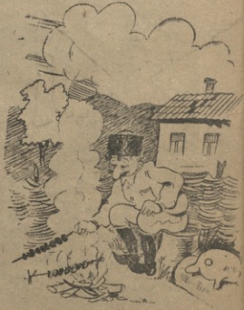
3. შილი ვნახით ბრიგადირი, რამ შეჭაბა ბრიგადირი... ბრიგადირმა თხა და თუთა შეჭაბა.