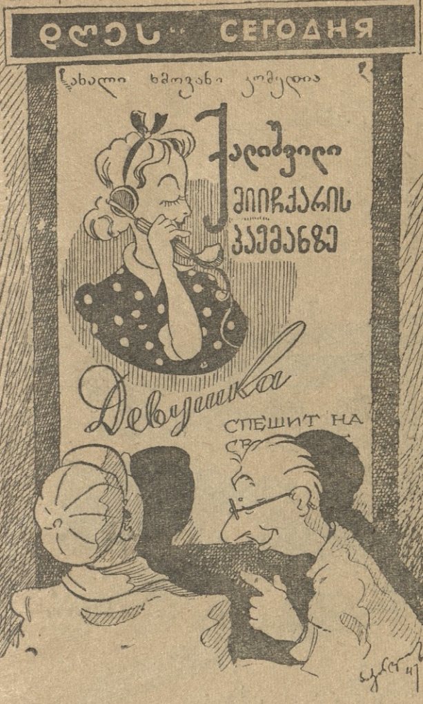
— საკვირველი ქალი ყოფილა, ათი წელიწადი პაემანზე მიიჩქარის და ჯერ ვერ მისულა!..

წინდახედული ხალხი ყოფილა თქვენს ფოსტაში. რაკი წესად ჰქონიათ დეპეშის მხოლოდ... ერთი თვით დაგვიანება — თქვენი ჩამოსვლის რიცხვიც სწო- რად გადაუწევიათ. რას ერჩით?—აბა ნახეთ ზოგიერთ სხვა ფოსტაში—იქ ამ სიკეთესაც არ გამოიმეტებდნენ.