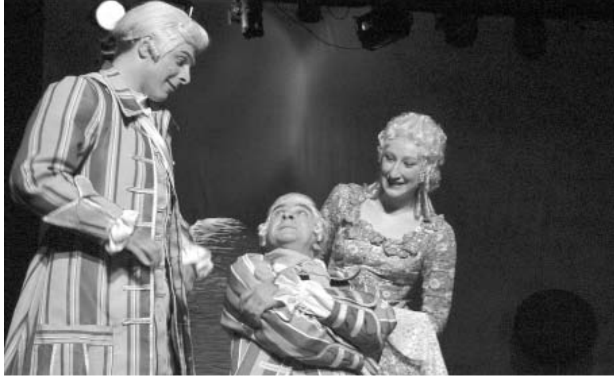
პარი ვალანსის ფოტო

გაუგებრობების ჯაჭვზე ავებული კომიკური ინტრიგები ნათ-