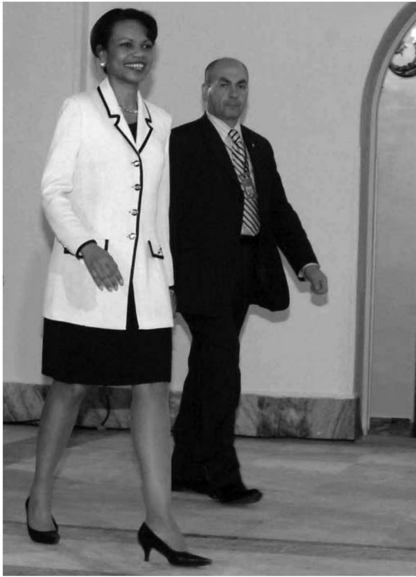
კონდოლიზა რაისი, ოფიციალური მოლაპარაკებებისთვის, 2005 წლის მეორე ნახევარში ეწევა საქართველოს.