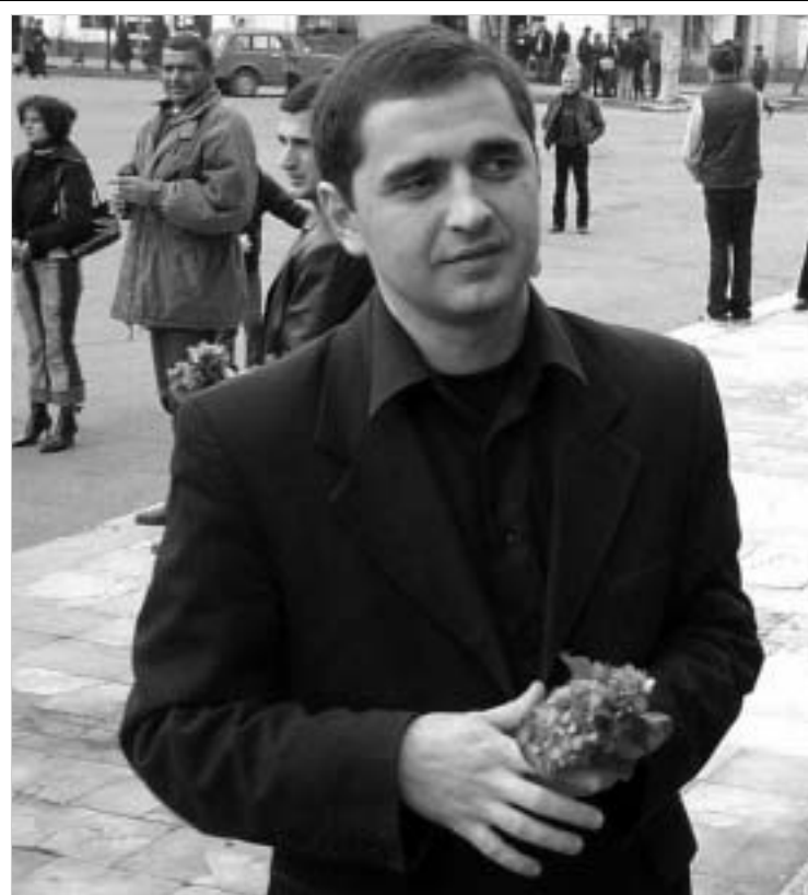
გურიი თვალცრემლიანი ემშვიდობება თავის გაბერნატორს

დი საინფორმაციო პროდუქტები რუსეთის ტელევიზია და რადიოა. გარდა ამისა, აფხაზეთი რუსეთის ვლას არ გულისხმობს. აფხაზური ენის განვითარების ფონდმა ენის შესწავლის თანამედროვე მეთოდიკა შემოიშალა. აქ გახსნილია უკრისები, როგორც ბავშვებისათვის, ასევე მოზრდილთათვის. თუკი გამოდიოდნენ წინადადებით, აქ, ფონდის იმის რესურსი არ გააჩნია, რომ მოსახლეობის სერიოზული ნაწილი მოიცავს. აფხაზეთში უკვე მიღებულია კანონი "სახელმწიფო ენის შესახებ", სადაც, კერძოდ, მითითებულია, რომ 2010 წლისთვის ყველა დაწესებულებაში საქმეთა წარმოება სახელმწიფო ენაზე უნდა განხორციელდეს. თუმცა, უკვე დღეს გათვლილია, რომ რეალურად ეს შეუძლებელია. იმის მიუხედავად, რომ აფხაზური ენაზე მოლაპარაკე დაამაინებინა რაოდენობა გაიზარდა, პარალელურად, რუსული ენის პოპულარობის განმტკიცება მიმდინარეობს. ჯერ ერთი, რუსული, კონსტრუქციის თანახმად, ოფიციალური ენაა. თანაც, რუსული ენის პოპულარობის გაზრდას ხელს უწყობს აფხაზეთის ყოფნა რუსულ კულტურულ სივრცეში. აფხაზეთის მოსახლეობისათვის სხვადასხვა