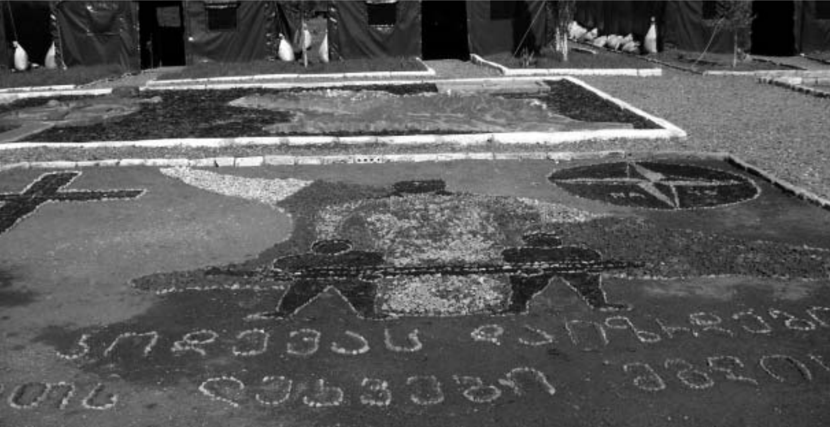
ამ დღეისთვის გამოძახილია, ალბათ, ბატალიონის გერზე მგლის გამოსხვა.