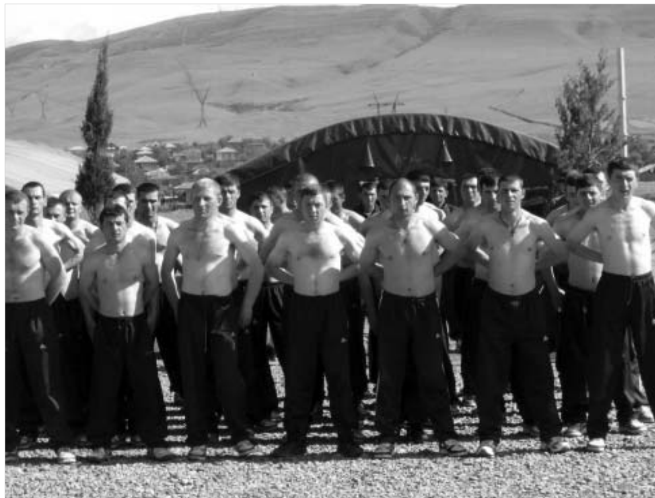
ქუთაისის 22-ე ბატალიონი ერთ წელიწადში ქართული ჯარის ჭეშმარიტი პრესტიჟის დემონსტრირებას გეგმავს.