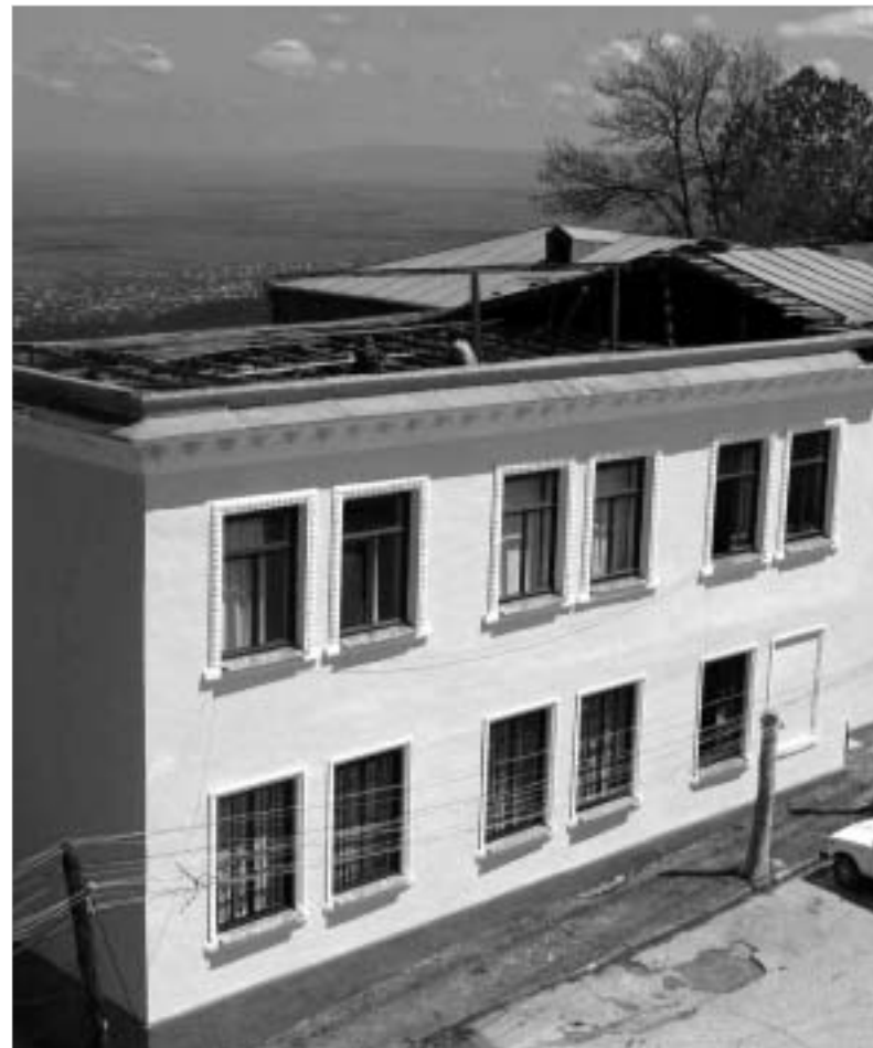
ქარიშხალმა სიღრმის მიხედვით კახეთს სახურავი გადახადა. მიხედვით სიღრმის შენობა. ცოტა ხნის წინათ, მსოფლიო ბანკის დაფინანსებით გარემონტდა.

კახეთის რეგიონს სტიქიამ უკვე მეორედ შეუტია. გუმბირ, დღის პირველ ნახევარში, უეცრად ამოვარდნილმა ძლიერმა ქარიშხალმა, რომელიც მთელ კახეთს ერთი საათის მანძილზე უტყვდა, ელექტროსადენები დაწვეთა, რამაც რეგიონში ენერგომომარაგების პარალიზება გამოიწვია.