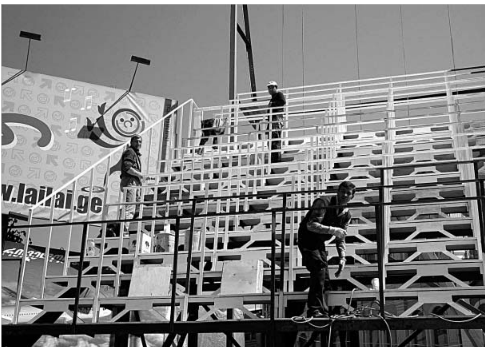
ბუშის ვიზიტისთვის მოედანზე აღმართული კონსტრუქციების დასაშლელად.

ზიტთან იყო დაკავშირებული, სიმართლეს არ შეესაბამება. გზების მშენებლობა მომავალშიც გაგრძელდება. ამას ის ფაქტიც მონიშნავს, რომ ამჟამად 40-მდე ქუჩაზე ტენდერი გვაქვს გამოცხადებული. რაც შეეხება ამერიკის პრეზიდენტის ვიზიტისთვის განეული ხარჯების საბოლოოდ ჯერ არ შეუჯამებიათ. რაც შეეხება ფასადებსა და გზებს, მათი შეკეთება მომავალშიც გაგრძელდება. მოსახლეობაში არსებული ეჭვების გასაქარწყლებლად, გაუშინ თბილისის მერმა ზურაბ ჭიაბერაშვილმა ვარკეთილის მიმდებარე ტერიტორია თავად მოინახულა, სადაც გზის შეკეთება მიმდინარეობს. როგორც მერმა აღნიშნა, მთავრობა გზების შეკეთებას მხოლოდ ცენტრალურ უბნებში არ აპირებს და მალე გარეუბნებშიც გადაიწყვეტენ."