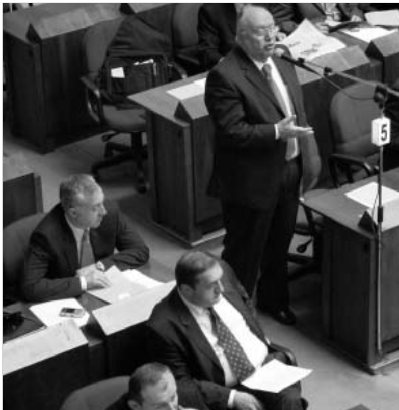
მაღა ქაშაში მოდის: გუმბინდელ სხდომაზე დეპუტატებს "გაახსენდეთ", რომ წლების წინათ მომხდარი სტიქიის შედეგად დაზარალებულ მოსახლეობას დღემდე არაფერ დახმარება.

მაღა ქაშაში მოდის: გუმბინდელ სხდომაზე დეპუტატებს "გაახსენდეთ", რომ წლების წინათ მომხდარი სტიქიის შედეგად დაზარალებულ მოსახლეობას დღემდე არაფერ დახმარება და საჩუქრის, სიღნაღის რაიონების, აგრეთვე, თბილისის მოსახლეობის გარკვეული ნაწილი კვლავაც გაუსძაღის მდგომარეობაში იმყოფება. თუმცა, პარლამენტართა დაფინანსებული მოთხოვნის მიუხედავად, მაინც საუკეთესო, რომ გასულ წლებში სტიქიის შედეგად დაზარალებულთა დახმარებად მთავრობამ დღეს რაიმე სახსრები გაიღოს. საბიუჯეტო ცვლილებების შედეგად გამოყოფილი 20 მილიონი ლარი მხოლოდ ორობეჯი კვირის წინათ წყალდიდობებისა და მე-