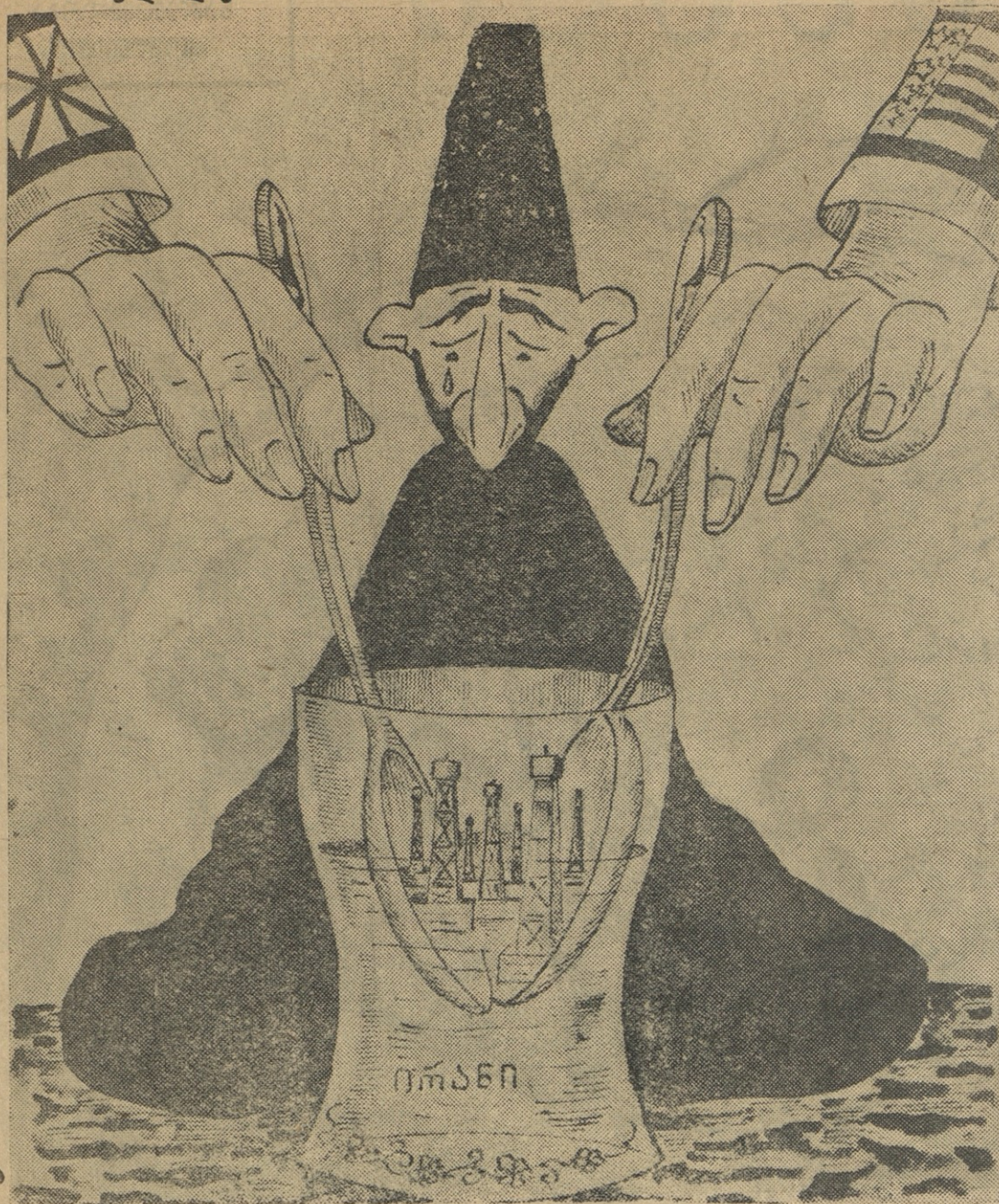
უცხოური კოვზები ირანულ ჭიქაში.