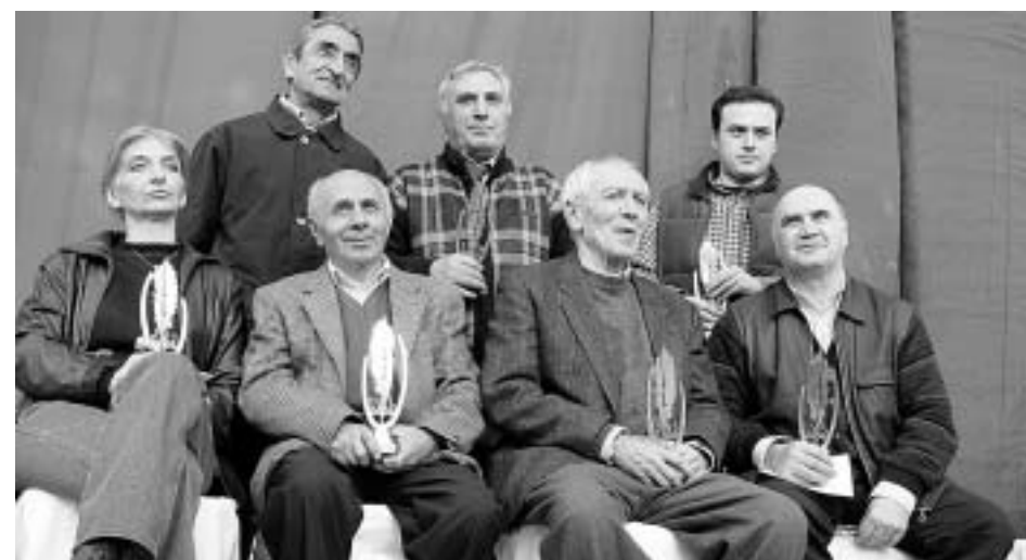
"საბა" 2004-ის ლაურეატები