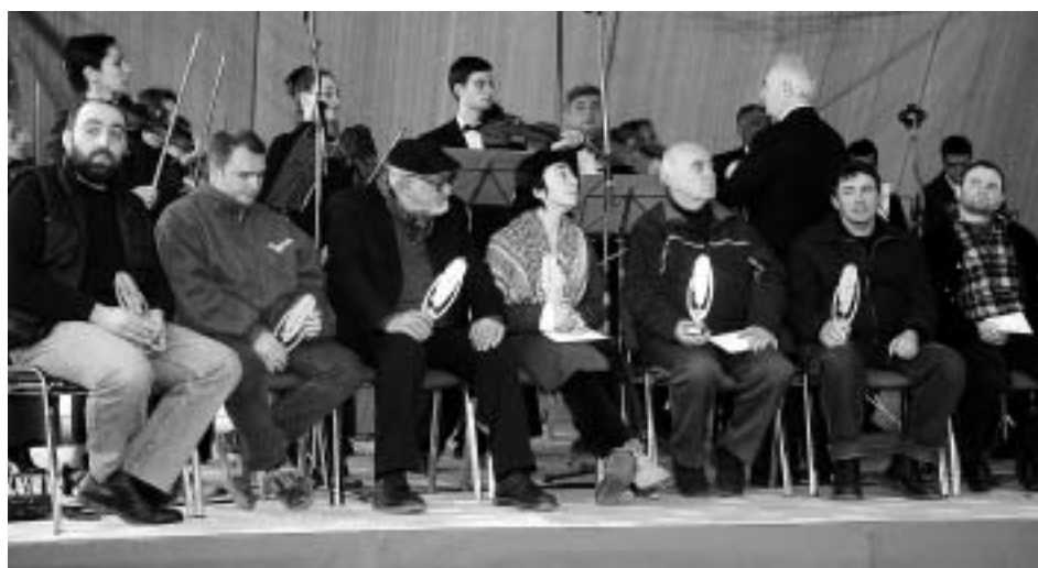
"საბა" პირველი გამარჯვებულები