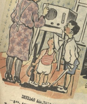
შეშოში ბაი-შეშოში — ვაი, მალე, პეტრე, დამეცა, ყოველ დარღვევა... მატრამ... მატრამ... მატრამ...