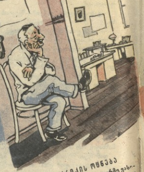
შოშოში ომება — უთხრა რომ ჩამოვით ვა- ბოვნი, დამეცა, ყოველ დარღვევა... მატრამ... მატრამ... მატრამ...