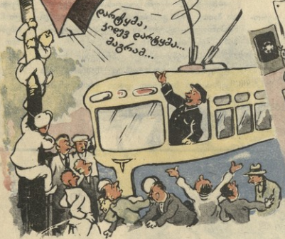
ქინადა დაქად შოშოში — ჩამოვით ჩამოვით?