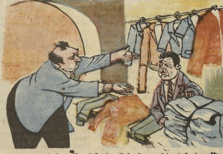
ნახ. თ. კოჭიაშვილისა

— კაცო, ეს რა გენია, საწურობიდან ჩვენზე ფარბიკის მიერ დაწაფი- ბული ცული კოსტუმები წამოვიდა?! ვის მოაქვებთ, ვის მიხყიდ?! ბახაკამიძე