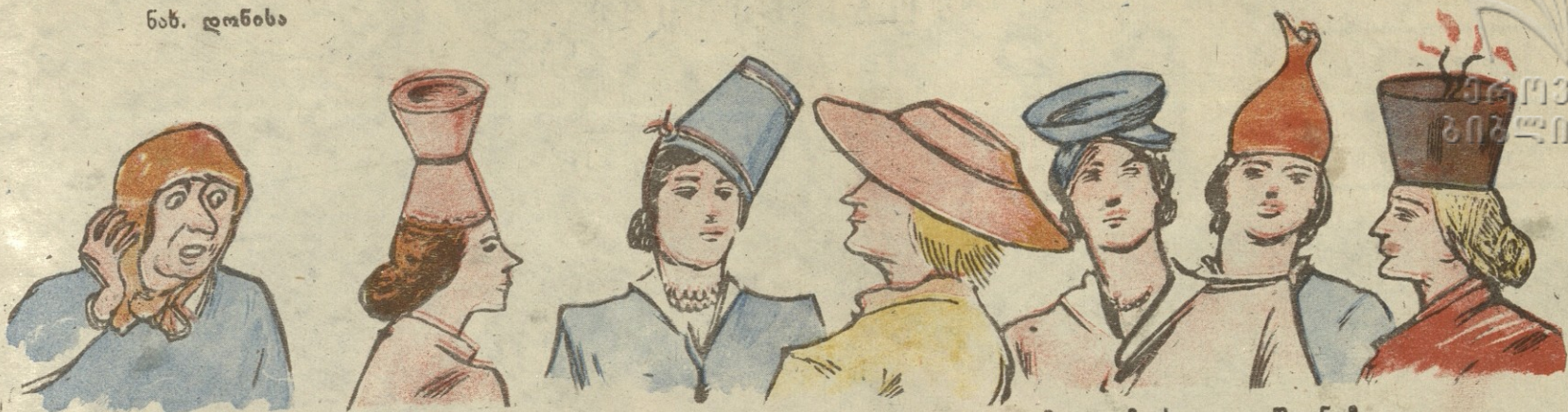
— უი ქა! რაც ჭურჭელია, სულ ამით დაუდვიათ თავზე და მე სადღა ვიშოვნო?