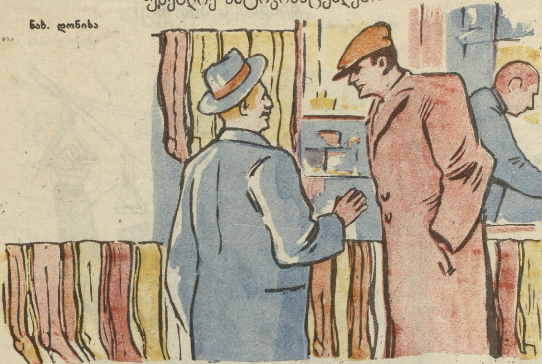
დიდ პატივსა სცემენ ჩვენი ფაბრიკები ქალთა სქესს: ჩულქი იმდენი გამოუშვებს, ას წელიწადს ეყოფათ ქალებს, მამაკაცის წინდა კი—სანთლით საძებნია...