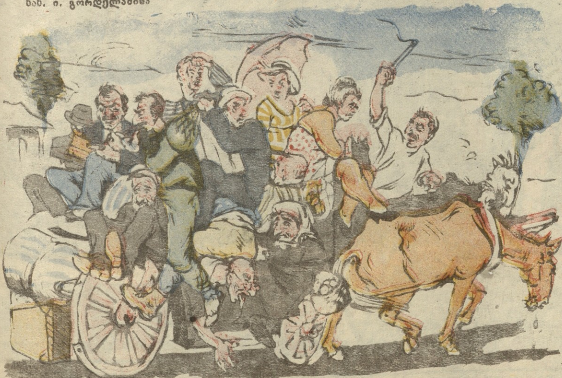
შემატლი: მიიწ-მიიწით, ერთი-ორი მუშტარი კიდევ მელოდება და მერე კი არხინად გაგაქროლებთ.