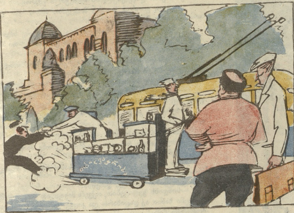
— მართლაც რომ გაქანებული ვაქრობაა, მყიდველი ვერ წამოეწევა!