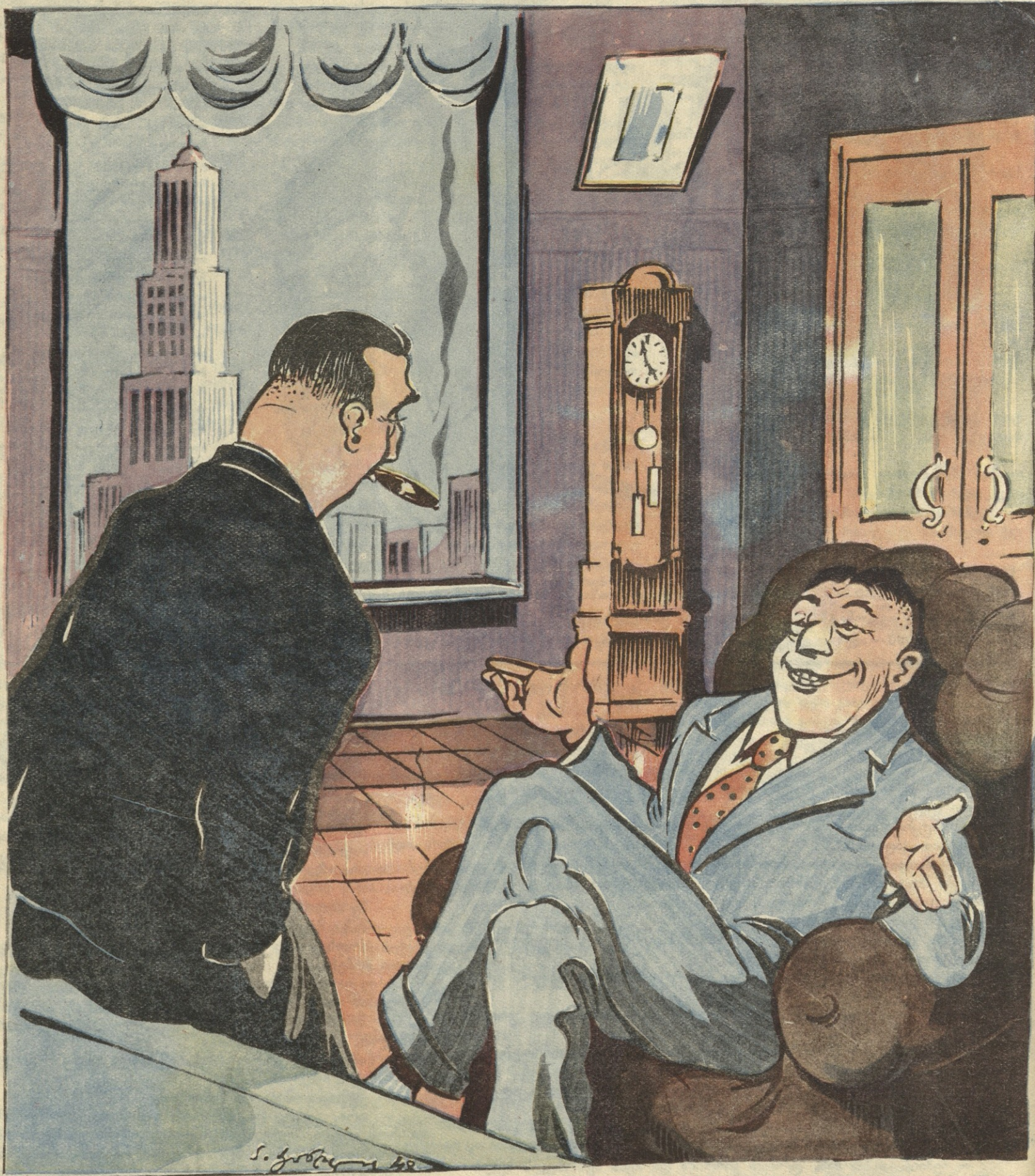
—აგრე, სერ, უნდა გაუმჯობესდეს, თორემ ახლა რამდენიმე ათასი კაცის მეტის მოკვლა არ შეუძლია და განა ღირს ხმარებიდან ამოხალბებად?

საკრედიტო კოლეგია: ი. გრიშაშვილი, კარლო კალაძე, უჩა ჯაფარიძე, ს. ფაშალიშვილი, გრ. აბაშიძე (პ/პგ. რედაქტორი)