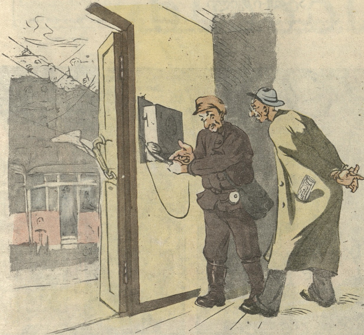
ქონდუპტორი—კაცო, ტრამვანს სამმართველოში ხაზის გაკეთება უნდა მეცნობები— ნა, ამ ოხერმა ავტომატმა კი ორშაუროიანი ჩამიყლაპა. მომალბამ—აღბათ გიცნოთ და თქვენ მოგბაძათ ორშაუროიანების „ყლაპვაში“.