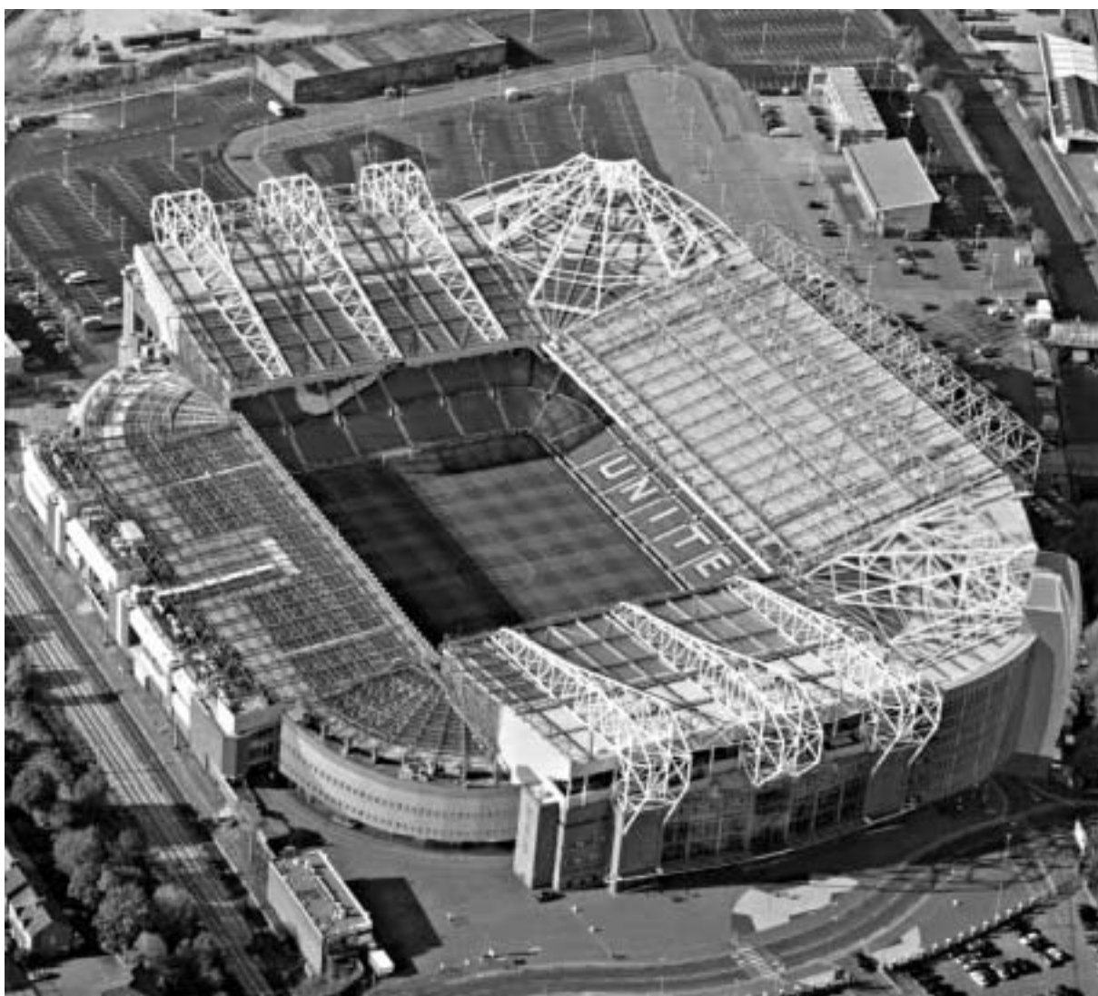
ამერიკელი მანჩესტერის "ოლდ ტრაფორდს" გლეიზერი უპატრონებს.

გლეიზერი "მანჩესტერ იუნაიტედი" პირველად 2004 წლის შემოდგომაზე დაინტერესდა. დირექტორთა საბჭოს წინაშე ოფიცია-