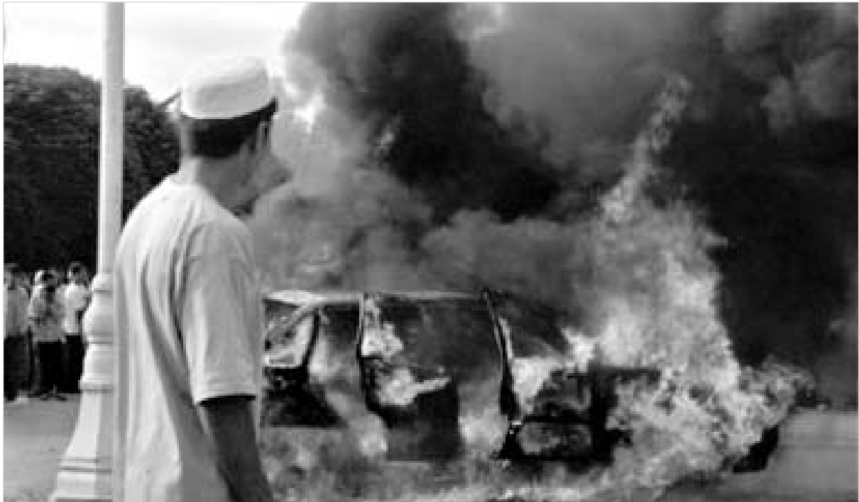
"ანდრეიანის ამბოხის" სისხლში ჩახშობა. შეიძლება, ისლამ კარიმოვისთვის "პირობის გამარჯვებდა" იქცეს.

ბოხებულები ერთ-ერთ ისლამისტურ დაჯგუფებას მიეკუთვნებიან. მაგრამ, თუ ზემოთ მოყვანილი მიმართვები აღწერილი ვითარება სიმართლეს შეეფერება, სიტუაცია სრულიად სხვა სახეს იღებს. სხვათა შორის, გუშინ ზოგიერთი საინფორმაციო საშუალება ანდრეიანის უნერბოგებებში დამნაშავედ მხოლოდ და მხოლოდ ისლამ კარიმოვსა და მის მიერ გატარებულ რეპრესიებს ასახელებდა, რაც, ალბათ, მნიშვნელოვანწილად შეესაბამება სიმართლეს.