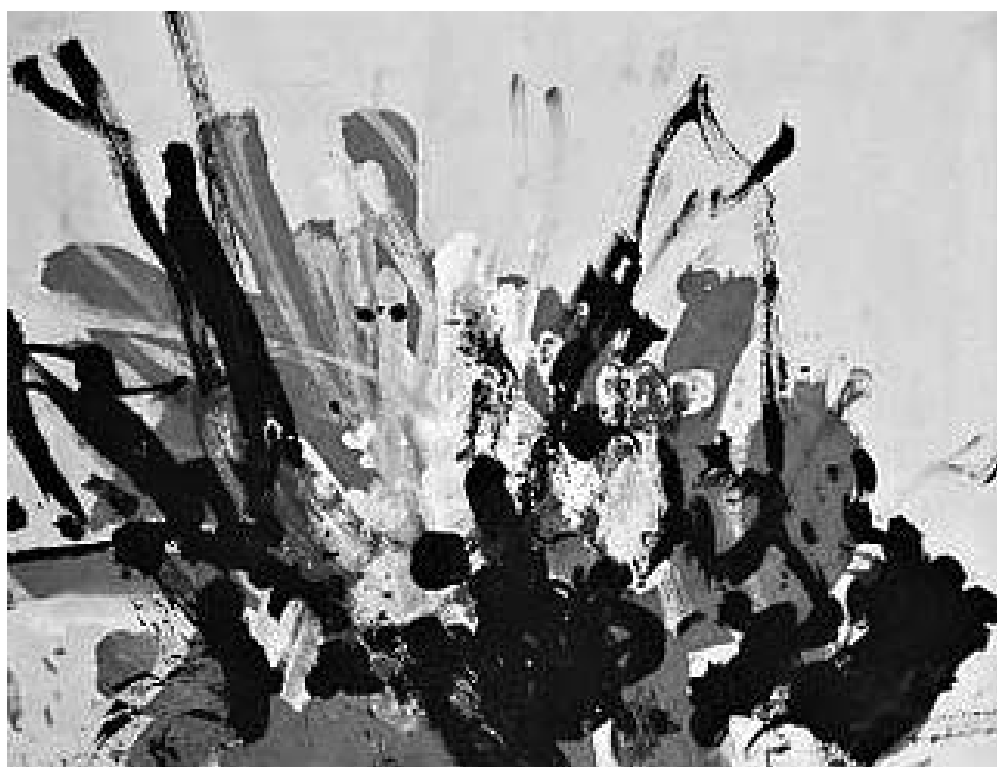
ეს ნახატები შიმპანზე კონგოს შექმნილია.

შიმპანზე კონგოს მიერ ცოცხალი ფერებით შესრულებული ნახატების კოლექცია, რომლის ნამუშევრებს, როგორც ცნობილია, დიდი რუდუნებით ინახავდა პიკასო და მისი, 2005 წლის 20 ივნისიდან ლონდონის პრესტიჟულ აუქციონზე დაიდებს ბინას. კონგოს ნამუშევრებთან ერთად ენდი