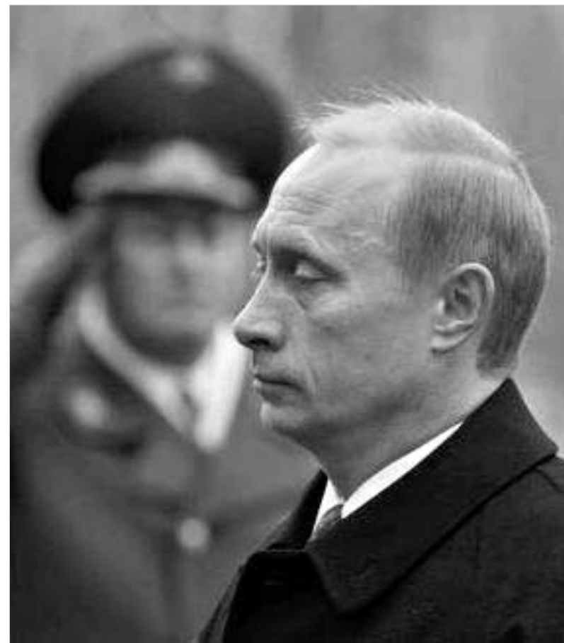
მარკუს ლინდერი Handelsblatt

როდესაც რუს მწერალს ვიქტორ ეროფეევს პრეზიდენტ ვლადიმირ პუტინის შესახებ აზრის გაზიარება სთხოვეს, ეროფეევმა უპასუხა: "არის ორი პუტინი ან, შესაძლოა - მეტიც. მას ჯერ არ გადაუწყვეტია, ვინ სურს, რომ იყოს - რუსი თუ ევროპელი, დემოკრატი თუ ავტორიტარული მმართველი".