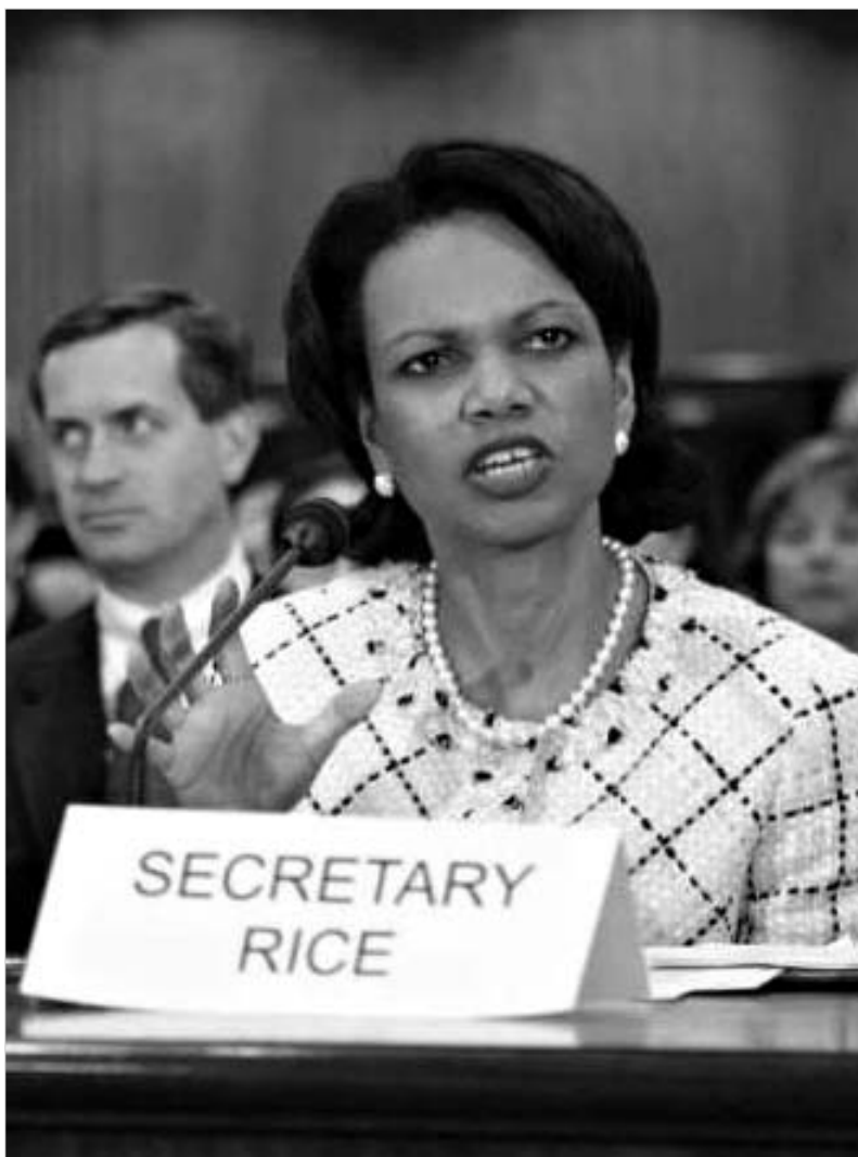
აშშ-ს სახელმწიფო მდივანი მოსკოვს საქართველოდან კარის სასწრაფოდ გაყვანისკენ მოუწოდებს.

იმ შემთხვევაში, თუ 16 მაისამდე ბაზების გაყვანასთან დაკავშირებით კონკრეტული შედეგები არ იქნება, საქართველო უშადალვე