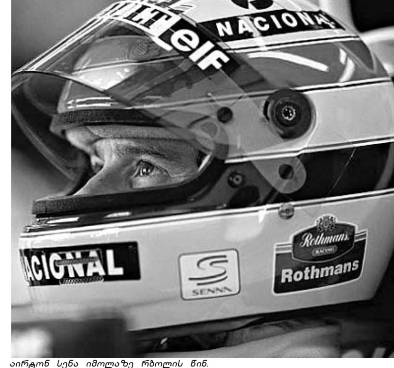
აირტონ სენა იმორლაზე რბოლის წინ.

ბიბა ბარსაშვილი ავარია, რომელმაც 1994 წლის 1 მაისს ფორმულა 1-ის სამყარო შეძრა, დღემდე დიდ ენთუსიაზს იწვევს და "სან მარინოს დიდ პრიზზე" დატრიალებულმა ტრავმადამ, ფაქტობრივად, მთლიანად შეცვალა როგორც სამეფო რბოლებისადამ და მომავალი და მომავლის უსაფრთხოების წესები. "უილიამსის" ბრაზილიელი მრბოლის, სამგზის მსოფლიო ჩემპიონის აირტონ სენა და სილვას დალუპის შემდეგ 11 წელიწადი გავიდა, მაგრამ "იმოლას" ტრასის შემთხვევა დღემდე გამოძიებულია სჯა-ბასის საგანი იყო. ოთხშაბათს იტალიის სახელმწიფო პროკურორმა რინალდო როსინომ გამოძიებულ ბრაზილიელი მრბოლის დალუპის საქმის დახურვა სთხოვა. მიზეზი გამოძიების ვადის ამოწურვაა.