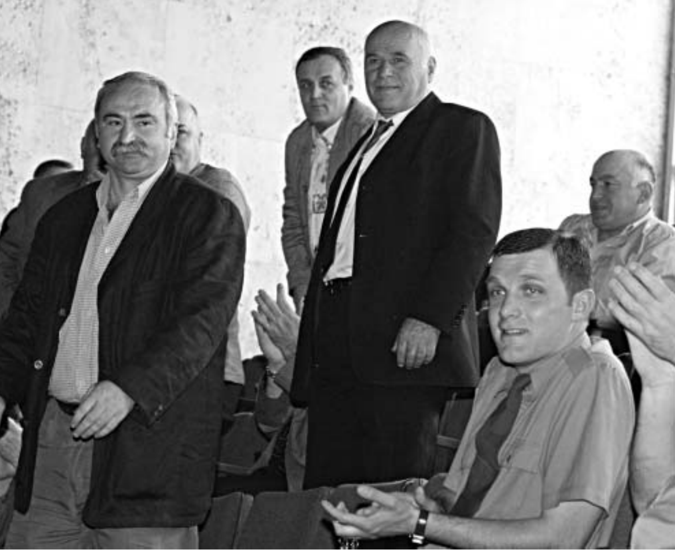
საქართველოს ჩემპიონი "იბერია 2003" თბილისის "დინამოს" 1981 წლის თაობამ დააქვლდნენ.

ფინალურ სერიაში გამარჯვებისთვის ორი მოგება იყო საჭირო. წინდანი გეტყვით, რომ ჩემპიონის გამოსავლენად აუცილებელი გახდა სამი მატჩის გამართვა. ფაქტობრივად საქართველოს ეროვნული ნაკრების საბაზო გუნდი "იბერია 2003" იყო მიჩნეული. სერიის პირველმა მატჩმა ეს შოსაზრება ნაწილობრივ დადასტურა: მეორე ტაიმის შემდეგ ისინი იბერიელები 4:1-საც კი ამარცხებდნენ მეტოქეს, მაგრამ "სარანგმა" შესაშური საბრძოლო სულისკვეთება გამოავლინა; დარჩენილ დროში სამი უპასუხო გოლის გაიტანა და მატჩი ოვერ-ტაიმამდე მიიყვანა. მოვლენების ასეთმა განვითარებამ "იბერიას" ნევრებზე ფსიქოლოგიური შოკის მსგავსად იმოქმედა და დამატებით დროში "შებრძოლებმა" კიდევ სამი გოლი გაიტანეს, თავ-