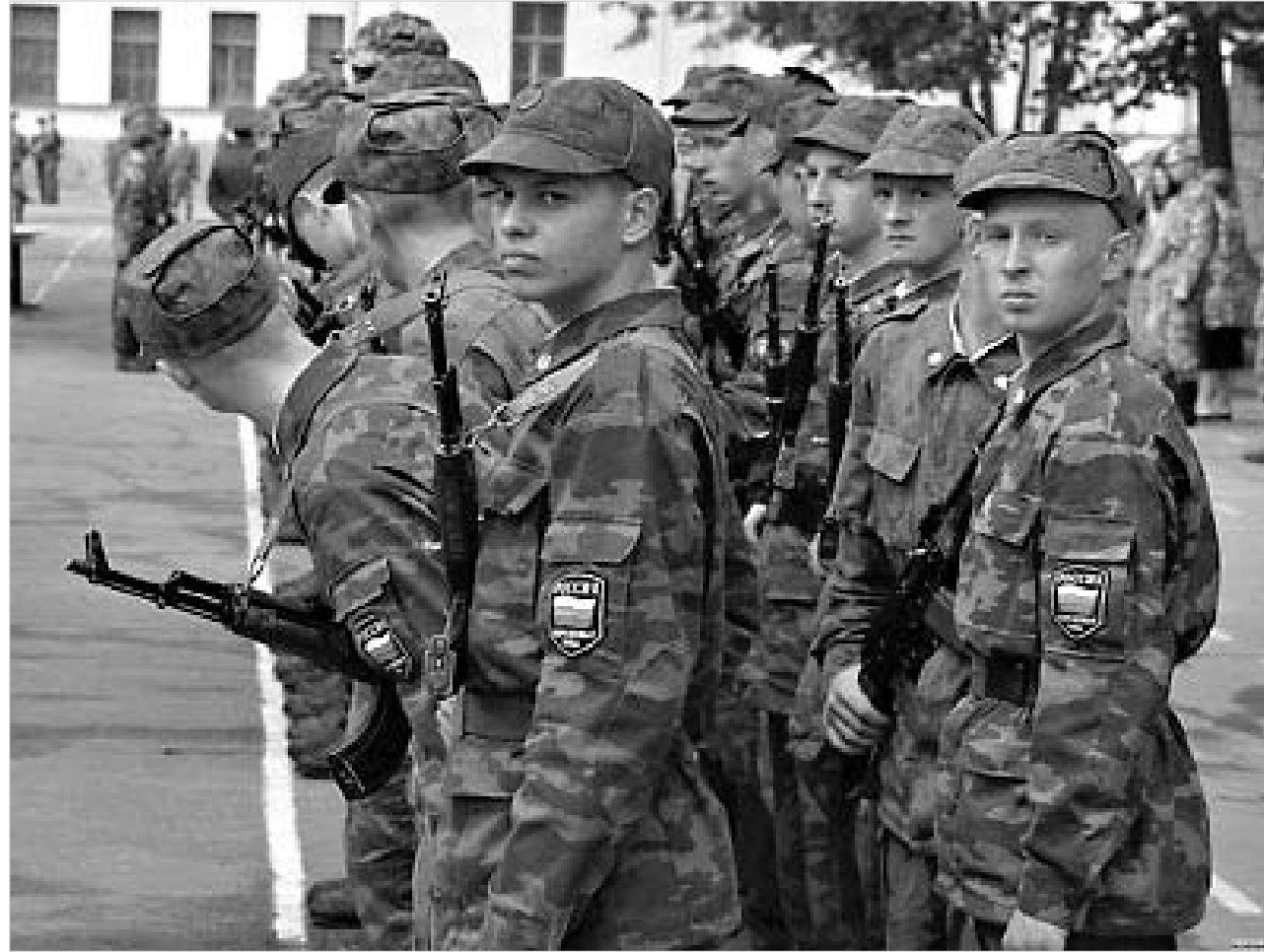
შესაძლოა, ეს ტარისკაცები აღმოჩნდნენ რუსული ბაზის ბოლო რიგშიც.