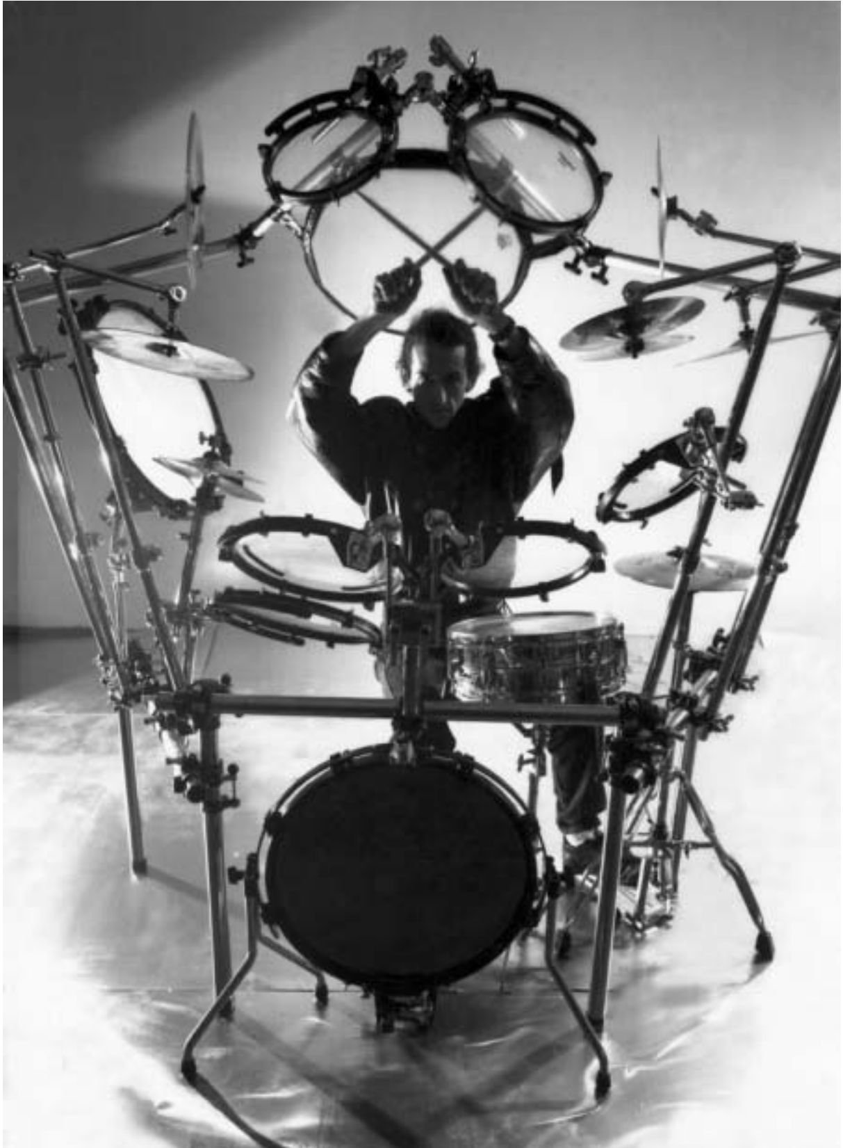
დღეს "ნერი" არ მოგაწყენთ.