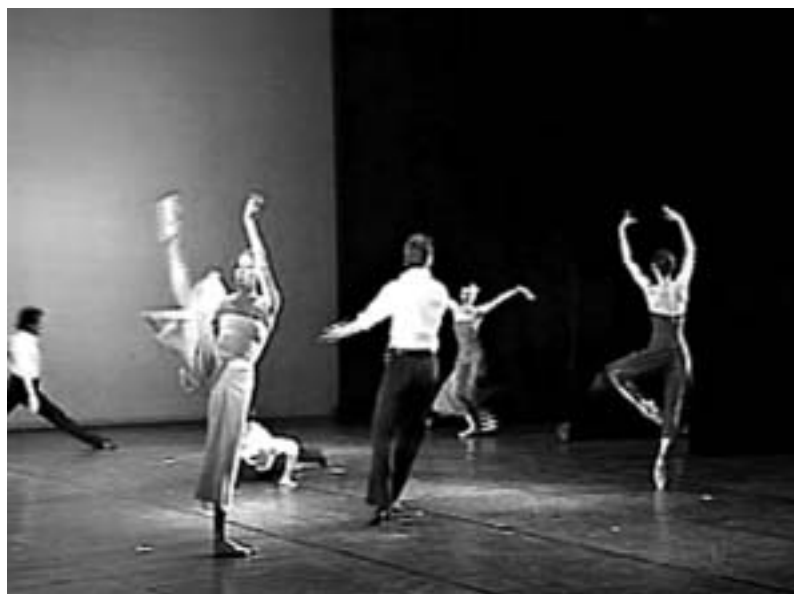
დიდი თეატრის მოსკოვში პრობლემები შექმნა.

პროტესტის ნიშნად არც ერთ პოლონელს ბილეთი არ უყიდა