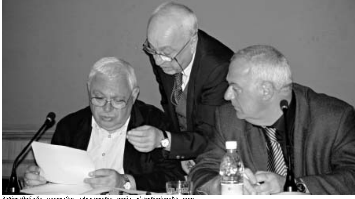
პარლამენტში ყველაზე აქტიური თემა უსაფრთხოება იყო.

„გუბის საფარი მოუნსრინებელია, გზის საავალი ნაწილი დახაზული არ არის, საჭეს ხშირად ნასვლი და ნარკოტიკები გარეუბლები მძღვლები უხსენდნ. ამას ისიც ემატება, რომ ბევრი