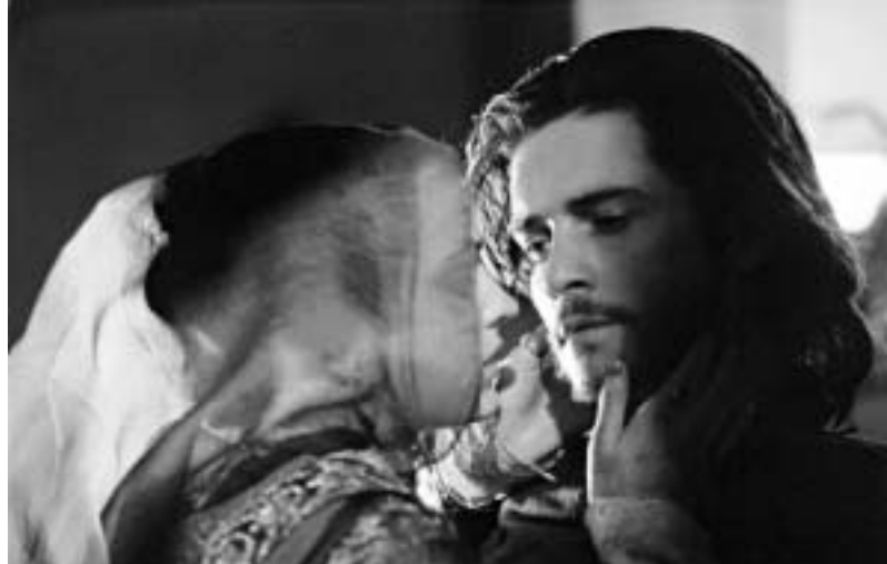
კვირის ყველაზე შემოსავლიანი ფილმების ათეული ახალი კინოთავსების მონაცემებით