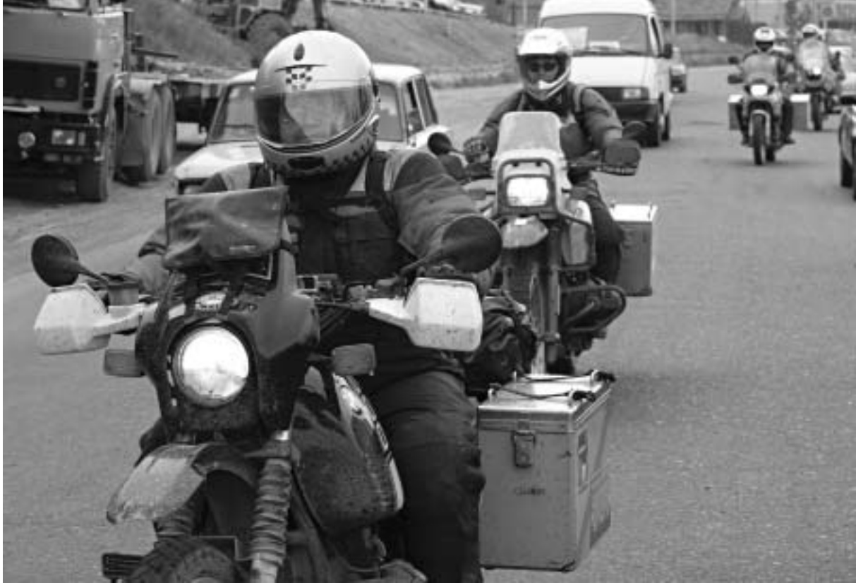
ამერიკელი მხედრები თბილისის მისადგომებშია.