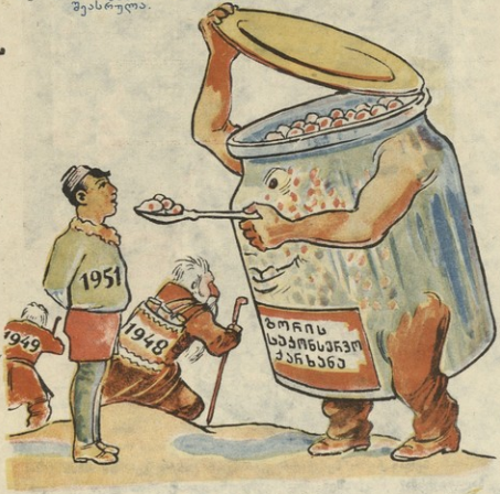
ბორის საკონსტრუქციო ქარხანა (1951 წელს): შერე აგრე ტპე- ლად და შადე დამბერდი, რეაგრეც ეს წლები დავაბერე.

გორის საკონსტრუქციო ქარხანაში ნოუთონიანი გეგმა 1948 წელს შეასრულა.