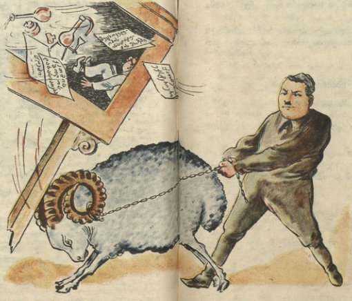
თუ მატყავს... ა. გ. მოსიჩიძე

ახალი დივისი ცეკამიშვეს ამა. არიოდ ნატროპილის მეცნიერების ინსტიტუტის ძველი სტუდენტო ვიდედმანიად ხელს უშლიდა. ინსტიტუტის მეც. თანამშრომლებს ღწენ დღე მუშაობას.