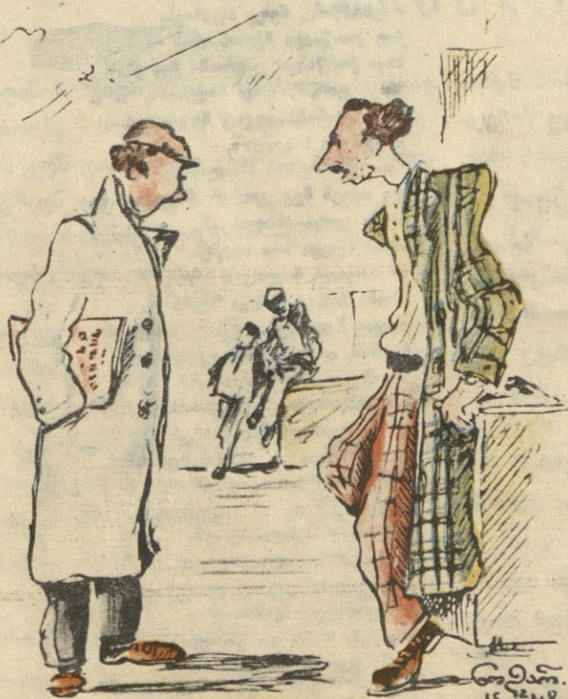
— რამ დაგაღონა, შენი პიესა რეპერტუარში არ მოხვდა? — რეპერტუარში კი არა სცენაზეც მოხვდა, მაგრამ ისე სუსტი აღმოჩნდა, რომ დამღვმელსაც ბევრი მოხვდა და მეც.