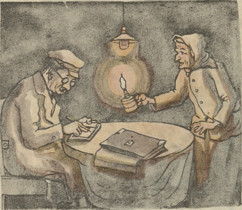
— ერთი ეგ კრაქი მომინათე დედი, თორემ ელექტრონის შუქი ისე მკრთალია, რომ ენერჯიის ხარჯვის ქვითარი ვერ გაშომიწერია.

ვორონცოვმა პლ. იოსელიანი ათონის მთაზე ვაგზავენა. პლატონმა სხვათა შორის, საბერძნეთის მეფე ოტტონიც იწახულა. მიღების დროს მეფემ შემდეგი თავაზიანი სიტყვა წუთხარაუროთ ველ სწავლულს: