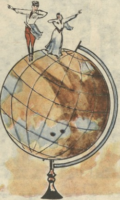
ეს მიზე კარად იამაზიის, დეის წყვეტზე დევათ...

ხალხური ცვდების ანამბეზი ო სოხე- შეილისა და ნ. რაინიშვილის ხელმძღ- ველობით ცვევა-თანის 1948 წლის ცხე- ნი დიდი ვაუაბარებელი შეასრულა— მის წყვეტზე შეზიარა საბჭოთა კავში- რი და თითქმის მთელი ევროპა.