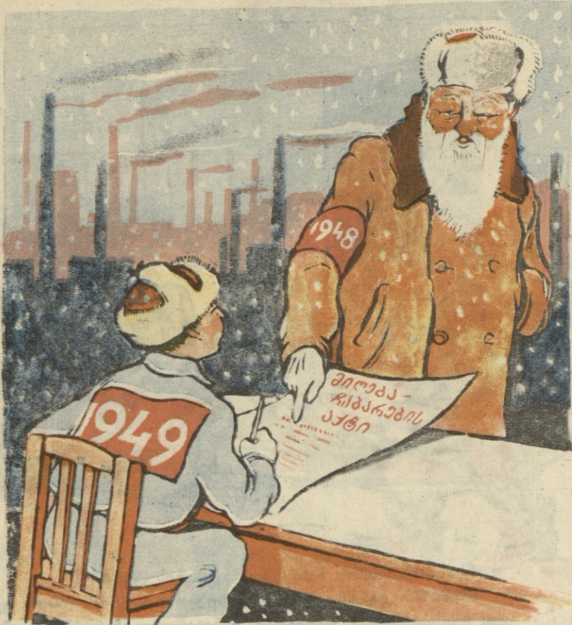
ქველი წელიწადი (ახალ წელიწადს): გადავიდეთ ქალაქებზე. ჩახწერე სრულიად ახალი ქალაქები რუსთავისა და მაღლაკის ველებზე.