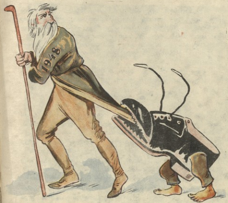
მომად უბარაბა (1948 წელს): ცოკა კადეე დამბეზადე, ფეხ- მამაცე და იხე წადი, თორე ახალ წელს ახე სამარცხენოდ წამ არ შეგეუდებე!

ფეხსაცმელების მცირე ფაბრიკა 1948 წლის გეგმის შესრულებაში ჩაბარა.