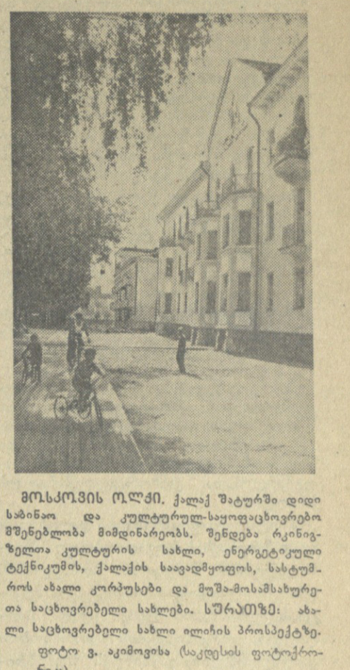
მოსკოვის ოლქი. ქალაქ შატრის დიდი სახლი და კულტურულ-საოფისო მუშაკების სახლი

წარსულის წყველი გადმონათობისათვის. ამიტომ შემთხვევითი რთობა, რომ საზოგადოებაში ყურადღება აქცია მშრომელთა მნიშვნელობა და უბრალოდ მათ მოელოდა წინააღმდეგობა ბოროტად დასჯილი სპიტიკის შრომის დისციპლინას, არც თუ ისე მშვენივრად არღვეს თავის მტკიცეობას, წარმოადგინებს საზოგადოებაში უფრო მეტად ავტონომიურ და დახვეწილად გადმონათობას.