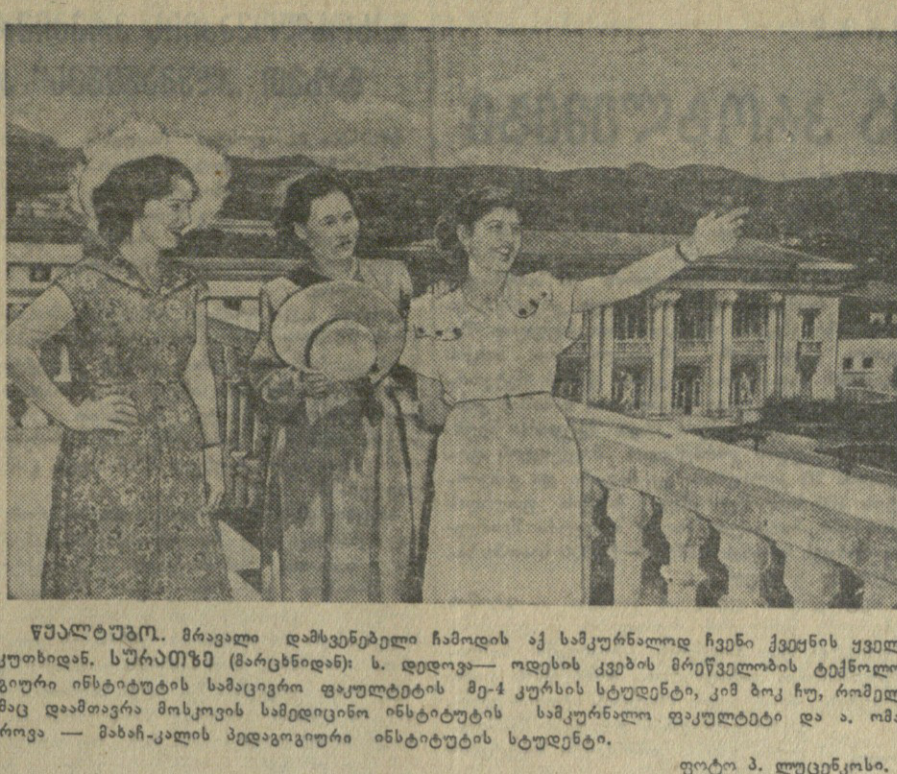
საქართველოს მრავალი დამხმარებელი ჩამოიდა აქ საქართველოში ჩვენი ქვეყნის ყველა ქართველი...

და ი. ფაშევიძის, მთავრობის წევრები, სახელმძღვანელო ორგანიზაციების წარმომადგენლები და დედაქალაქის მრავალი მოსახლე.