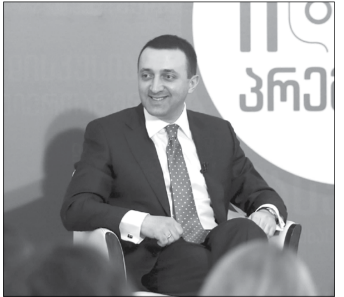
პრემიერი სტატუსსუფიქსს დაკარგავს დოქტორანტებს პრობლემის მოგვარებას დაიპირდა

საქართველოს პრემიერ-მინისტრი ირაკლი ლარიაშვილი ივანე ჯავახიშვილის სახელობის თბილისის სახელმწიფო უნივერსიტეტს სტუმრობდა. რექტორმა ვლადიმერ პაპავამ მას სიმბოლური საჩუქარი — მედალი, უნივერსიტეტის ემბლემა უსახსოვრა. ლარიაშვილმა, სტუდენტებთან შეხვედრისას არაერთ მნიშვნელოვან საკითხზე ისაუბრა და სტუდენტების კითხვებსაც უპასუხა. ახალგაზრდები „ჰუდონპისის“ თემით დაინტერესდნენ. განაცხადეს, რომ ჰესის აშენებითა და ხაიშიდან ადგილობრივი მოსახლეობის გადასახლებით, შესაძლოა, სევანური კულტურა განადგურდეს. „ვერ დაგვათხზებით. საზოგადოება არ უნდა შევიყვანოთ შეცდომაში — სევანურ კულტურას საფრთხე არ ემუქრება. საქართველო მრავალფეროვანი ქვეყანაა და ამ მრავალფეროვნების ერთ-ერთი დამცველი მე ვარ. მოქალაქეებს სწორად უნდა აუხსნათ, რას ნიშნავს ხუდონის აშენება ქვეყნის ენერგეტიკისთვის“.