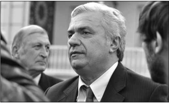
გურამ ოდიშარია გადაღდა

კულტურისა და ძეგლთა დაცვის მინისტრის თანამდებობიდან გადადგომის შესახებ ინფორმაცია აქამდეც არაერთხელ გავრცელდა, მაგრამ ყოველთვის ქორი აღმოჩნდა. მიუხედავად ამისა, პოლიტიკურ კულუარებში მუდმივად საუბრობდნენ, გურამ (მირიანე) ოდიშარიას დიდი ხანია წყალი აქვს შეყენებული და მალე მოუწევს სახლში წასვლაო, მიზეზად კი, იმას ასახელებდნენ, კულტურის სამინისტროში მოსვლის დღიდან, პოეტ მინისტრს, რეალურად, არაფერი გაუკეთებიაო. პრინციპში, გურამ ოდიშარიამ კულტურის სფეროში არსებული ვერც ერთი პრობლემა ვერ მოაგვარა. მისი, როგორც მინისტრის მოღვაწეობა, მხოლოდ უკრაინაში სისხლიანი აქციების ფონზე, თბილისში „რუსული რომანის საღამოს“ ჩატარებით და უწყებაში 160 კვ ყავის შექმნით შემოიფარგლება. ვინმემ არაობიექტურობაში ბრალი რომ არ დაგვდოს, სხვა საქმეებსაც გავისხენებთ. მაგალითად იმას, რომ სწორედ მისი მინისტრობის დროს დაიხურა რადიო „მუზა“, განახევრდა ჯაზფესტივალის ბიუჯეტი, დღემდე ვერა და ვერ გადაწყდა საყდრისი-ყაჩაღიანის საბადოს ბედი... ამ ფონზე გასაკვირი არაა, რომ გურამ ოდიშარია დაილა და წასვლა გადაწყვიტა. დიას, დაილა — „ვერსიის“ წყაროს ინფორმაციით, სწორედ ეს სიტყვა უნერია მინისტრს განცხადებაში, რომელიც კანცელარიაში უკვე რეგისტრირებულია და რომლითაც შევულებს აღებას ითხოვს. როგორც ჩანს, ოდიშარიამ წასვლის უმტკივნეულო ფორმა არჩია „გადავიღალე. ჯანმრთელობის მდგომარეობის გამო, გთხოვთ, შევულებში გამიშვათ“, — დანერა ოდიშარიამ და მოვალეობის შესრულების ესტაფეტა მოადგილეს, ალექსანდრე მარგიშვილს გადაულოცა.