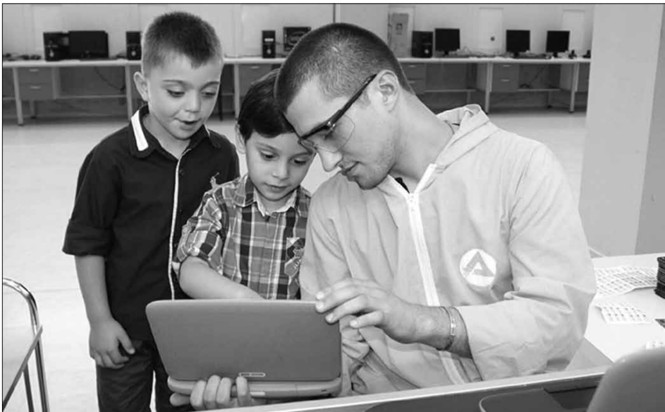
მოსწავლეების ბუკები ახალი დიზაინის დეკორაციებით იცვლება