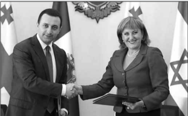
ისრაელსა და საქართველოს შორის უვიზო რეჟიმი ამოქმედდა

ამის შესახებ ინფორმაციას ადგილობრივი მედია პარტია „ჩემი სახლი ისრაელზე“ დაყრდნობით ავრცელებს. თითოეული ქვეყნის მოქალაქეებს საქართველოსა და ისრაელის ტერიტორიაზე ყოფნა 90 დღის განმავლობაში უფიზოდ შეუძლიათ. ქვეყნებს შორის უვიზო რეჟიმის საკითხი საქართველოს პრემიერ-მინისტრმა ირაკლი ღარიბაშვილმა (მაშინდელი შს მინისტრი) და ისრაელის შს მინისტრის მოადგილემ ფაინა კირშენბაუმმა განიხილეს.