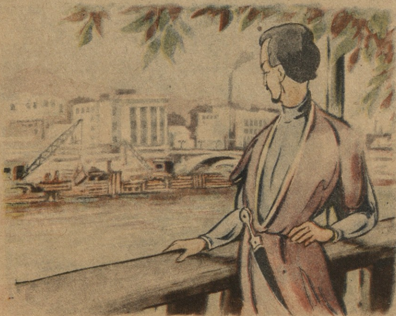
მოქმუის მტკვარი, მოქრის ნაფი და შრიალითა არხეცს ჩინარსა..

ორი მეგობარი სასაპირიზე ერთმანეთს შეხვდა: