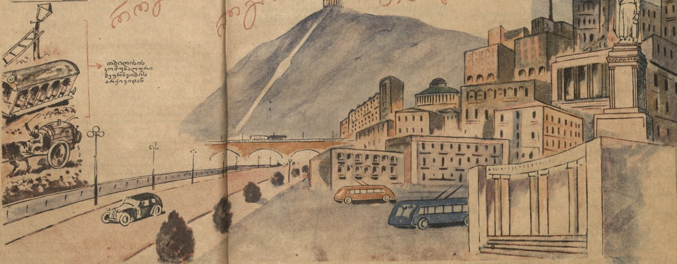
თბილისის კომუნალური მეურნეობის არქიტექტიკი

როგორ აწუხებენ მტრები როგორ აწუხებენ მოსახლეობა როგორ აწუხებენ თბილისს.