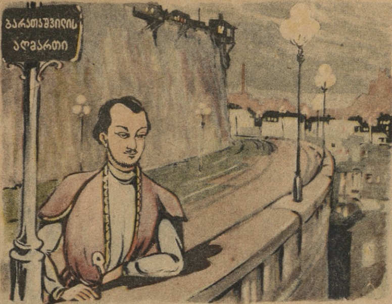
...გულის სწორი... აგრე როგორ შეიცვალე?