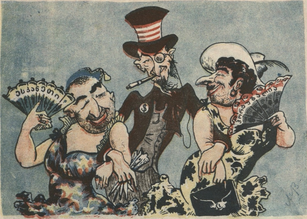
ამერიკელი მიჯნური და მისი ორი ახალი სატრფო.

აი, ციფრებით მე რვეულს ვაგებ, ამ ანგარიშით ზუსტად ითქმება, როდის ვინილავთ მეტეორს ცაზე, მზის დაბნელება როდის იქნება