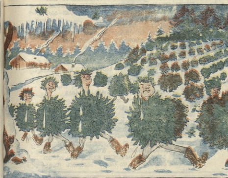
2. აღამაწა (ამ. ჭ. ე. ბატაძემ) გულხილი დამოკლებულდებს შე- ...და სიბოხს ჩაუნერგა ჩაი.

ლო-სამეფური მცენებრებათა დოქტორის ამა. ჭ. ე. ბატაძის მიერ გამოქვეყნებული სახელგაბი... ...ქართული № 21 უნდადნ მერ სიყვინთა და იმდენად დიდ მოსაგლს.