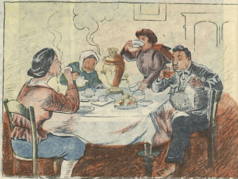
1. ჩაი იმუშავებდა სიბოხს აღამაწა... ...და სიბოხს აღამაწა...

ლო-სამეფური მცენებრებათა დოქტორის ამა. ჭ. ე. ბატაძის მიერ გამოქვეყნებული სახელგაბი... ...ქართული № 21 უნდადნ მერ სიყვინთა და იმდენად დიდ მოსაგლს.