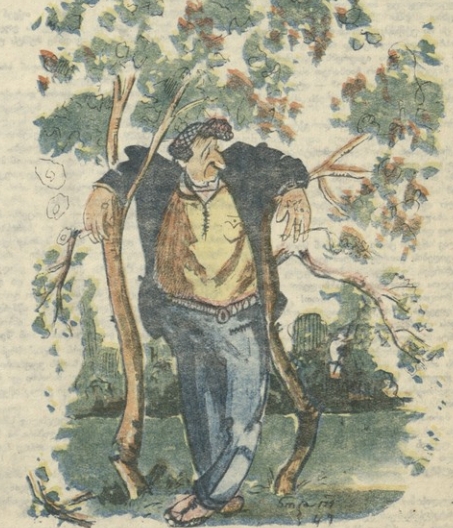
მე რომ ელოობ, შენ ჩას გიშლი, მშობილო!