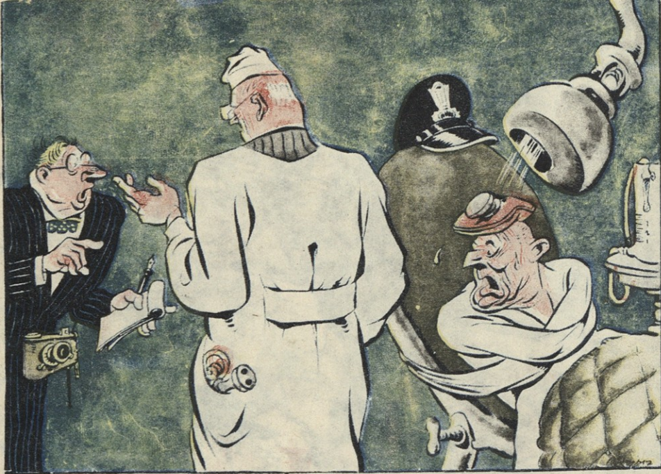
—ეს მღელვარეთა განყოფილებაა? წყნარი გიუები სადღა იმყოფებიან? —ნაწილი შერხტის გაზეთების რედაქციებში, ნაწილი, კონგრესში დანარჩენები აქეთ-იქით არიან გაბნეულნი!..

—ჩუ-დეს ყველა ჯარისკაცი დიდ მადლობას სათქმელია, დღეს ჩინეთის შინაარსი სულ მწესავით ნათელია.