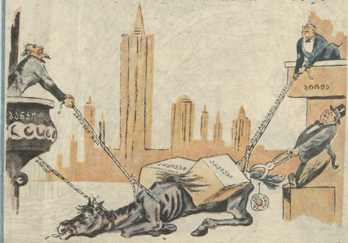
კრიზისის ტვირთს ეს ჯაგლავი როგორ წაუტყევა: ეწვიან, ეწვიან და ვერ აუწევიან!

ამერიკისა და ინგლისის ბირჟებზე დღითიდღე ეცემა აქციების კურსი. ბირჟებზე პანიკაა.