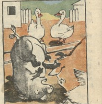
3. არა გრცხვინია, უფრო... არა გრცხვინია, უფრო...