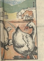
1. სადგურის უფროსის ა. ჯაბაძის წინაშე... სადგურის უფროსის ა. ჯაბაძის წინაშე...