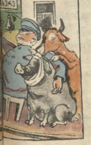
4. რის უფროსს კი არა... რის უფროსს კი არა...