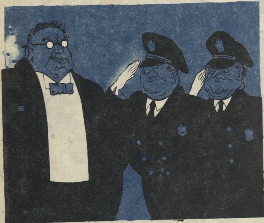
— ბრალდებულ შახტო! ლიუდვიგსბურგის სადენაციფიკაციო სასამართლოს გადაწყვეტილებით თქვენ უნდა ჩაგვხვდეთ... დასავლეთ გერმანიის მეურნეობის მინისტრის სავარძელში.