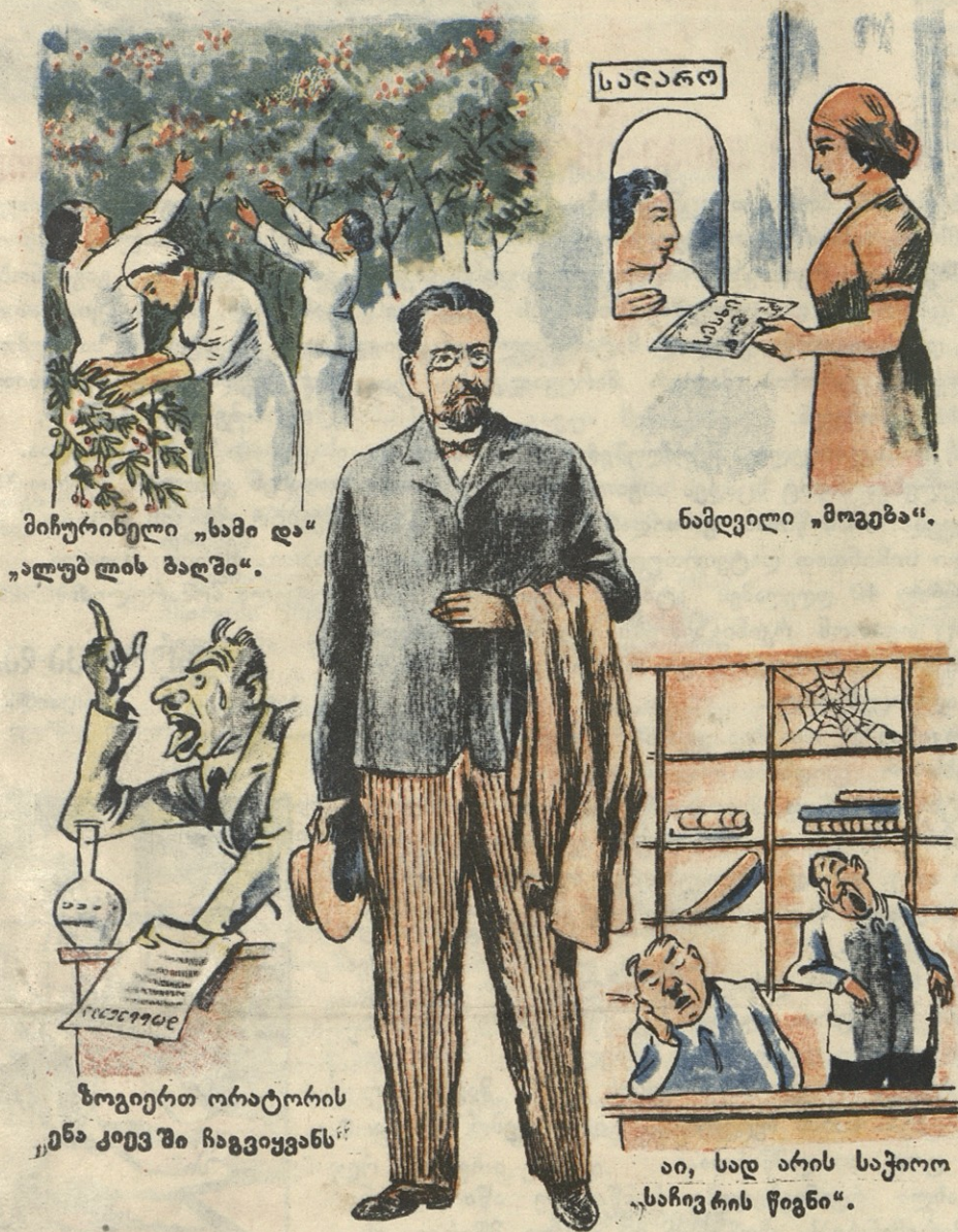
მიჩურინელი „სამი და“ „ალუბლის ბაღში“.