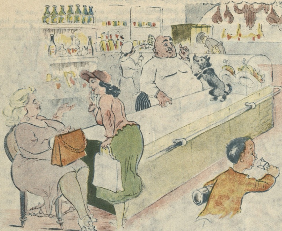
— ისეთი ჰკვიანია ჩემი ყურში, რომ ქურდს სუნითა ცნობს. — მე კი მიკვირდა, რომ შენს ქმარს სამსახურშიც არ ცილდებოდა!