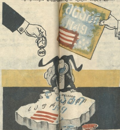
რა სწავლა, იცით, ბილდის საფრანგეთი სურს გაუიღოს! რომ ვით უნაქვს—ქია სესის! ჯაკეპე უფლებ დაიკიდოს!