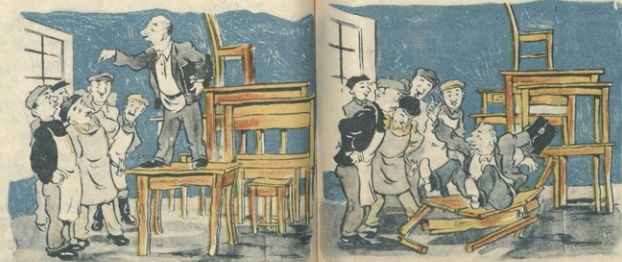
1.—ჩვეთვის დიდად ხახაქულაო, ამხანაქე რომ ჩვენსა ხახაქურს მავლებს დამაზადებს გვეპე 11! 2.—პროცენტენ შეხარულა...