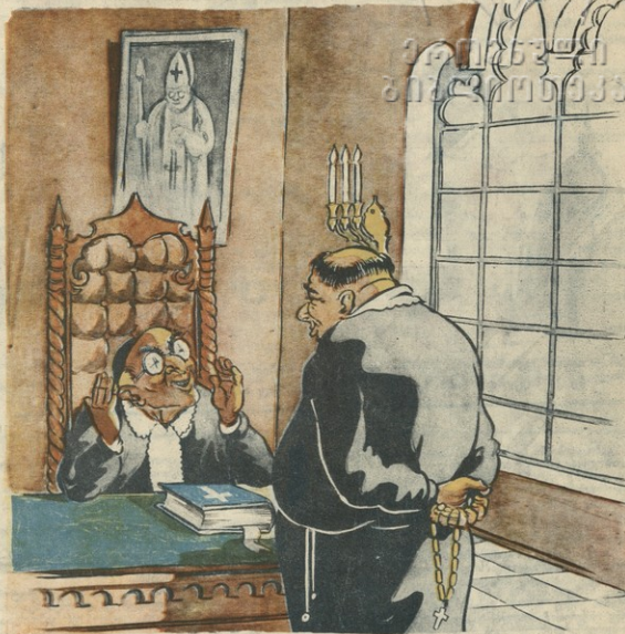
— როგორა აწარმოებთ ტროსთან მოლაპარაკებას, როცა ის ანათებს გადაცეით? — რა ბრძანება, ანათებს კი არა, უფლებსტრებს გადაცეით, ის ხომ ჩვენი სული-ერი შეიღია!