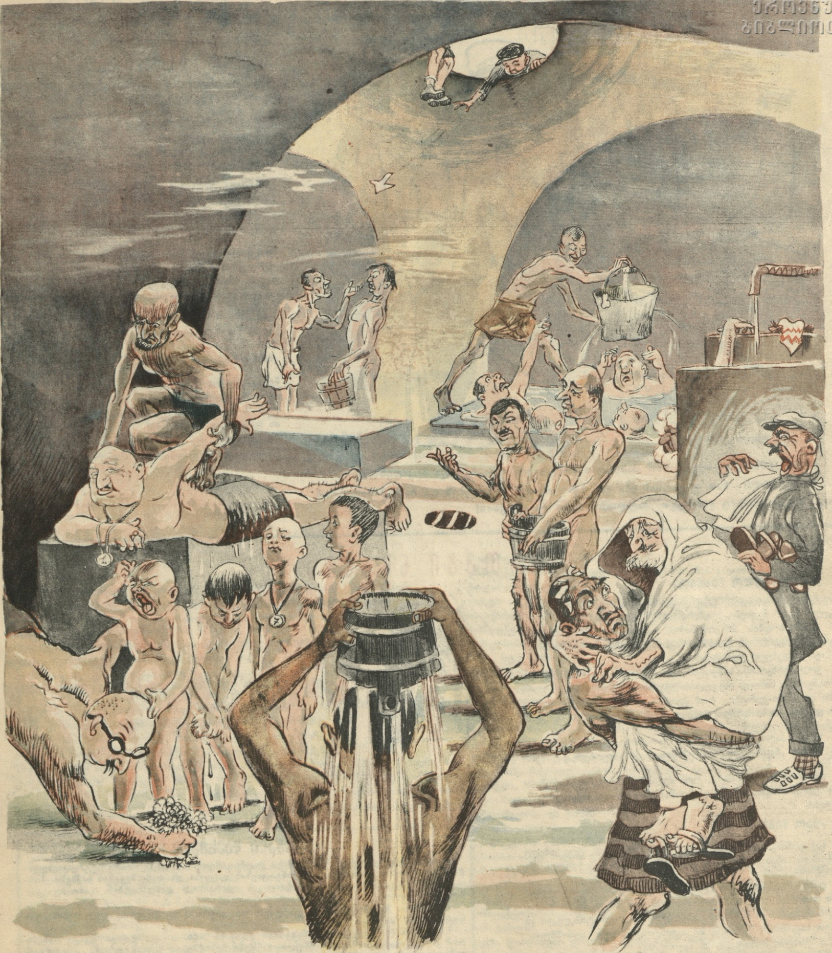
— ხედავ, რა მაგარი ზურგი აქვს ამ ჩვენს დირექტორს! — მაგარი ზურგი ქისამ იცის, ბიძია, ქისამ!

სარედაქციო კოლეგია: გრ. აბაშიძე (პ. მგ. რედაქტორი), აკ. ბელიაშვილი, ი. გრიშაშვილი, უ. ჯაფარიძე, კ. კალაძე, ი. ნონეშვილი (პ. მგ. რედაქტორის მოადგილე), ს. ფაშალიშვილი.