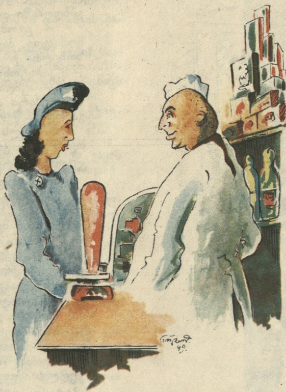
—ამიწონეთ 350 გრამი კარაქი უქალაღოდ! —ესეიგი თქვენ 400 გრამი კარაქი გნებავთ?