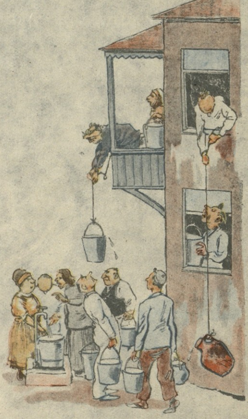
წყლის ზიდვა წყალსაზიდის ქუჩაზე.

სარედაქციო კოლექცია: გრ. აბაშიძე (პ. მგ. რედაქტორი), აკ. ბელიაშვილი, ი. გრიშაშვილი, უ. ჯაფარიძე, კ. კალაძე, ი. ნონეშვილი (პ. მგ. რედაქტორის მოადგილე), ს. ფაშალიშვილი.