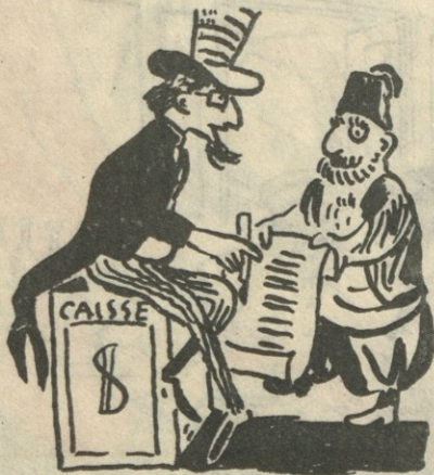
— ხომ არ ინებებთ მისტერ, დაგვიმტკიცოთ მთავრობის ახალი კაბინეტი? (ფურნ. „სტრუელი“ (ბულგარეთი))