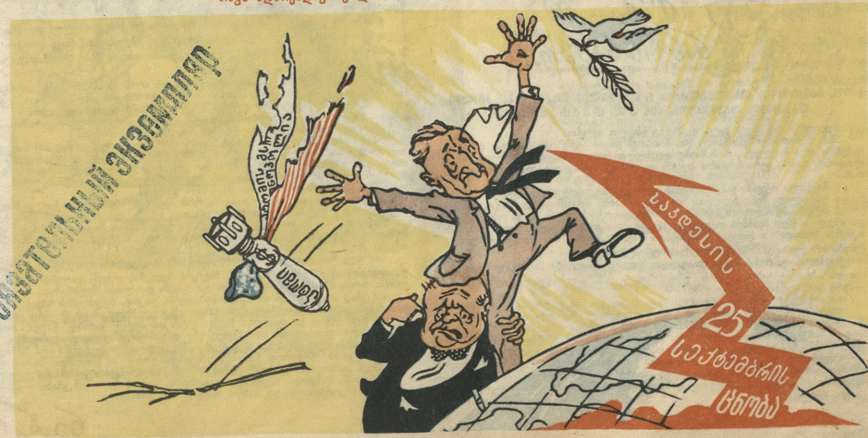
მაგრამ წაუხდათ ოცნება, დღე გაუთენდათ შავია.