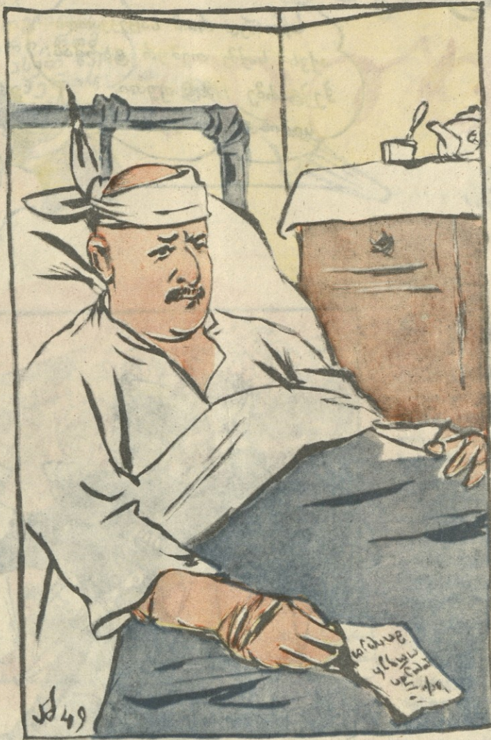
ავადგყოვი ბიუროკრატი—თავს იგდებს ეს ექიმი, ამდენი დრო სადა მაქვს, რომ დღეში ორჯერ მივიღო!

ლამაზია მისი გზები, მისი მოსახლეობა. კარგი არის, მომხიბვლელი აჭარისწყლის ხეობა. ამშვენებენ, ალაღებენ მას მთები ახოვანი. ეს ხეობა იყო, თურმე, ერთ დროს ვენახოვანი. ძველად, აქაც შემოდგომის ოქროს კარებს ალბდნენ. აქაც ღვინოს სწურავდნენ და აქაც რთველს აჩაღებდნენ. არ აკრთობდათ შემდეგ ზამთრის თოვლი და ნამქერები, რადგან ჰქონდათ ჩვენს წინაპრებს ღვინით სავსე ქვევრები. ბევრი სუფრა ჰქონდათ, თურმე, წითელ ღვინით ნაპკური; ჰქონდათ, თურმე, ბევრი ლხინი, ლხინი მამა-პაპური. მაგრამ, შემდეგ მოსაპეს იგი უღმობელ მტრის ხელგამა, ასჭრეს ვაზი და აკაფეს თურქმა დამპყრობლებმა. მის სიკარგეს, მის სიკეთეს არა, არ მოერიდნენ. და სათუთ ვაზს, ისე როგორც მოსისხლე მტერს, დევნიდნენ. სჩებდნენ, სჭრიდნენ,—აოცებდათ, მაინც არ იღვოდა. ნასაყდრალში, ტყეში, ხეზე ვაზი იმალებოდა. ის ხარობდა ჩუმად ტყეში, ლამაზ ამბავს ყვებოდა. სამასი წლის დევნილს მაინც გული არ უტყდებოდა. ვაზო, ვაზო, ტკბილო დაო, დევნილო და ტანჯულო. კვლავ გამხდარხარ პირმცინარე შენ, ყურძენო კლარჯულო. ისევ გაგინათებია ვაზო, სახე ნათელო; აჭარაში კვლავ გალადებს საბჭოთა საქართველო. ბაღებში კვლავ შემოსულხარ ლალი და ახოვანი, ისევ გაზდნენ აჭარისწყლის მთები ვენახოვანი. შენს ზერებს ისევ ნამავს წვიმა და მზეში იჭორფლები. კვლავ გეტრფიან ძველი ხულოს, ძველი ქედას სოფლები.