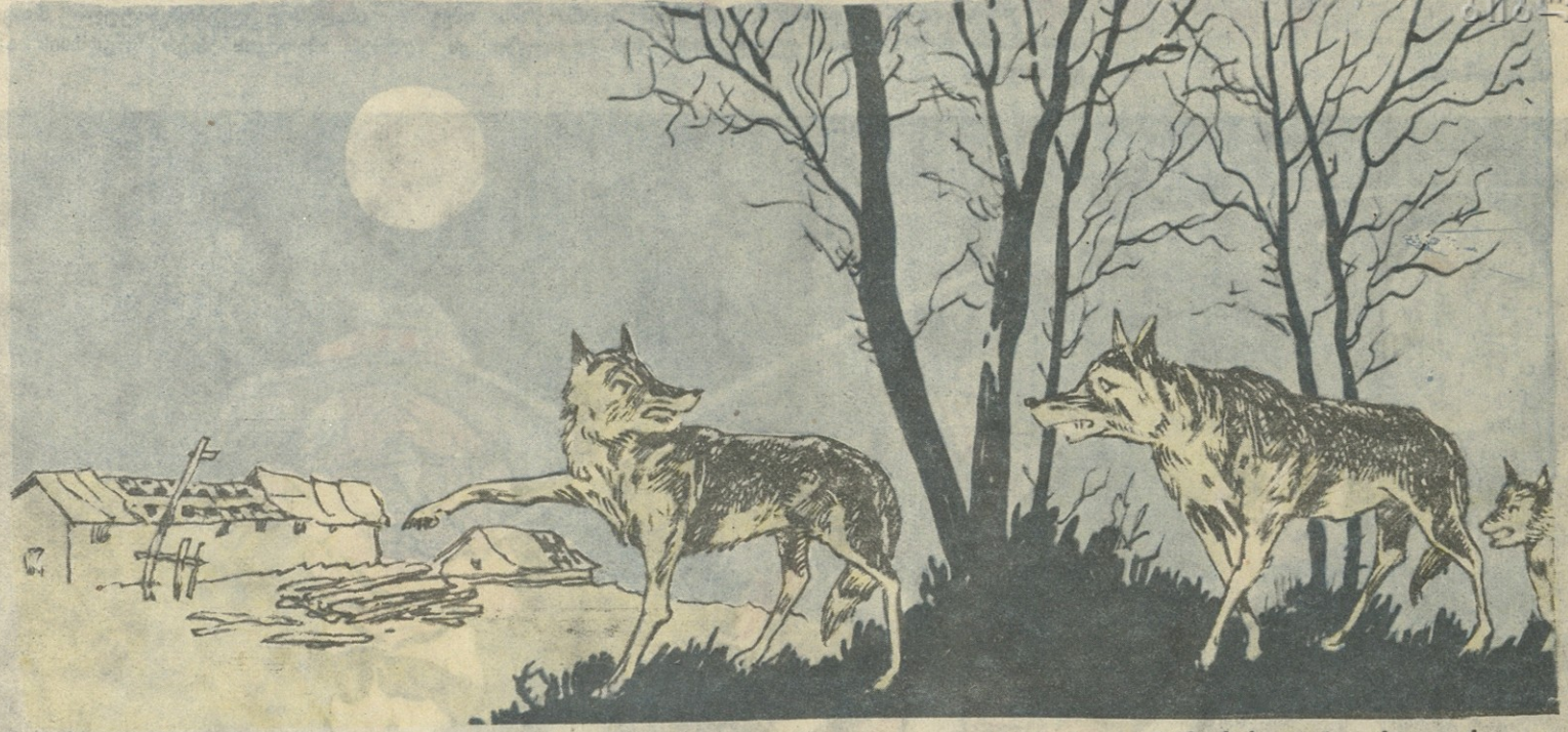
— დამშვიდებით ელოდეთ ზამთარს, ბიჭებო, აქედანვე ვატყობ, რომ წელს ზამთრისათვის არავითარი მარაგის შენახვა არ დაგეგვირდება!