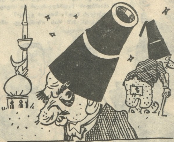
ამერიკული ფასონის ახალი თურქული ქუდეები.