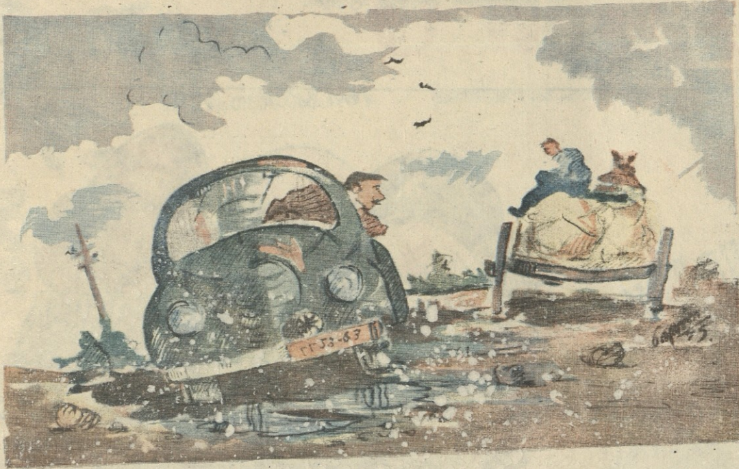
— გაიგა, ჩვენს თავმჯდომარეს მისი ხეობა. — ვიცო, ჩვენს დირექტორად დანიშნეს.