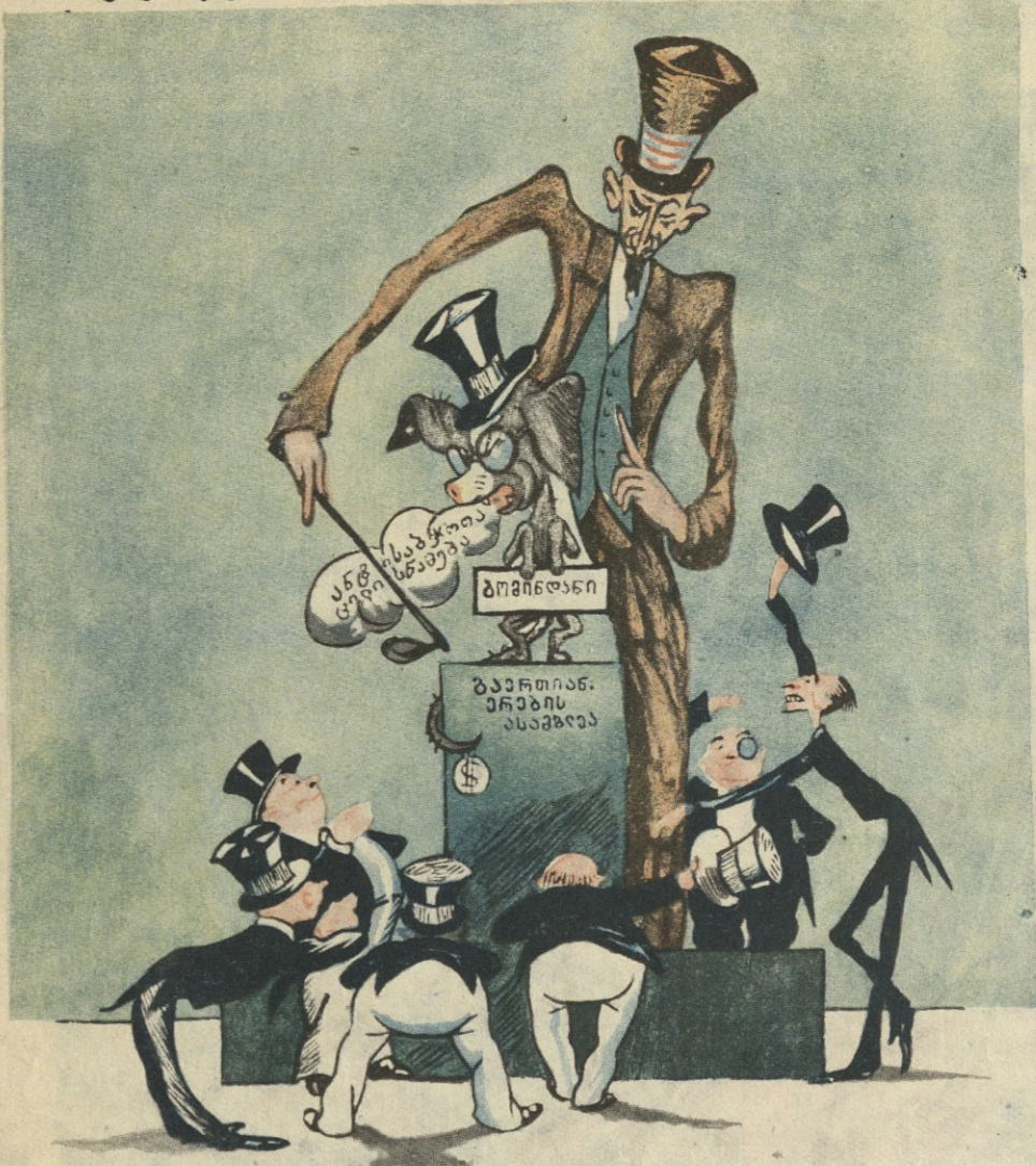
ქუცი, ქუცი, ცზიან-ტინ-ფუ, შეუყვამე, ნუ ხარ უქმად, ტყუილად ხომ არ გაკმევენ სამოწყალოდ პურის ლუკმას?