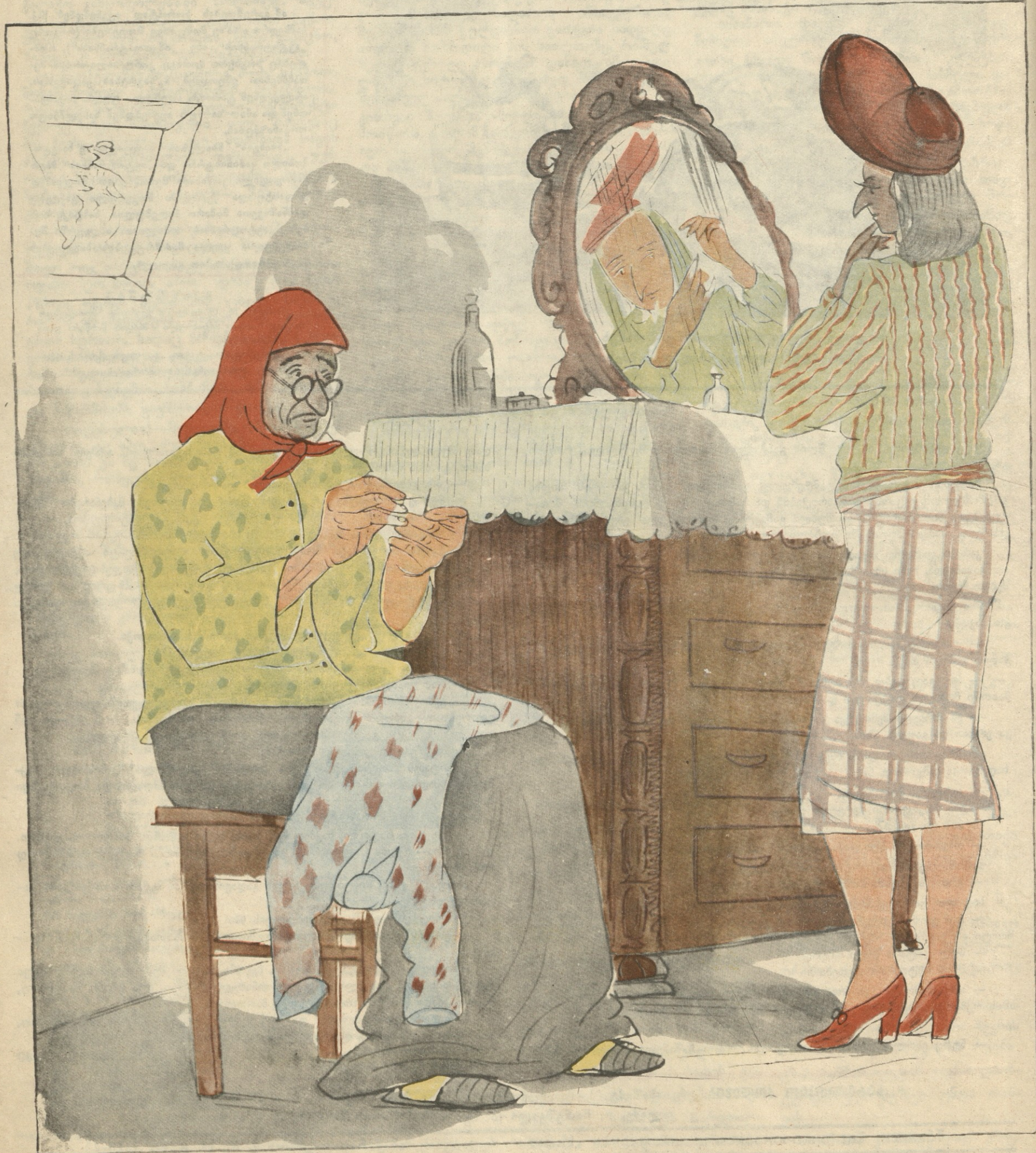
— დავიღუპე და ეს არის. დღეს სკოლაში კომისია მოდის და ჩემმა მოწაფეებმა საგანი არ იციან! — შენ ვინ რას ვეტყვის, შეიღო, როგორ, იცოდი და არ ანწავლე თუ?!