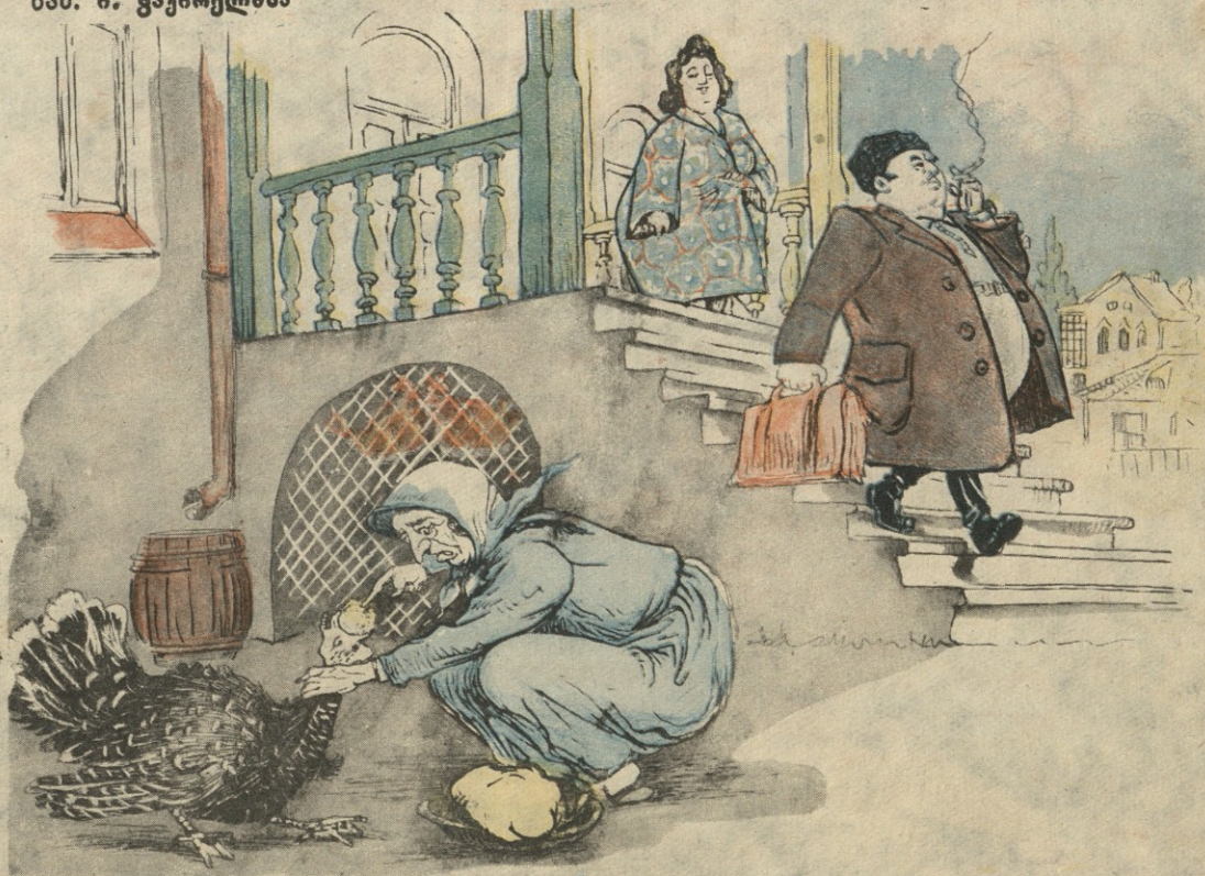
— არ გავხარ შენს პატრონს? ძალათ გაყლაპებ და კამა მაინც გეზარება!

სარედაქციო კოლეგია: გრ. აბაშიძე (პ. მგ. რედაქტორი), აკ. ბელიაშვილი, ი. გრიშაშვილი, უ. ჯაფარიძე, კ. კალაძე, ი. ნონეშვილი (პ. მგ. რედაქტორის მოადგილე), ს. ფაშალიშვილი.