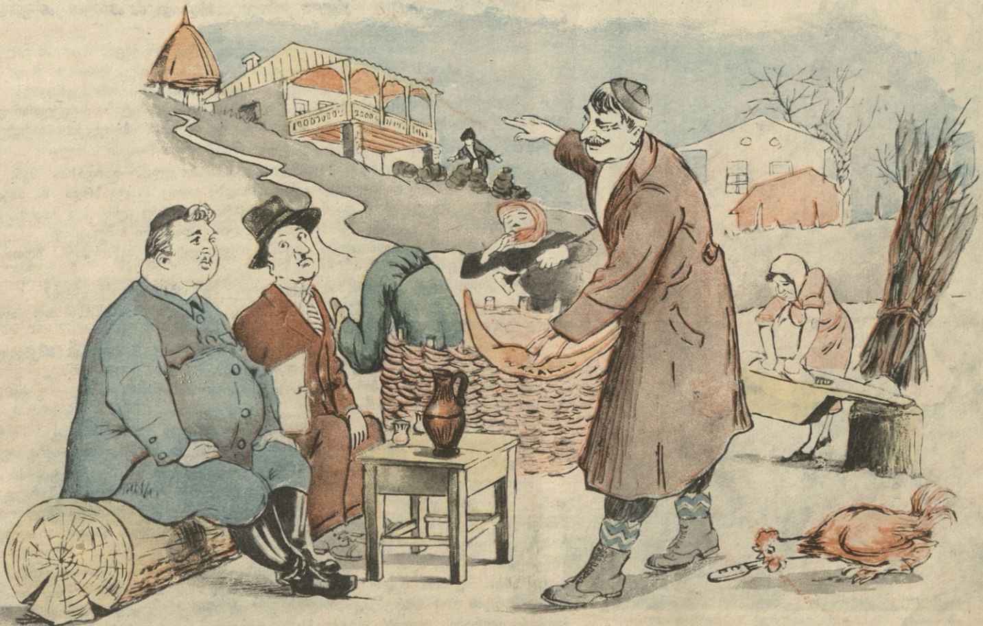
— ეს თბილი პური აქ ისამოვნეთ, ღვინო კი, სულ ბახახ რომ შეახვედრეთ, იქ მიირთვიეთ!

ზოგიერთ კოლმეურნეობაში ადგილი აქვს პროდუქტების არასწორ განაწილებას. ერთი სახის პროდუქტი კოლმეურნეთა ერთ ნაწილს ხვდება დიდი რაოდენობით, მეორე ნაწილს კი—მეორე სახის პროდუქტი.