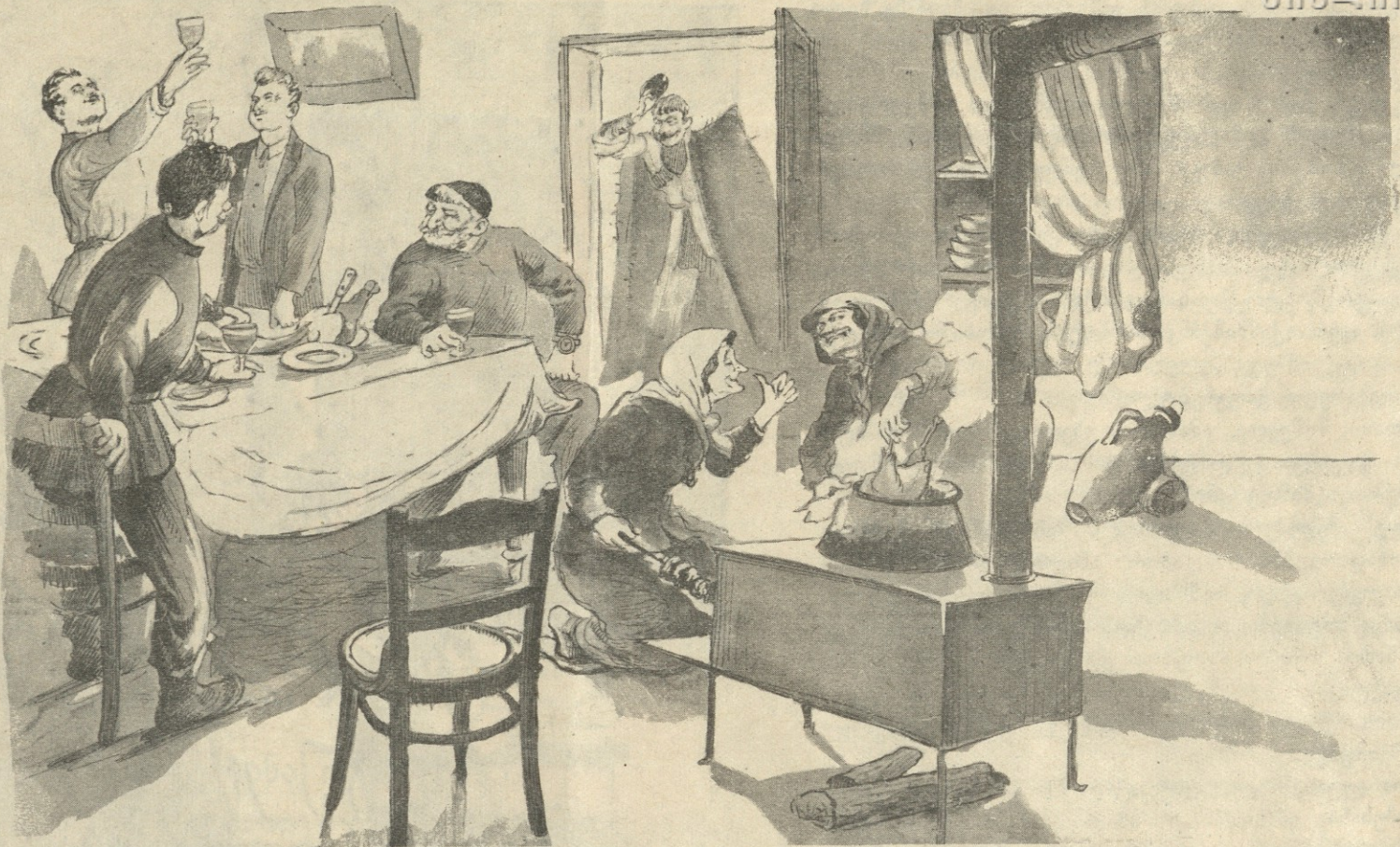
— ამ ჩვენს ბრიგადირს სული მისდის პირველობაზე: წელს პირველად აძლევს ხმას და ახლა თამადასაც ეღაფება: პირველად მე უნდა ვთქვა ჩვენი კანდიდატის სადღეგრძელოო.