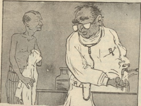
— თქვენი ორგანიზმს განიცდის შპიკოს ნაკლოვანებას, უტყარს ხაზულაბა... ხმა მისცეთ კონსერვატორებს.