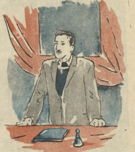
ილუსტრაციები ა. ბანქაძისა